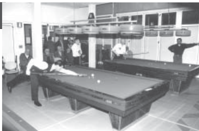
Nella foto Travaini: un momento delle recenti competizioni provinciali nel salone biliardi.

In un passato alquanto remoto, nei bar del centro storico di Sermide, il gioco del biliardo era assai diffuso. Gli amanti della stecca e delle bocchette erano numerosi. Con le successive scomparse del caffè delle sorelle Bertelli, del bar Daila, nonché l'eliminazione del biliardo al piano superiore del Caffè Grande, non se n'è visto uno fino a quando, recentemente, il Circolo Arcinova ne ha installato uno nei locali di via Fratelli Bandiera. Questo, fino ad un paio di settimane fa, era l'unico. Adesso non più. In questi giorni