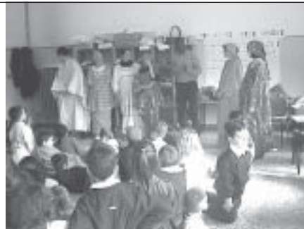
Un momento della festa in costume a scuola

Sono state inoltre allestite, per gentile concessione del Centro Interculturale di Mantova, le mostre: "L'Europa si beffa del razzismo" presso la scuola media di Sermide; "Nero che piu' nero non si può" presso la biblioteca