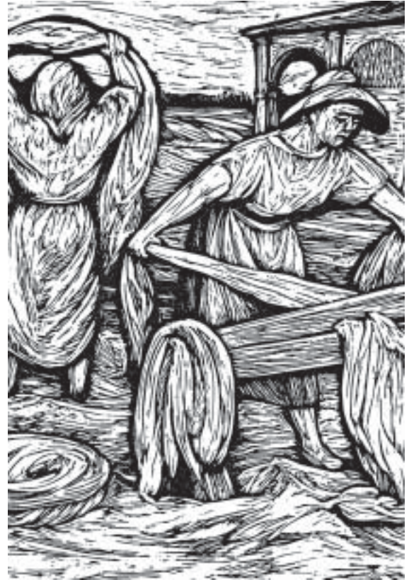
Litografia di Egidio Pecorari

Il lavoro di filatura era eseguito in autunno-inverno in stalla. Si disponeva un gargiuolo sulla parte conica della "roca", lo si comprimeva con un cartoncino conformato ad imbuto, si tiravano alcune fibre, lasciandone gli estremi ancora impigliati con le altre