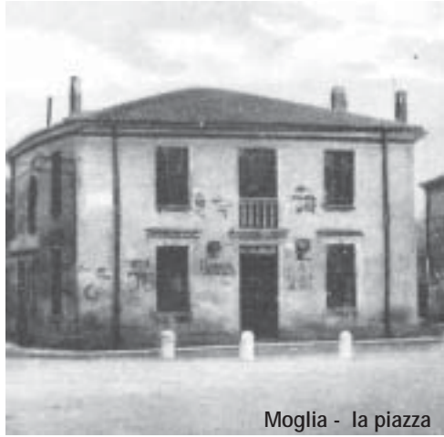
Moglia - la piazza