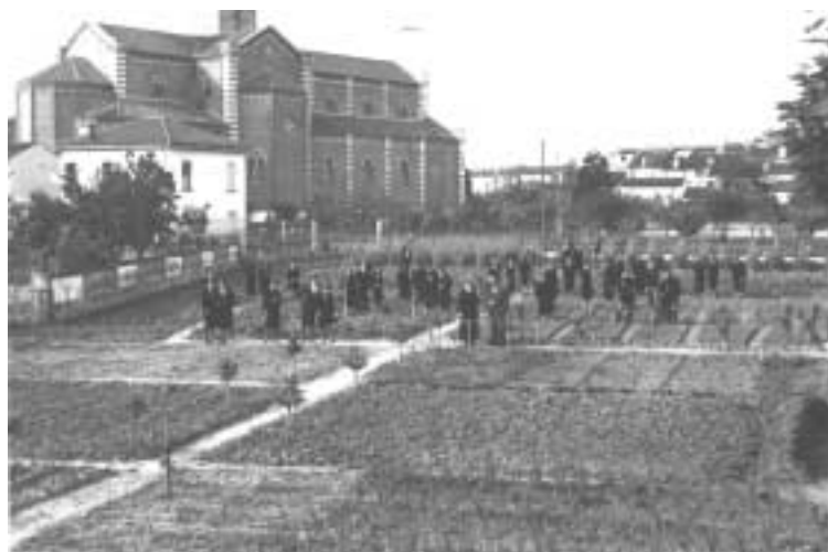
Nella foto: Il campo didattico

Durante i primi anni di guerra, il regime tentava di dare un'apparenza di normalità alla vita di tutti i giorni e non mancava occasione per accentuare il dignitoso comportamento delle Istituzioni e delle famiglie italiane, mentre i soldati combattevano al fronte.