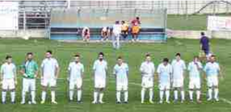
La formazione sermidese nella gara con la Poggese