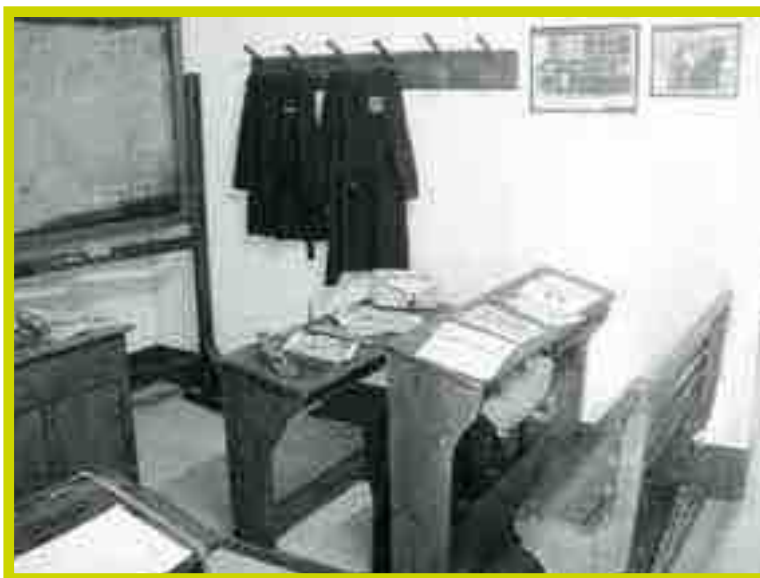
Scorcio di aula scolastica anni '50