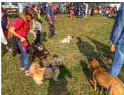
Un giorno a "4 zampe"