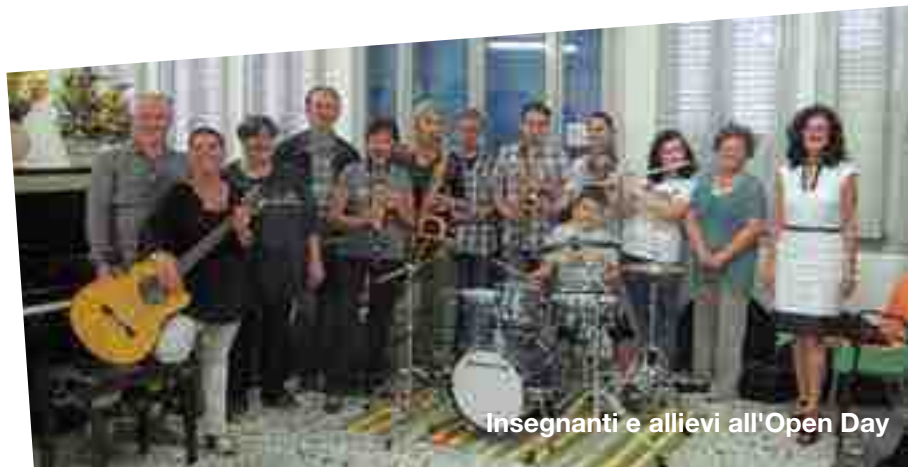
Insegnanti e allievi all'Open Day

L'Associazione comunica che si sta attivando il corso di Musica d'Insieme aperto a tutti coloro che vogliano suonare e cantare in compagnia. Non sono necessarie competenze particolari perché a ciascuno sarà affidata la parte che è in grado di seguire.