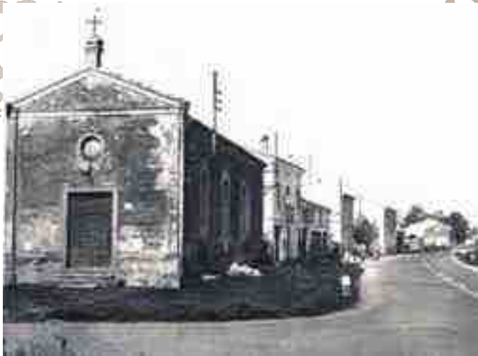
la chiesa negli anni '60-'70