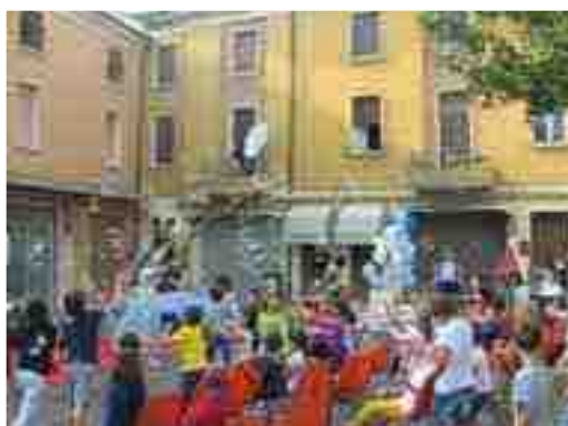
Palloncini e bolle di sapone per i più piccoli