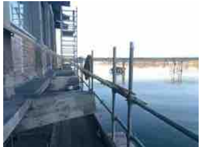
Teleferica, ristrutturazione 2015

Gli interventi sull'area esterna hanno l'obiettivo di potenziare l'offerta turistico-ambientale del territorio migliorando e differenziando i servizi, al fine di inserire Sermide in circuiti turistici fluviali: