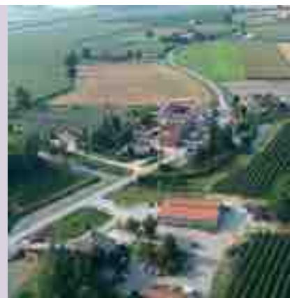
La strada provinciale ferrarese che da Porcara porta a Sermide

"E' arrivato l'ambasciatore" e "Mattinata fiorentina" ecco erompere "Reginella campagnola" subito seguita dai maschietti con il noto arrangiamento sboccato del ritornello: la solita Rosina detentrica di un attributo anatomico oggetto di promesse mai mantenute. Le pudiche verginelle falsamente scandalizzate non si univano al coro ma ascoltavano ridacchiando; alle Gorne uno spiritoso intonò per burla quella del "cavallino", canzoncina voluta dal regime per convincere i benestanti a rinunciare alla "Topolino". Il coro si irrobustì. Il ritornello scurrile coinvolse l'intera