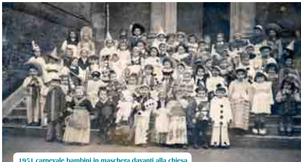
1951 carnevale bambini in maschera davanti alla chiesa

molto belli. I bambini possono indossare costumi fatti in serie molto belli che rappresentano svariate figure di personaggi o animaletti. Nelle scuole si festeggia il Carnevale con varie iniziative. Si ha l'impressione, tuttavia, che l'atmosfera anche se allegra, sia differente da quella degli anni '50 e '60, più fredda e forse più rivolta al tutto pronto: basta soltanto acquistare ciò che serve.