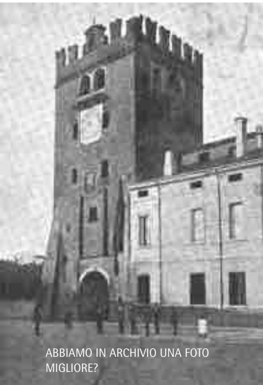
ABBIAMO IN ARCHIVIO UNA FOTO MIGLIORE?

◆ Dove si scopre che personaggi già noti ai lettori di Sermidiana furono implicati in un precedente fatto di sangue