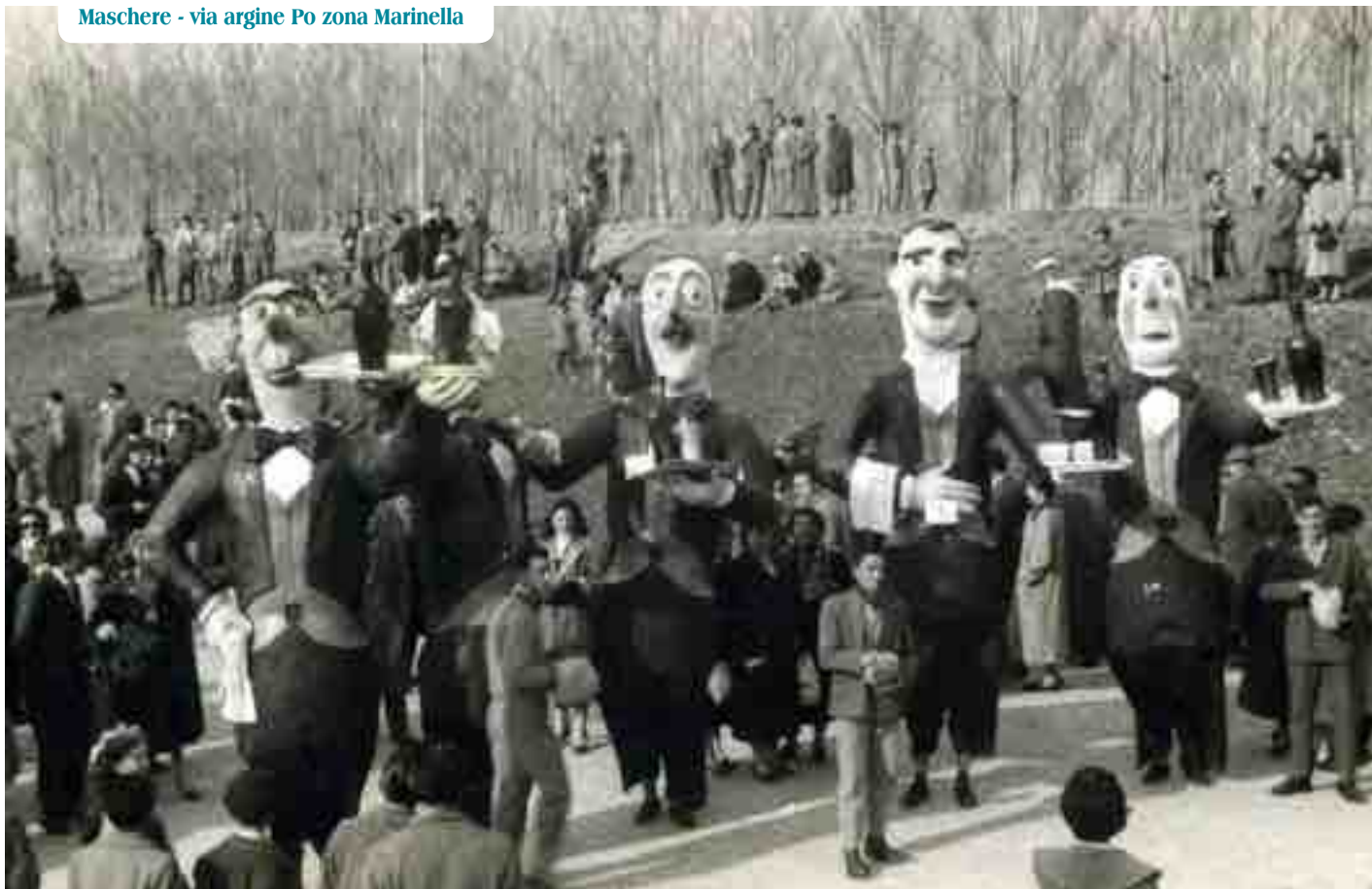
Maschere - via argine Po zona Marinella

si vestivano con quanto disponevano; poveri stracci, parrucche fatte con paglia. Gli uomini si vestivano talvolta da donna, i servi da padroni prendendosi in giro. I ragazzi indossavano abiti miseri e mascherine fatte in casa; i bambini giocavano nelle stalle o nei cortili con semplici giochi. Ancora a quell'epoca i ragazzi, il giovedì grasso, andavano per le case con una sportina di paglia e con un legno appuntito (sprocc) nel quale le "rasdore" infilavano in offerta un salsicciotto o una fetta di lardo. Qualche volta venivano dati in offerta altri prodotti come frutta, castagne, biscotti messi nella sportina di paglia che si portavano sempre appresso. Bussando alla porta, i ragazzi recitavano la cantilena: "la rasdora da sta ca', na qual roba las darà, las darà un salamin, cal metrém in dal spurtin...salutém e ringrasiém, a gnarém anca st'an quegn...". Questa usanza si è oramai interrotta da anni. Ricordo i Carnevali di quegli anni, molto partecipati, ben organizzati: sfilavano carri allegorici di pregevole fattura, preparati dal Gruppo Carnevale Sermide-