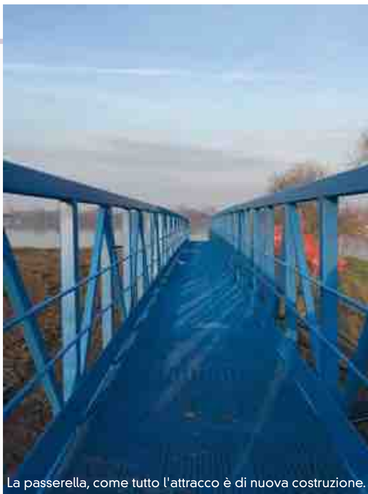
La passerella, come tutto l'attracco è di nuova costruzione.