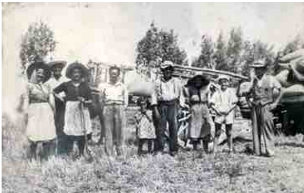
AZIENDA ZANIBONI 1950

A SANTA CROCE L'AZIENDA AGRICOLA ZANIBONI-MANFREDINI COMPIE CINQUANT'ANNI