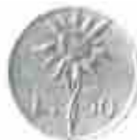
PROGETTO LIRE 10 STELLA ALPINA