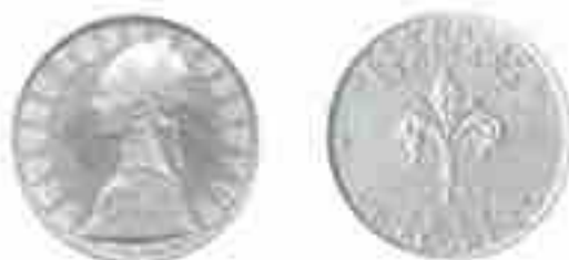
PROGETTO LIRE 500 1957 GIGLIO DI FIRENZE