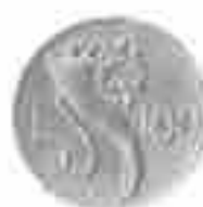
PROGETTO LIRE 100 CORNUCOPIA