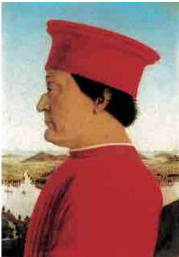
PIERO DELLA FRANCESCA, RITRATTO DI FEDERICO DA MONTEFELTRO

◆ Il Po costituì per l'intero Medioevo la principale arteria per il commercio del sale nel nord Italia. In quell'epoca non si disponeva di molte tecniche per la conservazione dei cibi, i cui sapori spesso non restavano gradevoli a lungo. Carne e pesce, in particolare, si potevano conservare solo mediante salatura. I costi di produzione del sale erano relativamente bassi, quelli di trasporto, al contrario erano molto elevati. Per questo, da sempre, le vie del sale furono vie d'acqua. Inizialmente fu Comacchio a controllare il trasporto del sale verso Mantova e da lì verso le valli bresciane e bergamasche. Con la decadenza di Comacchio fu Venezia a detenere, fino al XVI secolo, il dominio nei traffici nell'Italia settentrionale e nell'area mediterranea orientale.