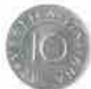
PROGETTO LIRE 10 1951 GRANDE 10