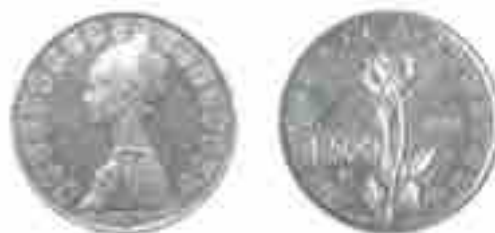
PROGETTO LIRE 500 1957 ROSA