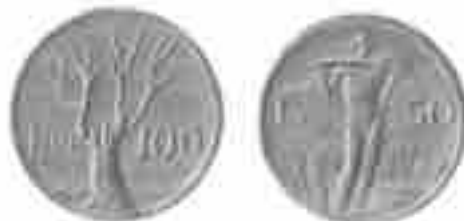
PROGETTO LIRE 500 FALCIATRICE + ALBERO