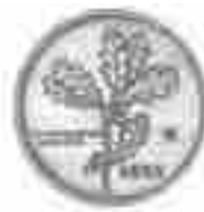
PROGETTO LIRE 20 1955 GRANCHIO