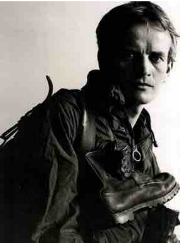
BRUCE CHATWIN NEL CELEBRE SCATTO DI LORD SNOWDON

◆ In "On the road" (trad. it. "Sulla strada"), di Jack Kerouac, pubblicato nel 1957, il viaggio coincide con la vita ed è metafora sia del tentativo di dare un senso liberatorio al personale esistere sia della volontà di denuncia delle soffocanti convenzioni sociali del tempo.