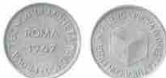
PROGETTO ROMA 1947