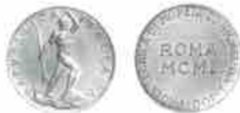
PROGETTO LIRE 100 ROMA 1950