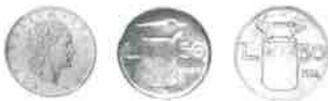
PROGETTO LIRE 50 1954 INCUDINE

Purtroppo per problemi di spazio e di impaginazione e visto che i pezzi da esporre sono parecchi ci scusiamo con i nostri lettori ma non riusciamo a proporre in foto tutte e quante le monete, inoltre non avendo a disposizione gli esemplari originali, per i motivi già esposti in precedenza, ci dobbiamo accontentare di foto in bianco e nero prese dai testi di riferimento del museo della Zecca.