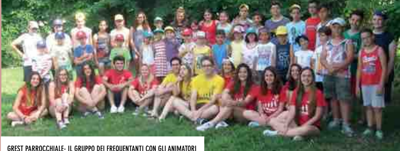
GREST PARROCCHIALE- IL GRUPPO DEI FREQUENTANTI CON GLI ANIMATORI