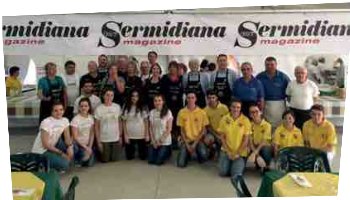
I SINDACI CAMERIERI ALLA PRIMA FESTA DEL TARTUFO ESTIVO

PER RILANCIARE I 14 COMUNI DELLA STRADA DEL TARTUFO