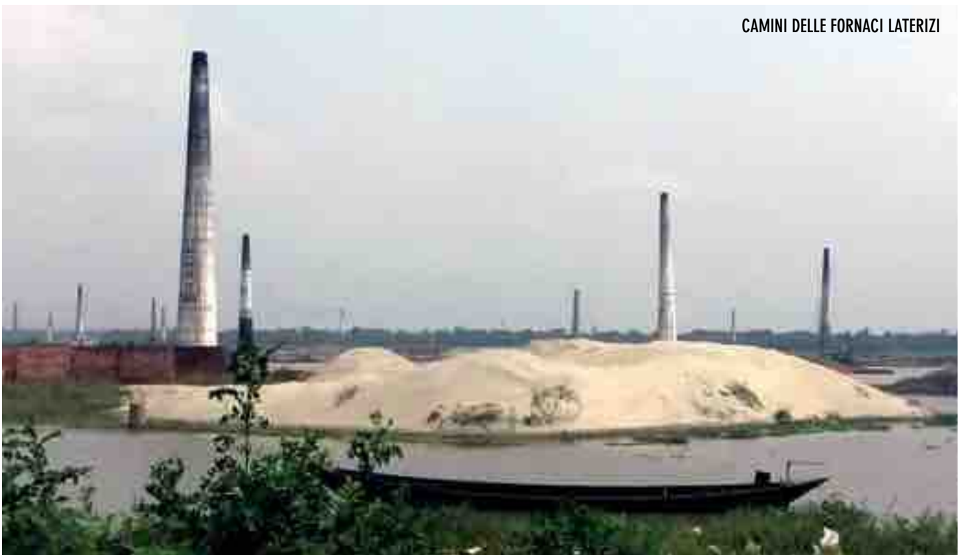
CAMINI DELLE FORNACI LATERIZI

Altra curiosità: il vecchio camion con motore diesel che, però, viene alimentato dalla grossa bombola di metano (non la sola) ospitata sotto il piano di carico. La vetustà del mezzo è stata ingentilita dalle colorate decorazioni.