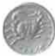
PROGETTO LIRE 50 GRANCHIO