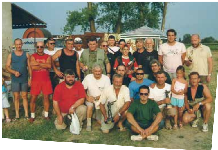
GRUPPO FEDERCACCIA SERMIDE: MANIFESTAZIONE CON SCOPO BENEFICO

Un grazie di cuore soprattutto dagli specialissimi alunni della Scuola Potenziata e delle loro famiglie, convinti che il progetto li aiuterà a proseguire il loro percorso scolastico nel miglior modo possibile.