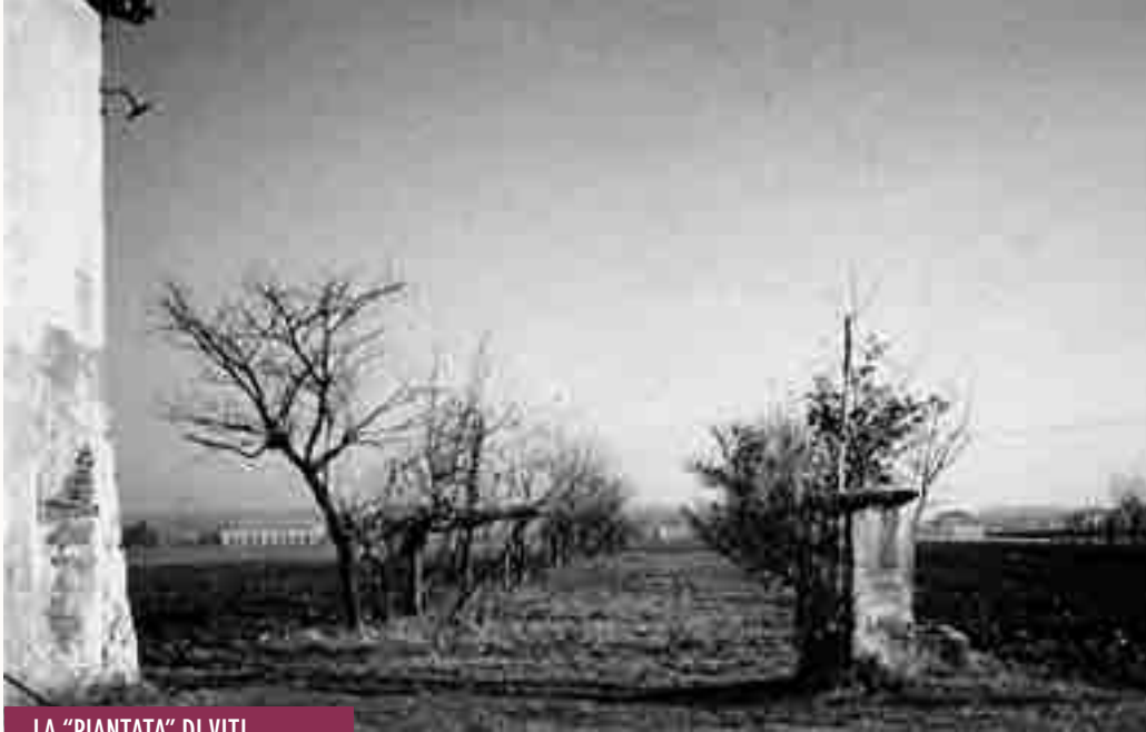
LA "PIANTATA" DI VITI

riparavano le mani e le gambe con guanti e calze di lana anche pesanti, in testa indossavano un fazzoletto annodato dietro la nuca. Le calze spesse, servivano anche per potersi difendere da qualche occhiata degli uomini mentre si trovavano sulle scale per togliere i grappoli in alto. Si doveva prestare attenzione per non graffiarsi con i rami secchi delle piante. Gli abiti usati erano abbastanza pesanti per ripararsi dall'umidità della sera o del mattino presto e anche dalle punture di qualche insetto. Si lavorava con le mani, la bocca era sempre libera per assaporare qualche chicco d'uva e per fare battute scherzose, canti e risate in un clima di allegria. Le donne erano le principali attrici, si scambiavano opinioni, consigli, ricette per questo o quel manicaretto da fare in cucina; non mancavano i pettegolezzi su altre donne o vicende del paese. Le mamme che avevano figli piccoli li portavano con loro e li mettevano a giocare nella corte con i figli dei proprietari. Durante la vendemmia, che poteva durare anche diversi giorni, si notavano i vari mutamenti della campagna con le prime nebbie velate del mattino, il clima più fresco alla sera, un continuo e quotidiano cambio dei colori delle foglie nei filari delle viti e delle piante: giallo, rosso, marrone per poi staccarsi e lasciare i tralci quasi spogli. Quando l'uva era nella corte, si procedeva alla pigiatura con