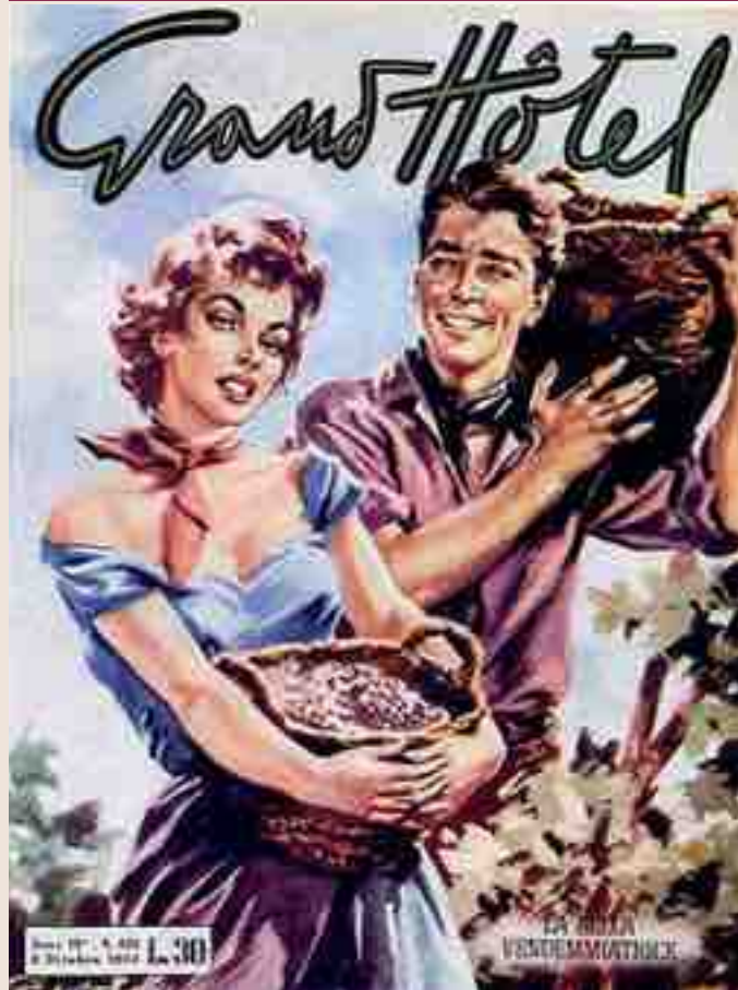
COPERTINA GRAND HOTEL 9/10/1954: LA BELLA VENDEMMIATRICE

ventapasseri o altri espedienti, però, non sempre davano gli effetti desiderati. La vendemmia si faceva tra la seconda quindicina di settembre e la prima di ottobre; non si protraeva oltre per non accavallarsi con altri lavori in campagna come la semina autunnale del grano, dell'avena o dell'orzo. Nel giorno stabilito per la vendemmia, già all'alba i vari componenti della famiglia contadina erano tutti coinvolti, bambini, adulti, anziani, unitamente a parenti e vicini di casa chiamati a dare una mano. Quindi, seguendo le disposizioni del capofamiglia, si cominciava con delicatezza a togliere i grappoli, in un clima di serena allegria, scherzando e conversando. Spesso venivano ingaggiati lavoratori e lavoratrici