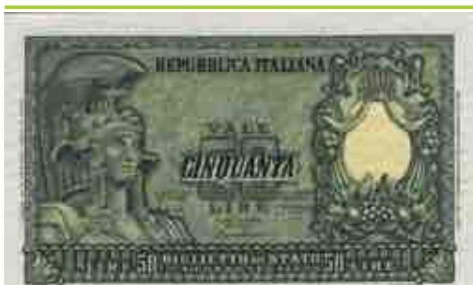
LIRE 50 ITALIA ELMATA

I titoli da lire 5.000 si presentano di colore azzurrino con al diritto a sinistra la testa allegorica dell'agricoltura e a destra la testa d'Italia, mentre al rovescio al centro il valore. Il biglietto misura mm 254x74 quindi di dimensioni apprezzabili. Possiamo contare ben otto emissioni diverse che andiamo qui ad elencare: