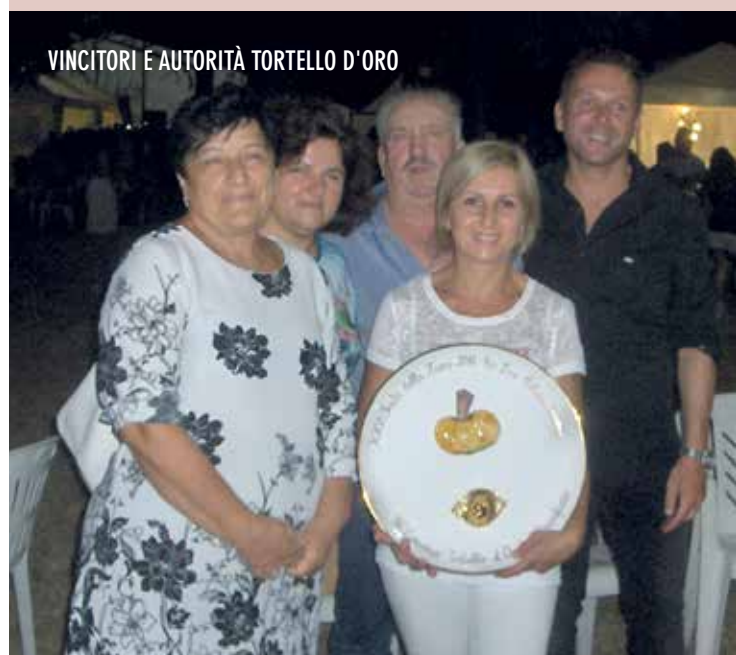
VINCITORI E AUTORITÀ TORTELLO D'ORO