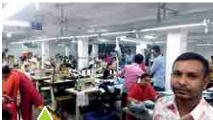
FABBRICA JEANS H&M E VICTORIA SECRETS

◆ E' noto che l'industria dei coloratissimi filati e delle confezioni è molto sviluppata, al punto che imprenditori italiani e stranieri hanno trasferito o iniziato a Dacca attività manifatturiere e commerciali. In fabbriche come questa ci sono "linee" per confezionare i capi dei marchi più diffusi.