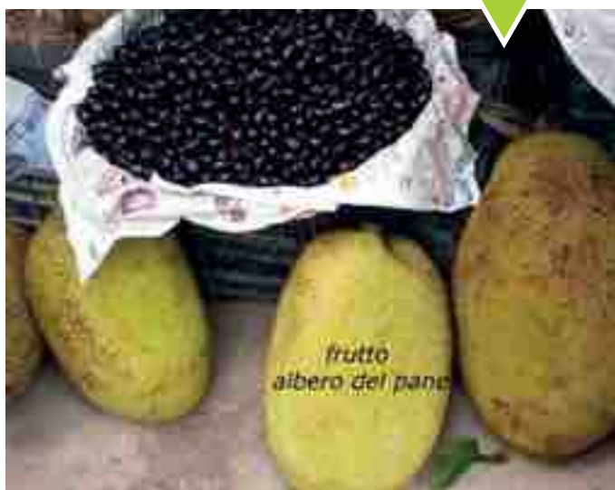
FRUTTO ALBERO DEL PANE

Mi ha sorpreso vedere, per la prima volta, il frutto dell'albero del pane. Nome scientifico Artocarpus. E' di notevoli dimensioni e, una volta cotto, per la consistenza ed il gusto può far pensare al pane.