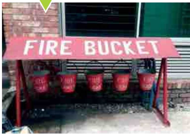
MODERNO SISTEMA ANTINCENDIO