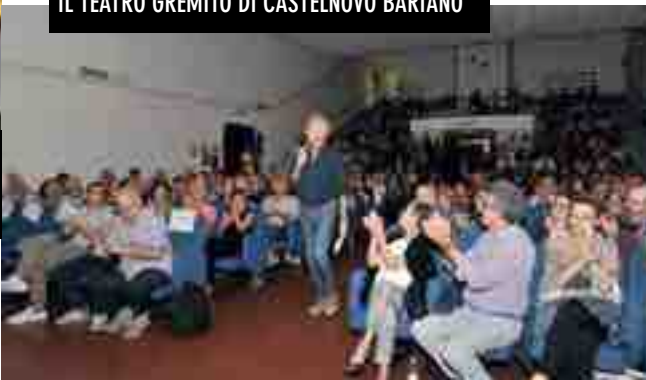
IL TEATRO GREMITO DI CASTELNUOVO BARIANO