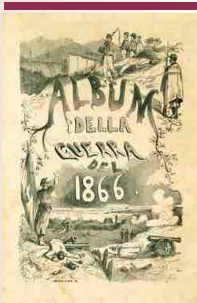
EUGENIO TORELLI-VIOLLIER, Album della guerra del 1866, Milano-Firenze, Sonzogno, 1867 (BCABo, 11.&III.28) GOTTA dis., SARTORI e VAIANI inc., frontespizio silografato

Si concludeva una dei periodi più travagliati di Mantova e provincia le cui sorti, dopo la cam-