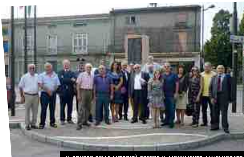
IL GRUPPO DELLE AUTORITÀ PRESSO IL MONUMENTO ALL'EMIGRATO