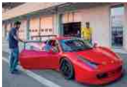
AUTODROMO MODENA 13 SETTEMBRE 2016