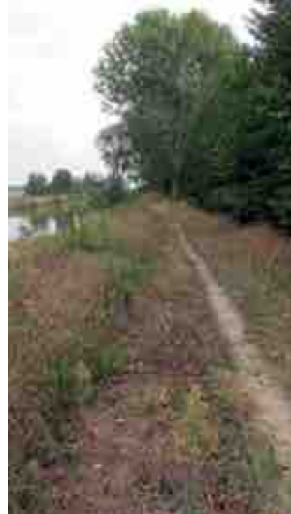
LA FOTO EVIDENZIA LO STATO ATTUALE DELLA CICLOVIA

100 arboree, tipiche della vegetazione ripariale padana. La ciclovia è molto interessante proprio per il suo tracciato tra le bonifiche tuttavia, come sopra indicato, sarebbe da ripristinare (soprattutto considerando che si tratta di un anello integrativo del progetto europeo Eurovelo, di cui parleremo in altra occasione). Il tragitto, di non facile percorrenza in bicicletta già in origine, a causa dell'acciottolato del fondo, risulta infatti at-