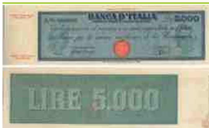
TITOLO PROVVISORIO DA LIRE 5.000

Per evitare di stancare ed annoiare i nostri lettori rimandiamo ad un'altra puntata la continuazione del nostro racconto.