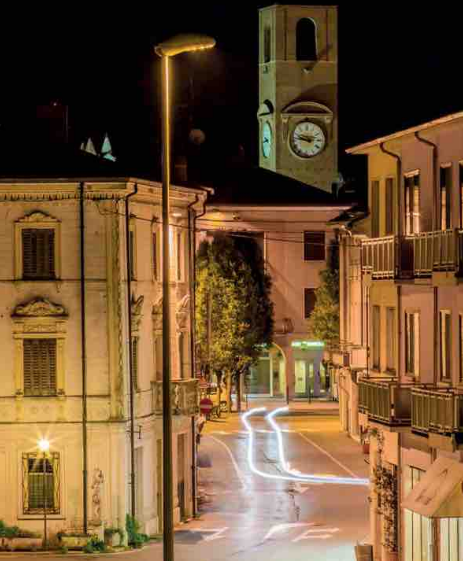
21:47 è l'orario in cui ha scattato questa foto Luca Mantovani: "Mi è piaciuto il punto di ripresa, una vista insolita dove il nostro campanile la fa come sempre da padrone".