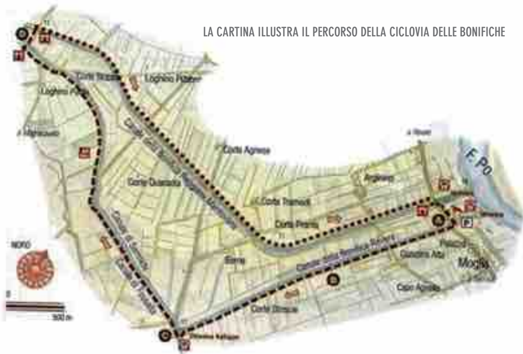
LA CARTINA ILLUSTRA IL PERCORSO DELLA CICLOVIA DELLE BONIFICHE

tualmente praticabile perlopiù a piedi e inselvatichito in molti punti.