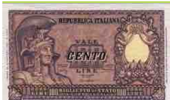
LIRE 100 LIRE 100 ITALIA ELMATA