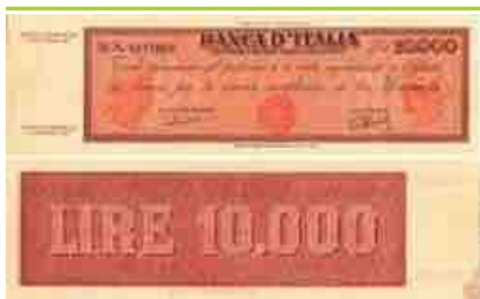
TITOLO PROVVISORIO DA LIRE 10.000