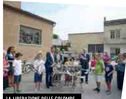
LA LIBERAZIONE DELLE COLOMBE

quadro delle manifestazioni, mentre nella sua predica Don Gianfranco ha rilevato la necessità di costruire ponti di relazioni umane per l'equilibrio di un sistema mondiale di vita. All'uscita dalla chiesa, nel sagrato dedicato alla santa Francesca Saverio Cabrini, protettrice degli emigrati, i fedeli hanno potuto assistere allo spettacolo della liberazione dalle stie di uno stormo di colombe, denso di effetto e di significato, curato dall'Associazione 'Ala Santangiolina' di Sant'Angelo Lodigiano, che è stato salutato con una salva di applausi. Il corteo si è avviato