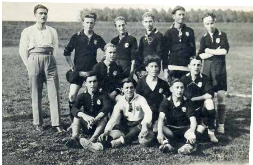
NELLA FOTO: 8 GIUGNO 1925 – LA FORMAZIONE SERMIDESE