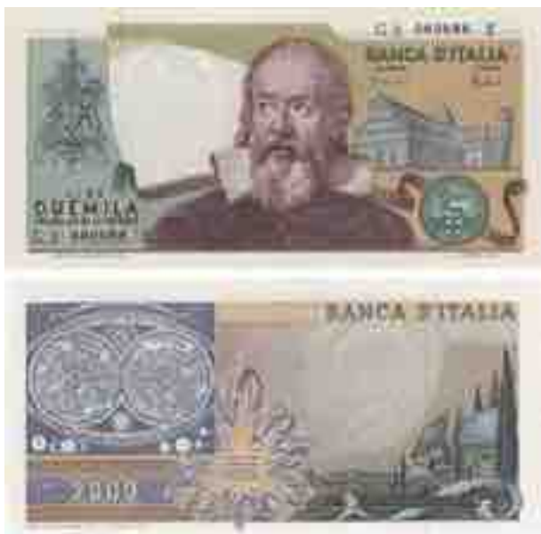
LIRE 2000 GALILEI

Le misure del biglietto sono di mm 160x79. Come detto in precedenza questi tagli di banconote non hanno riscosso da parte della popolazione un grande apprezzamento forse per la scomodità del loro uso nei piccoli pagamenti giornalieri. Invece, soprattutto il 20.000, è molto apprezzato dai collezionisti perché fa tematica. Questo che cosa significa? Ci sono due tipi di collezionisti: quelli che raccolgono tutte le date di emissioni delle banconote e quelli che si limitano a mettere da parte una banconota per tipo. Questi ultimi sono costretti ad acquistare prima o poi il 20.000 perché esiste solo con quella data di emissione e solamente di quel tipo o tematica.