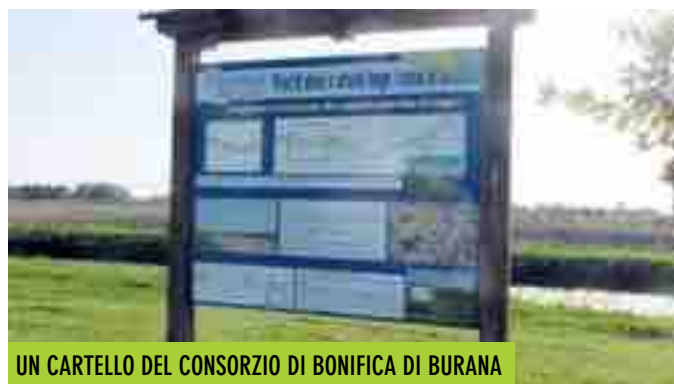
UN CARTELLO DEL CONSORZIO DI BONIFICA DI BURANA CHE ILLUSTRRA LA RETE ECOLOGICA DEI FILARI

cace azione frangivento a protezione delle colture agricole e favoriscono l'abbattimento di CO2 attraverso i processi fotosintetici delle piante. Anche la qualità dell'acqua riceve un miglioramento in quanto le piante