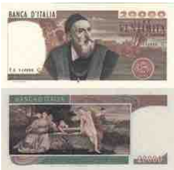
LIRE 2000 TIZIANO