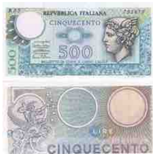
LIRE 500 MERCURIO