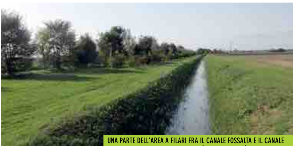
UNA PARTE DELL'AREA A FILARI FRA IL CANALE FOSSALTA E IL CANALE DI SCOLO DI FELONICA, IN PROSSIMITÀ DELLA LOCALITÀ BASTIONE

Concludiamo con questa pagina la rubrica Turismo a Km 0 dedicata ai canali di bonifica. Appuntamento a primavera con una sezione riguardante il progetto Eurovelo e le Ciclovie del Po.