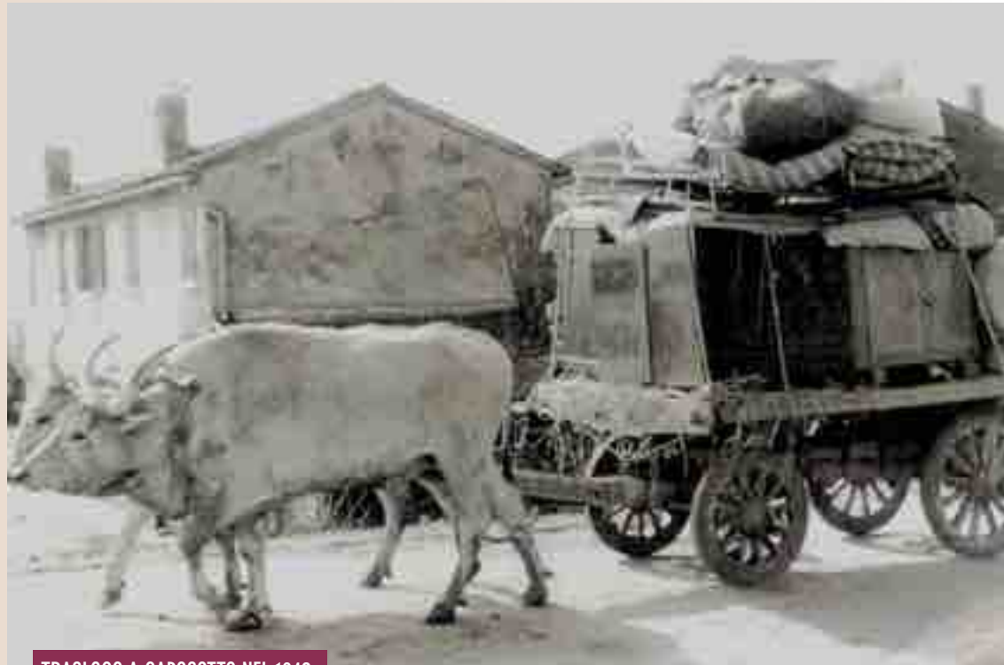
TRASLOCO A CAPOSOTTO NEL 1942

◆ Nel giorno di San Martino, l'undici di Novembre, giorno in cui, secondo la leggenda, dovrebbe splendere il sole per "l'estate di San Martino", ma che spesso è nebbioso e freddo, quando non è piovoso, fino alla fine degli anni '50 era consuetudine fare i traslochi. Era facile vedere lungo le strade ghiaiate carretti, carri e "caratèli" (carri agricoli per il trasporto di fieno e covoni con le ruote anteriori sterzanti) trainati da buoi o cavalli, carichi di masserizie della famiglia contadina che doveva abbandonare il podere alla scadenza del contratto di affitto o di mezzadria. Il trasloco da una cascina ad un'altra poteva avvenire per decisione volontaria, quindi per scelta del salariato di andare alle dipendenze di un altro padrone, oppure forzoso, quando subentravano cause di incompatibilità tra il datore di lavoro e il salariato. In questo caso era un grosso problema, specialmente quando il posto dove poter andare non era subito disponibile. Gli sfratti forzosi venivano sempre ordinati dal giudice ed eseguiti quasi sempre sotto il suo diretto controllo in fredde giornate, magari piovose, senza tener conto che nella famiglia dello sfrattato vi erano vecchi e spesso tanti bambini. Alla "legge" questo non interessava,