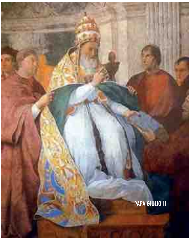
PAPA GIULIO II

inteso che molto turbata è stata la Ex. S. dolendosi di me con parole ingiuriosissime per esser venuto a far fare el ponte". 10 Vigo si diceva anche odiato "da quelli che desiderava che avesti a stare im pregione senpre et che aveva fato una lega che non era molto al preposito vostro, et son certo che non sapeti el tercio di quello ocorse a quei tempi". 11 Mentre Isabella boicottava la costruzione del ponte 12 , Giulio II incalzava Francesco Gonzaga a non tener il piede in due scarpe e adempiere all'incarico per il quale era stato liberato. 13 Il Gonzaga si scusò, dando la colpa al malfrancese che lo teneva inchiodato al letto. 14