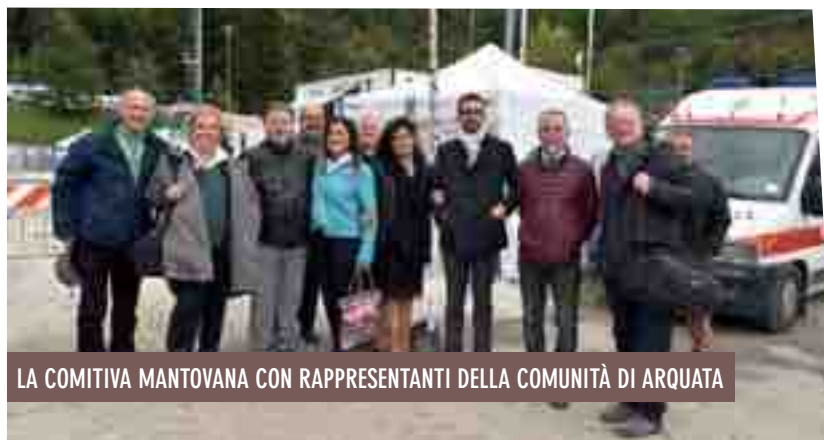
LA COMITIVA MANTOVANA CON RAPPRESENTANTI DELLA COMUNITÀ DI ARQUATA

VIAGGIO DI UN SOCCORSO UMANITARIO AD ARQUATA