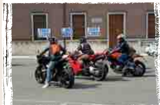
In occasione del Motoraduno 2016 manifesti di saluto per i tre amici motociclisti deceduti nello scorso agosto