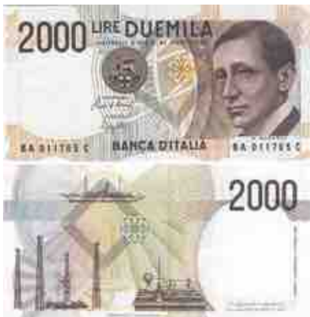
LIRE 2000 MARCONI

◆ Ricollegandoci all'articolo precedente e restando sempre nell'ambito dei biglietti di Stato sono da considerare le famose 500 lire di carta. Emesse in due tipologie diverse che qui di seguito elenchiamo: