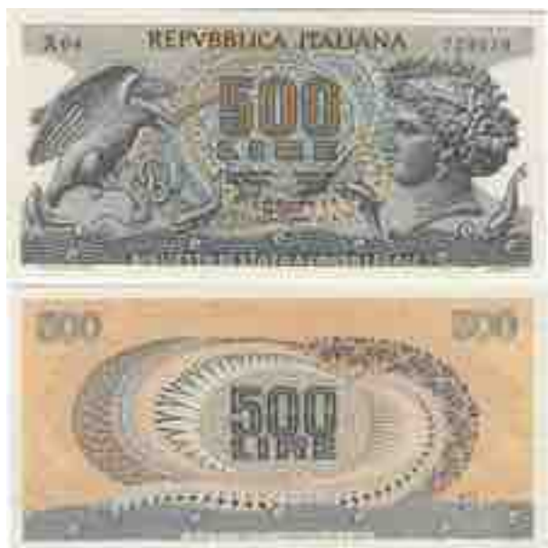
LIRE 500 MEDUSA