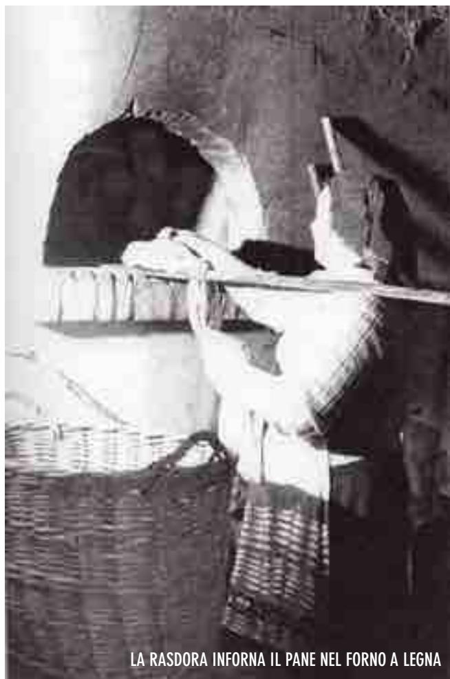
LA RASDORA INFORNA IL PANE NEL FORNO A LEGNA