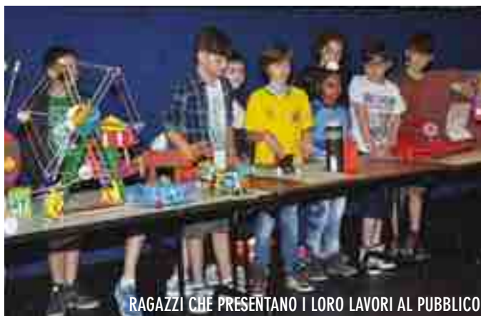
RAGAZZI CHE PRESENTANO I LORO LAVORI AL PUBBLICO