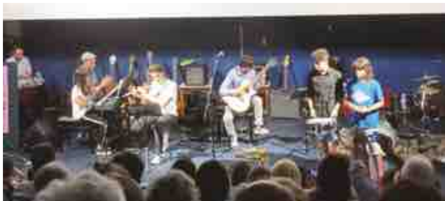
MOMENTI DEL CONCERTO MONTEVERDI DI FINE ANNO

F olto pubblico, lo scorso 6 giugno, alla multisala Capitol, come avviene di solito per il Concerto di fine anno della scuola. Quest'anno sono stati impegnati in particolare i "combo" cioè i gruppi di alunni che hanno fatto sperimentazione e pratica di musica d'insieme. Effervescenti i giovani della Monteband e del Lab 105, ospite della serata; colto e raffinato il gruppo corale adulti.