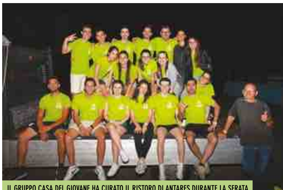
IL GRUPPO CASA DEL GIOVANE HA CURATO IL RISTORO DI ANTARES DURANTE LA SERATA