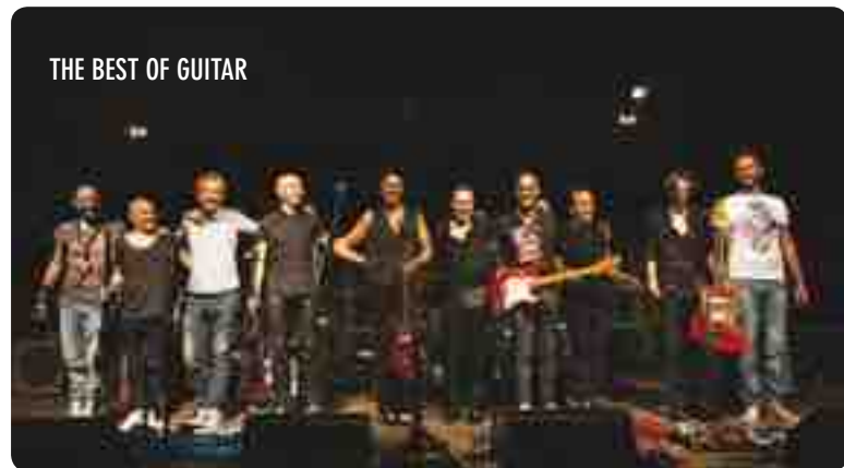
THE BEST OF GUITAR