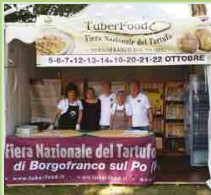
TUBERFOOD - FIERA NAZIONALE DEL TARTUFO BIANCO DI BORGOFRANCO SUL LUNGO LAGO GONZAGA, ALLA MANIFESTAZIONE ANTICHI MANGIARI APPREZZATE LE SPECIALITÀ AL TARTUFO DI STAGIONE

corsi specifici per chi intende migliorare la propria condizione psico-fisica. E' poi utile in ambito clinico, educativo-scolastico, aziendale e sportivo. La relatrice ha poi trattato ampiamente di ansia e stress, le negative conseguenze sulla salute e le metodologie per affrontarle. Infine ha parlato di due corsi uno, per adulti, alla palestra New Fit di Ostiglia, l'altro per bambini dai 6 ai 10 anni, presso l'ambulatorio medico di Carbonara di Po.