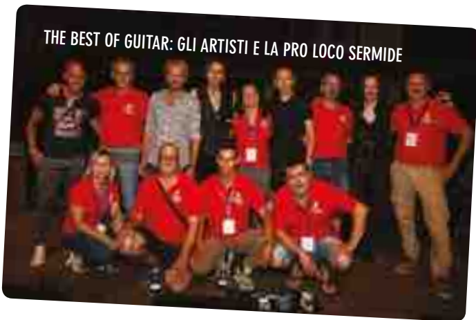
THE BEST OF GUITAR: GLI ARTISTI E LA PRO LOCO SERMIDE