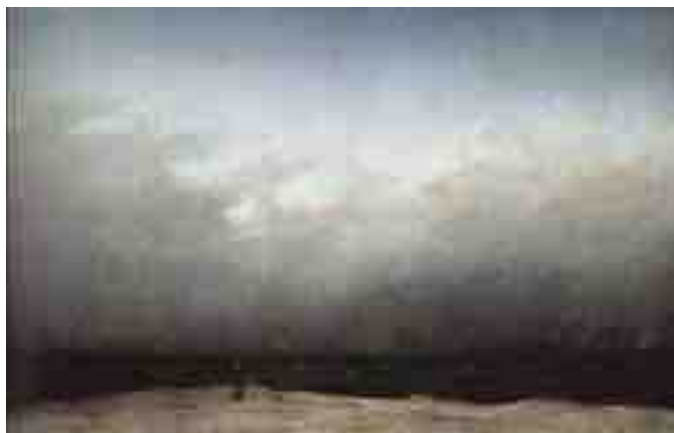
MONACO IN RIVA AL MARE - 1810 - OLIO SU TELA 110 X 171,5 CM ALTE NATIONALGALERIE-STAATLICHE MUSEEN-BERLINO

E in questo modo, esprimendo la "spettacolarità della natura" intesa come "opera divina" di