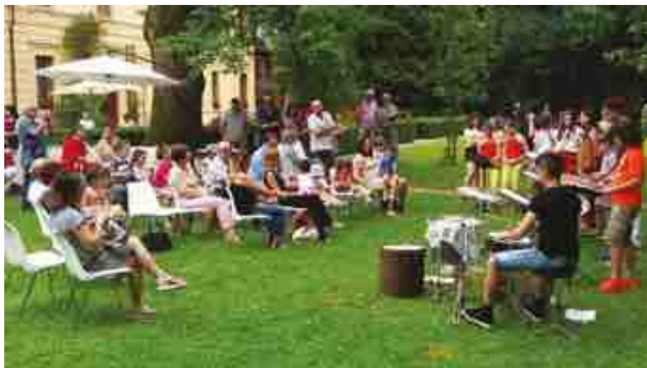
IL GIARDINO IN FIABA MONTEVERDI NELLA CORNICE DI VILLA CASTELLANI