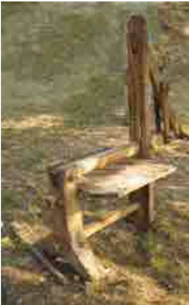
LA GRAMULA ATTREZZO USATO PER RENDERE COMPATTO ED OMOGENEO L'IMPASTO DEL IL PANE.

lievitare tutta la notte. Sull'impasto tracciava una croce con le dita. In casa, già al mattino presto si sentiva l'inconfondibile e delicato profumo del pane in lievitazione. Tutti si alzavano di buon'ora per lavorare l'impasto ed ottenere le varie forme di pane fresco. La rasdora prendeva l'impasto dall'impastatrice, lo lavorava un po' a mano prima di passarlo sotto la "gramula", uno strumento che veniva di solito azionato da un uomo per il consistente sforzo fisico che richiedeva. La donna provvedeva a rivoltarlo più volte sotto l'asta della gramola fino ad ottenere un impasto compatto ed omogeneo, che lasciava a lievitare ancora un po'; poi lo si tagliava in tanti pezzetti per ri-