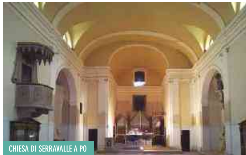
CHIESA DI SERRAVALLE A PO

Tutti ben motivati per una impresa che saprà affrontare e vincere le prossime sfide.