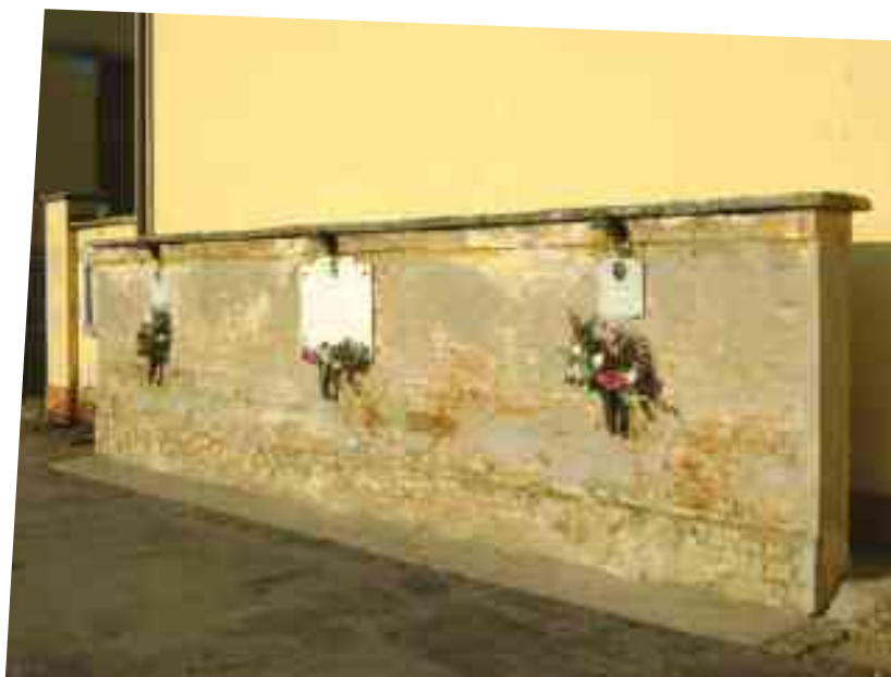
LE TRE LAPIDI IN MARMO CON ELEMENTI IN RILIEVO AFFISSE SU UNA PORZIONE DELL'ORIGINARIO MURO DI RECINZIONE DEL CIMITERO DI SAN MARTINO SPINO

"Chiudere i conti con la storia non è facile, soprattutto perché certi fatti ti restano appiccicati addosso anche se non li hai vissuti sulla propria pelle. Eppure lo senti che ti riguardano. Basta osservare quello che sta accadendo al nostro paese, di nuovo alle prese con