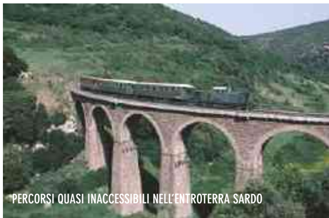
PERCORSI QUASI INACCESSIBILI NELL'ENTROTERRA SARDO

◆ Molti di voi conosceranno già questo treno e il magnifico itinerario di una delle linee ferroviarie più suggestive al mondo, tutelata dall'Unesco come Patrimonio dell'Umanità. Il fa-