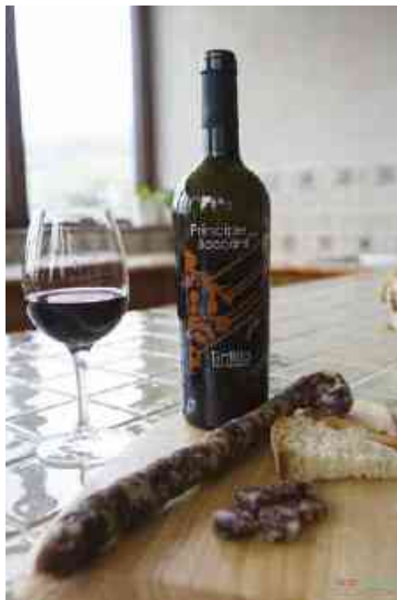
TINTILIA, PRINCIPE DELLE BACCANTI

botticelle trasportate da un mulo, spicca il rosso "banded". Le reminiscenze dell'origine, nel misterioso calembour di sapori, si uniscono con la recente scoperta di alcuni resti dell'antica città di Aquilonia, uno scenario da musicare con The Great Gig in the Sky , dei Pink Floyd o magari con Carlo Martello torna dalla battaglia di Poitiers , di De André.