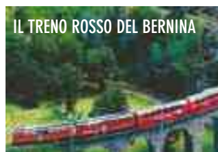
IL TRENO ROSSO DEL BERNINA