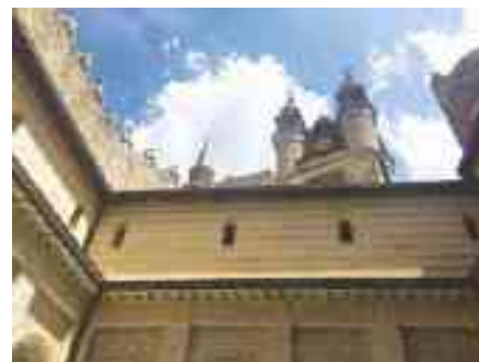
UNO SCORCIO DI ROCCHETTA MATTEI

degli ammalati. Scesi dal pullman i gitanti s'inerpicano su di un'erta per raggiungere la rocca, ultimo tratto una scalinata che introduce al castello dove appare ai suoi piedi la statua di un paio di leoni simboli di forza. All'interno la visita al laboratorio segreto che nelle intenzioni del conte Mattei aveva lo scopo di disorientare i sensi, tutto quanto un messaggio criptico ed esoterico che stupisce, specialmente la Sala cosiddetta della Pace fatta costruire nel 1821 e l'ambulatorio dell'illustre