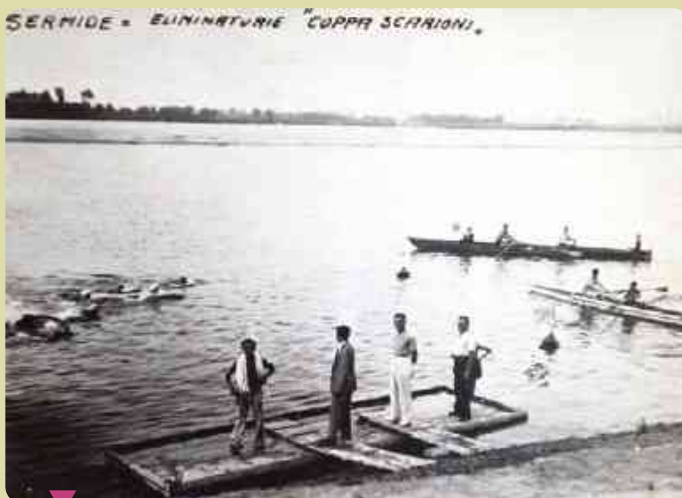
1932 – ELIMINATORIA COPPA SCARIONI