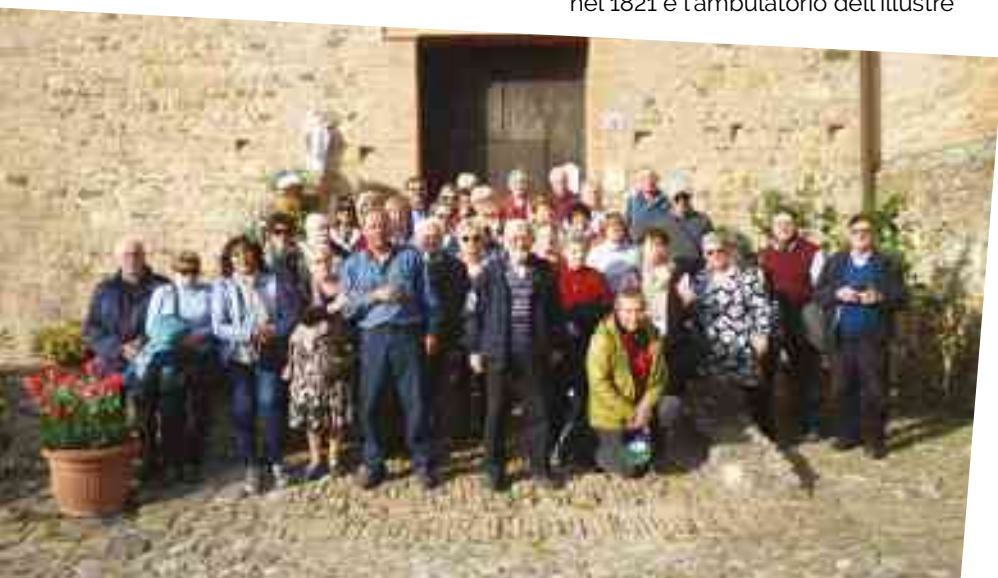
LA COMITIVA PRESSO L'ABBAZIA DI MONTEVEGLIO

del conte. Altra sala capolavoro d'arte quella della 'Pax' intarsiata in legno alle pareti e con uno stanzino che conserva l'immagine del conte Mattei. Terminata la visita, tutti al ristorante 'CA' VECCHIA' dove consumiamo un pranzo in felice compagnia. Nel pomeriggio l'escursione al Convento dell'Abbazia di Monteveglio: una camminata su per un'erta per giungere all'imponente chiesa e addentrarci all'interno dell'Abbazia dove ci accoglie il tipico chiostro con la fontanella centrale in marmo attornata dalle statue di altri simbolici leoni. All'esterno su di una parete delle mura l'epigrafe in marmo che avverte: "Si cor non orat invanum lingua laborat" (Se il cuore non partecipa inutilmente si prega) che invita al raccoglimento spirituale. Non rimane che discendere dal monte tra il parco che si estende tra limpidi torrenti e le colline che si alzano dietro il moderno abitato di Monteveglio per raggiungere il pullman che ci riporta a casa al tramonto ponendo termine alla piacevole conoscenza di luoghi storici interessanti.