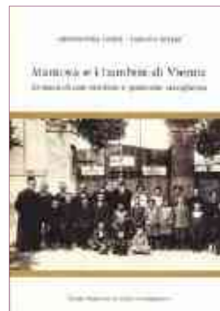
la manifestazione di domenica [...].