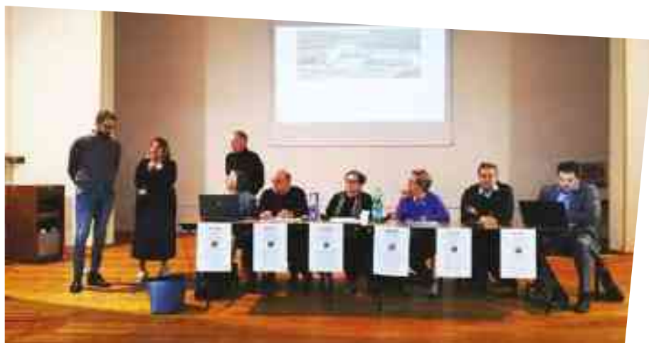
I COMPONENTI DEL COMITATO

"Siamo pazienti di serie B, e stiamo per perdere la pazienza. Da dieci anni registriamo riduzione del personale, dei posti letto, dei finanziamenti, delle attrezzature, e abbiamo pronto soccorso al minimo delle forze. Tutto questo, a fronte di professionalità importanti, di alto livello, che si trovano costrette a lavorare in condizioni