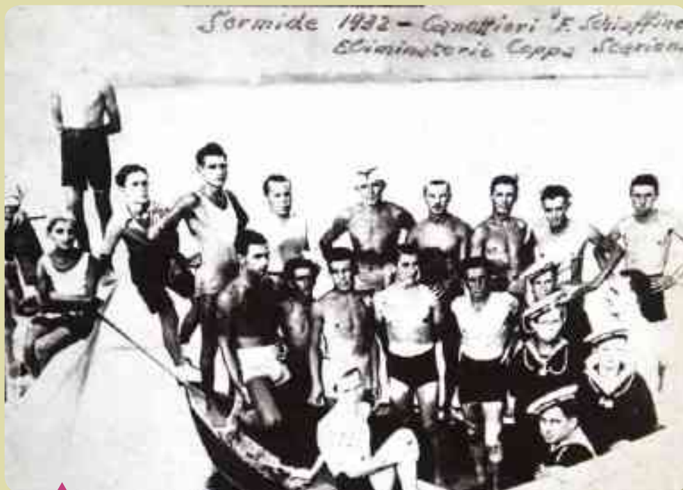
1932 – ELIMINATORIA COPPA SCARIONI