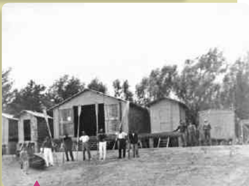
1935 – CAPANNI PER RICOVERO BARCHE E ATTREZZATURE