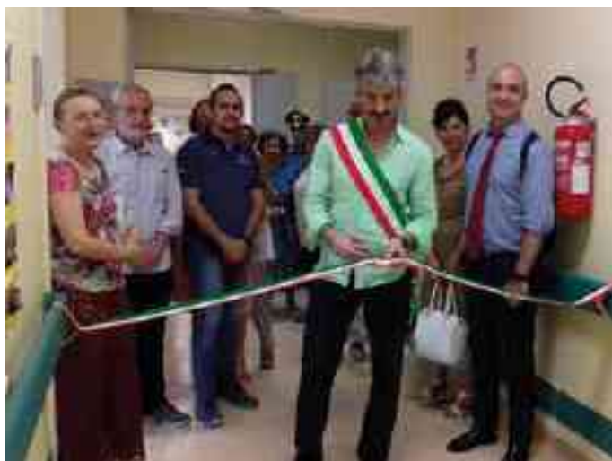
INAUGURAZIONE PALESTRA CASA SOLARIS

N elle giornate di Venerdì 21 e 28 Giugno 2019 la Fondazione SaluteVita ha ufficialmente dato il via al progetto di riabilitazione per esterni con l'inaugurazione delle palestre di Casa Canossa a Serravalle a Po e Casa Solaris a Sermide e Felonica.