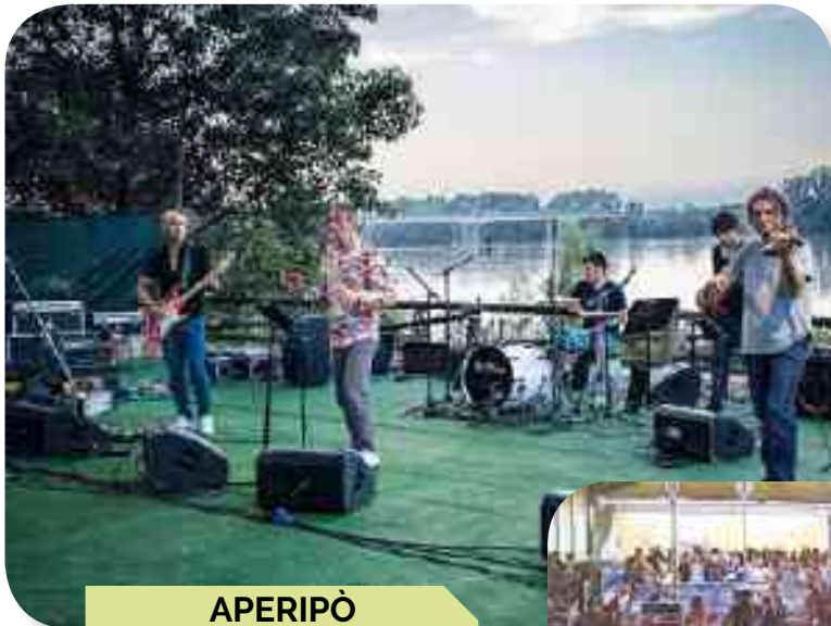
APERIPÒ ALLA NAUTICA