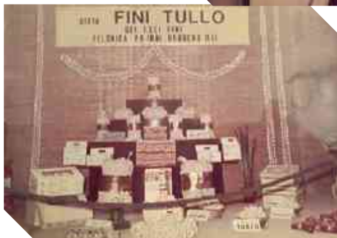
Stand Fini alla fiera di Colonia ANUGA 1991

una grave malattia che lo porterà alla morte nel 1990 all'età di 50 anni. La sua mancanza, accompagnata da un mercato in profonda trasformazione che vede arrivare anche i discount nel 1993, porta i due fratelli rimasti alla decisione di chiudere l'azienda nel 1995.