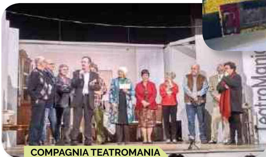
COMPAGNIA TEATROMANIA PIAZZETTA GONZAGA