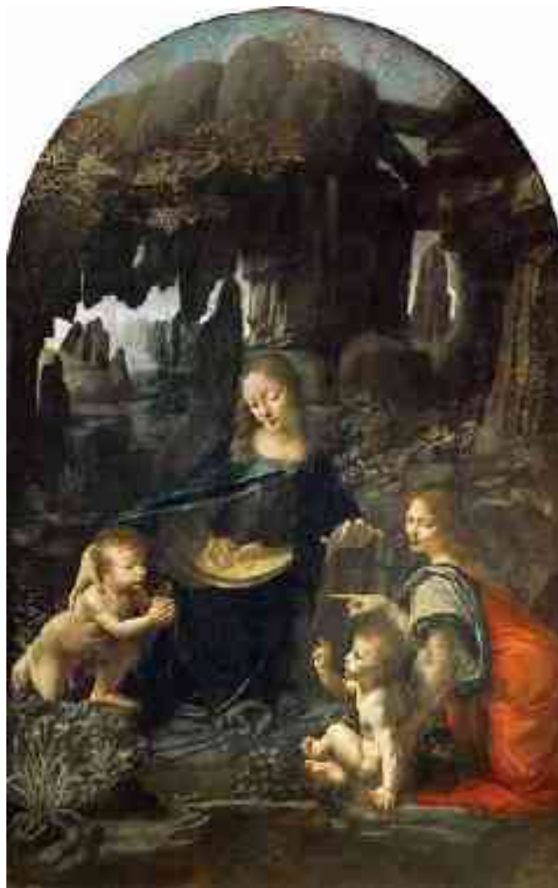
VERGINE DELLE ROCCE, 1483-1486 - MUSEO DEL LOUVRE, PARIGI

Ovviamente da non perdere l'Ultima Cena: il dipinto, Patri-