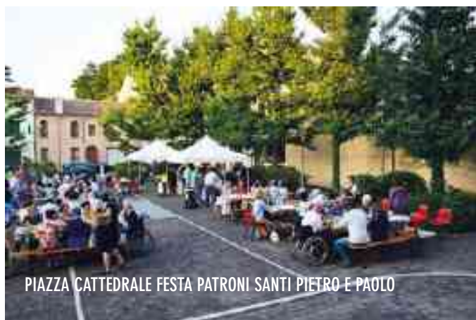
PIAZZA CATTEDRALE FESTA PATRONI SANTI PIETRO E PAOLO

E sabato, dopo la celebrazione della messa, il sagrato è stato animato da un momento particolarmente vivace di vita comunitaria: spazio per un insolito apericena con prodotti tipici del territorio, ambiente di valore in cui ritrovarsi per rinsaldare il dono della comunità. La serata si è conclusa alle 21 con un evento musicale: il concerto, del gruppo vocale BEQUADRO di Verona. Il gruppo, composto da cantori che provengono da diverse esperienze musicali e corali alle quali hanno scelto di affiancare anche l'esperienza vocale, ha proposto un repertorio di canti dal 1500 ai giorni nostri.