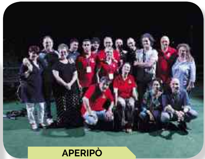
APERIPÒ IL GRUPPO PRO LOCO