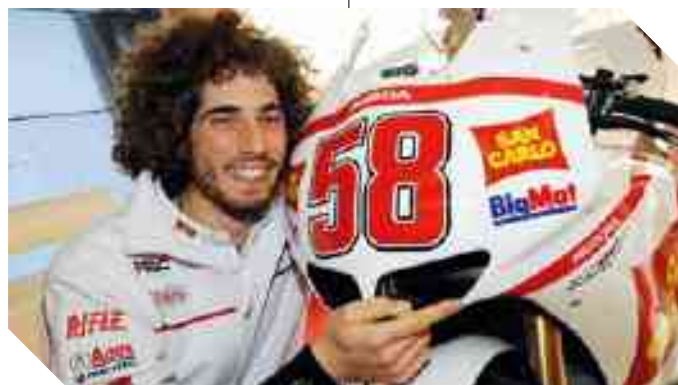
58 DI MARCO SIMONCELLI

dere che questi sono segnali, e sono tanti, non sempre evidenti. Convinto che Marco veramente c'è, e mi chiama dicendomi: allora babbo ma proprio non capisci niente; mi piacerebbe tanto abbracciarlo. (n.r. nel 2004, a Jerez, Marco vinse il primo GP in 125).