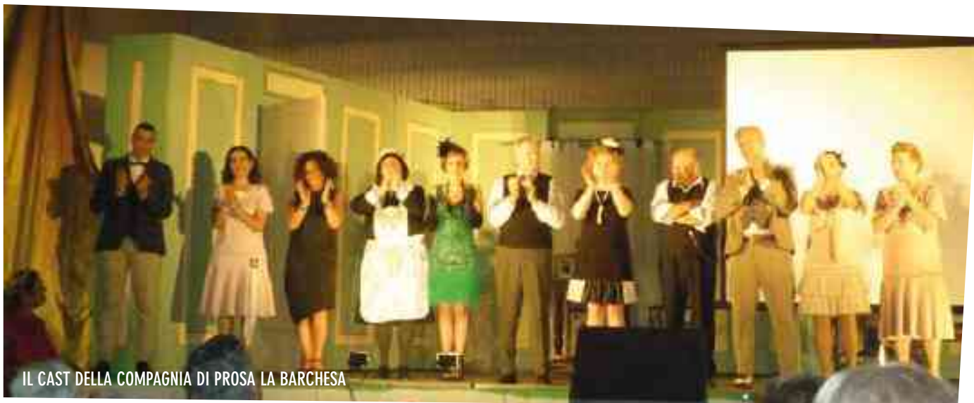
IL CAST DELLA COMPAGNIA DI PROSA LA BARCHESA

P er la tradizionale Fiera di Giugno il Circolo Ricreativo locale ha proposto alla cittadinanza un paio di interessanti e divertenti spettacoli presso il Teatro Polivalente S. Pertini: danze e commedia dialettale le regine incoronate. Le manifestazioni festive si sono aperte venerdì sera