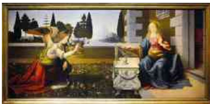
ANNUNCIAZIONE, 1472-1475 - GALLERIA DEGLI UFFIZI, FIRENZE

pane focacceria tiròt dolci salumi formaggi vini