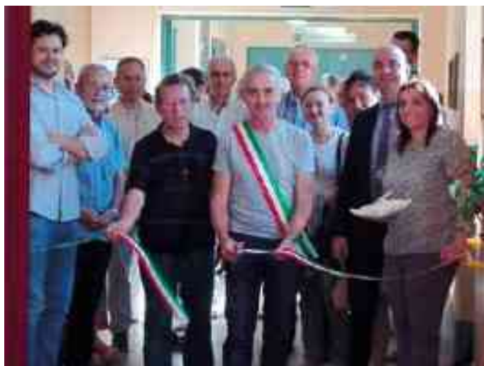
INAUGURAZIONE PALESTRA CASA CANOSSA