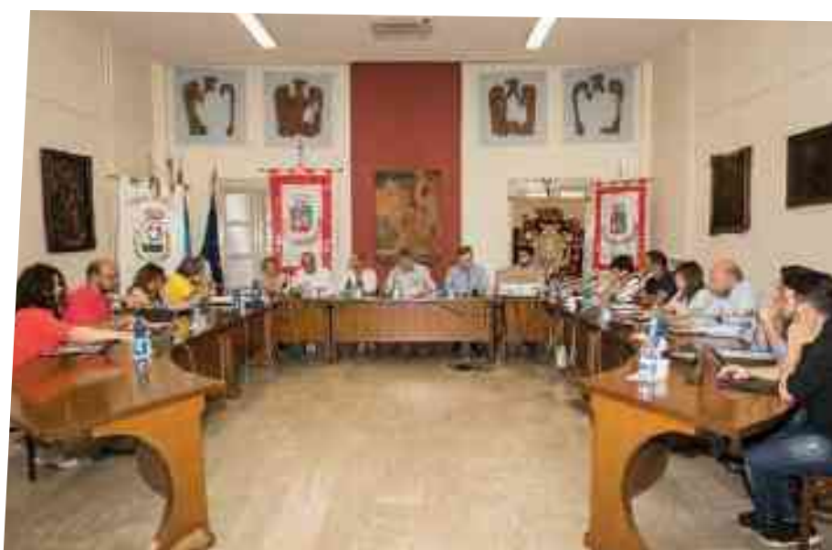
CONSIGLIO COMUNALE DEL 13 GIUGNO 2019

consigliere , politiche giovanili, consiglio dei ragazzi