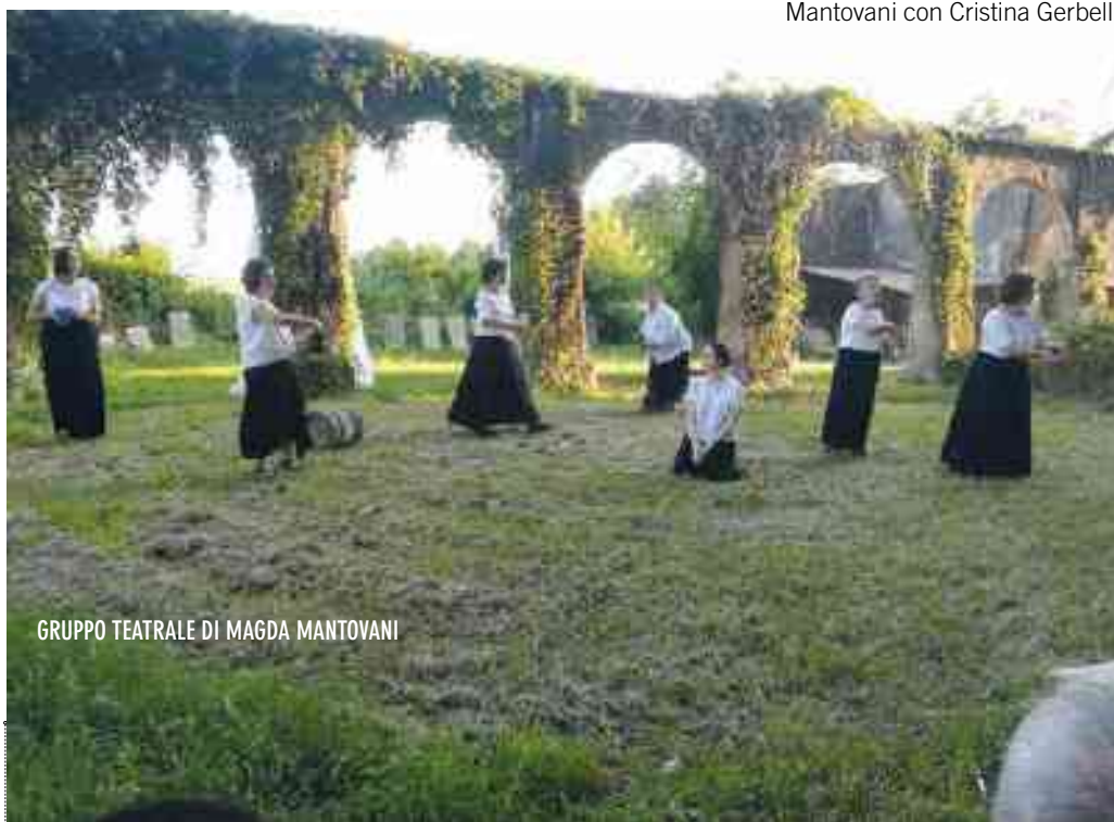
GRUPPO TEATRALE DI MAGDA MANTOVANI