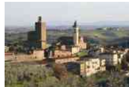
VEDUTA DI VINCI

Per chi non può partire ma nemmeno vuol perdere la commemorazione del "genio" segnaliamo gli itinerari scaricabili dal sito www.latoscanadileonardo.it .