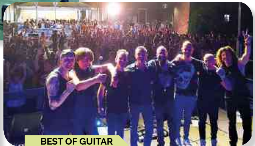
BEST OF GUITAR PIAZZA RISORGIMENTO