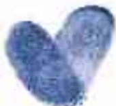
IMMAGINE AZIENDALE | PROGETTI EDITORIALI MARKETING CREATIVO | PUBBLICITÀ