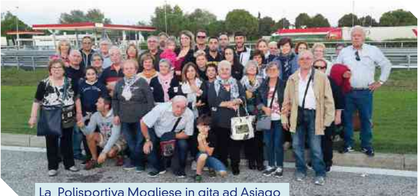
La Polisportiva Mogliese in gita ad Asiago