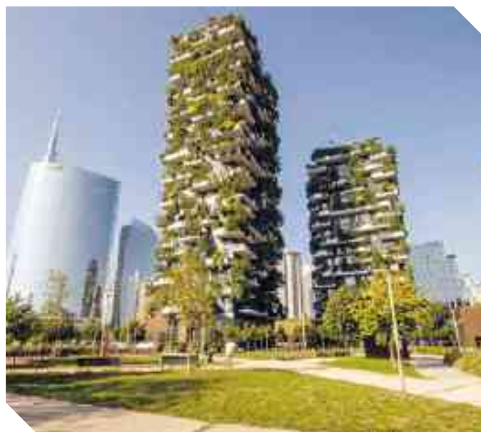
IL FAMOSO "BOSCO VERTICALE" DI STEFANO BOERI: "DA FENOMENO A PROTOTIPO". SONO DUE EDIFICI RESIDENZIALI A TORRE, COMPLETATI NEL 2014 A MILANO-PORTA NUOVA: UN PROGETTO PILOTA PER UNA NUOVA GENERAZIONE DI EDIFICI ECOSOSTENIBILI

◆ All'interno del summit sul clima dell'Onu, tenuto lo scorso settembre a New York, tra le azioni proposte c'è quella di realizzare una "grande Muraglia verde" che moltiplichi i boschi all'interno e all'esterno delle città, presentata dall'architetto italiano Stefano Boeri, esperto di forestazione urbana e noto per il "bosco verticale" milanese. Il programma richiama il nome e la prospettiva del "Great Green Wall", il grande progetto coordinato dall'Unione Africana che sta realizzando un sistema forestale e agricolo lungo 8.000 km e largo 15 km che dal Senegal all'Etiopia mira a bloccare