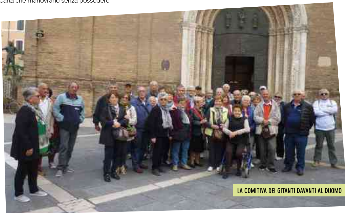
LA COMITIVA DEI GITANTI DAVANTI AL DUOMO

arredi che nella dotazione libraria, inserita a tal uopo dall'UNESCO nel Registro della Memoria del Mondo: al suo interno è conservata una moltitudine impressionante di volumi antichi. Quindi arrivo a Torre Pedrera per consumare una pantagruelica abbuffata di pesce presso il ristorante "Il Gabbiano" a poca distanza dalla riva del mare, dove già si scorgono impennate di flutti che irrompono contro una barriera di scogli. Attesa dell'arrivo della corriera sul lungomare, quindi tutti a risalire sull'automezzo per un tranquillo ritorno a casa che avviene in serata.