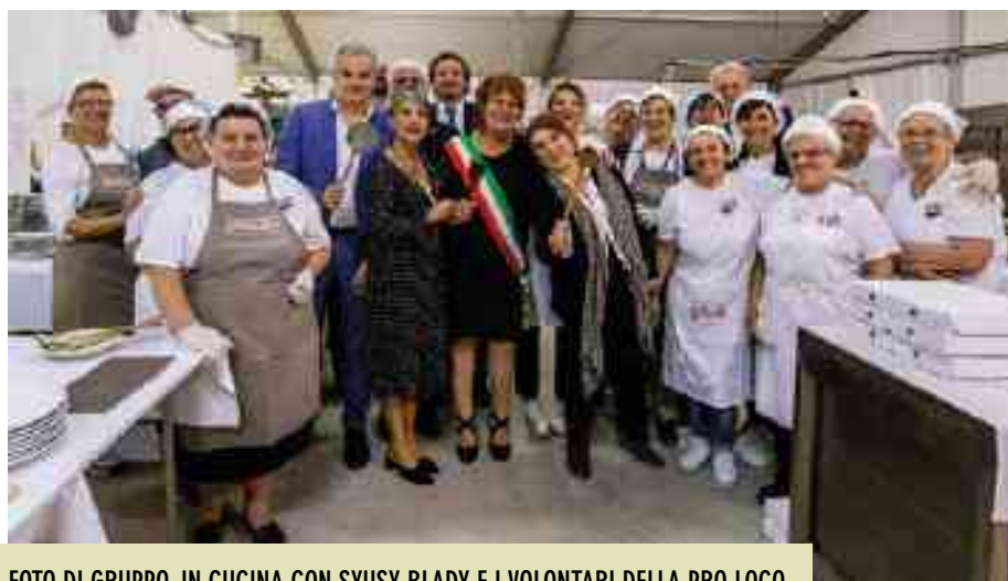
FOTO DI GRUPPO, IN CUCINA CON SYUSY BLADY E I VOLONTARI DELLA PRO LOCO