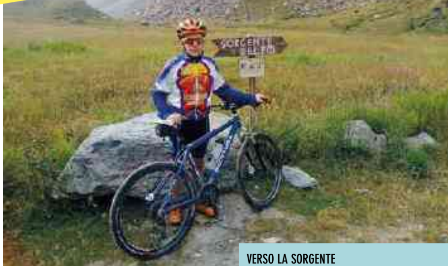
VERSO LA SORGENTE