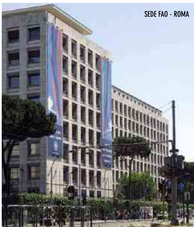
SEDE FAO - ROMA

che oggi interessa oltre un terzo della produzione mondiale di cibo. La ricerca del cibo è sempre stato un grande problema per l'uomo da quando è comparso sulla terra circa quattro milioni di anni fa, ma per quasi 4 milioni di anni si è arrangiato come cacciatore raccoglitore di quello che trovava spostandosi continuamente in piccolissime comunità. Si stima che durante tutto questo lunghissimo periodo la popolazione della terra non raggiungesse il numero di cinque milioni di individui. Poi dopo l'ultima glaciazione, conclusasi 12/13 mila anni fa, dopo un periodo di riscaldamento sensibile, l'uomo abbia iniziato ad addomesticare piante ed animali nella zona chiamata della "mezza luna", che va dalla Palestina alla Siria fino al nord dell'Irak a parte della attuale Turchia (Anatolia). Quindi, con la nascita dell'agricoltura, abbiamo assistito ad una vera e propria esplosione demografica, ad un cambiamento nello stile di vita che da nomade è diventato sempre più stanziale.