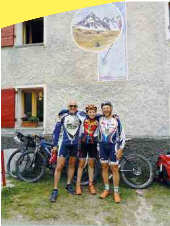
ARRIVO AL RIFUGIO PIAN DEL RE

▶ favoriti dalla totale assenza di "inquinamento luminoso", avremmo sicuramente goduto di uno spettacolo naturale unico.