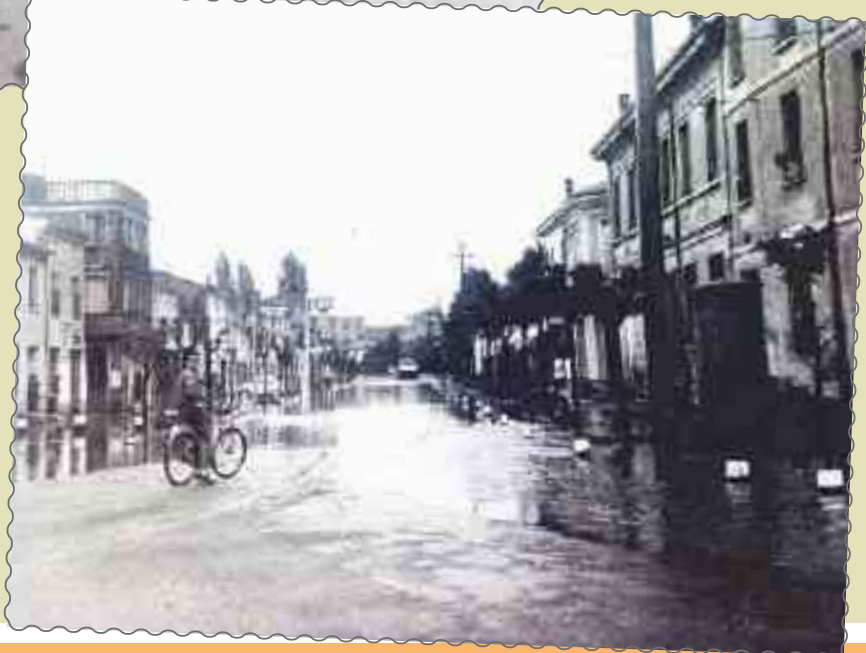
1961 RINO MALAVASI AFFRONTA IMPERTURBABILE LA "FOSSA" ALLAGATA DAL TEMPORALE