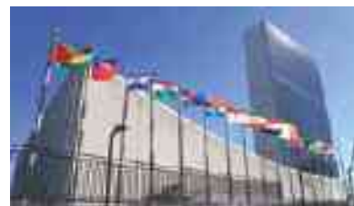
SEDE ONU - NEW YORK

che oggi interessa oltre un terzo della produzione mondiale di cibo. La ricerca del cibo è sempre stato un grande problema per l'uomo da quando è comparso sulla terra circa quattro milioni di anni fa, ma per quasi 4 milioni di anni si è arrangiato come cacciatore raccoglitore di quello che trovava spostandosi continuamente in piccolissime comunità. Si stima che durante tutto questo lunghissimo periodo la popolazione della terra non raggiungesse il numero di cinque milioni di individui. Poi dopo l'ultima glaciazione, conclusasi 12/13 mila anni fa, dopo un periodo di riscaldamento sensibile, l'uomo abbia iniziato ad addomesticare piante ed animali nella zona chiamata della "mezza luna", che va dalla Palestina alla Siria fino al nord dell'Irak a parte della attuale Turchia (Anatolia). Quindi, con la nascita dell'agricoltura, abbiamo assistito ad una vera e propria esplosione demografica, ad un cambiamento nello stile di vita che da nomade è diventato sempre più stanziale.