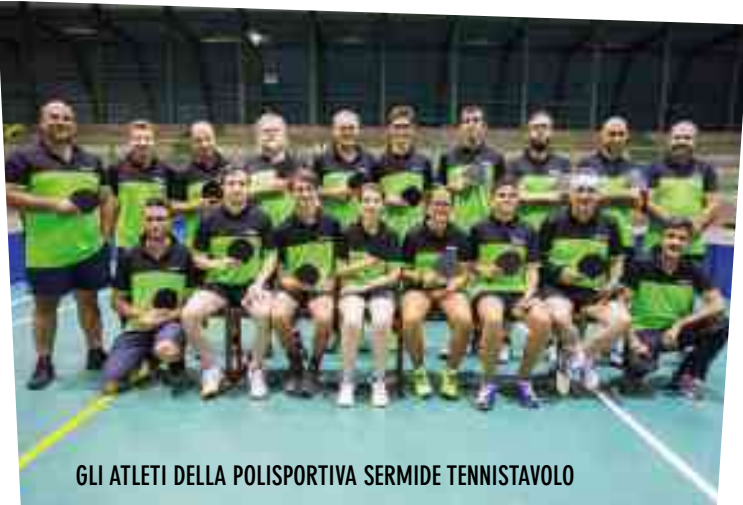
GLI ATLETI DELLA POLISPORTIVA SERMIDE TENNISTAVOLO