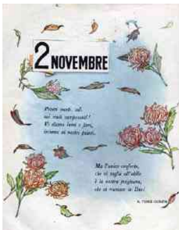
UN DISEGNO CON POESIA DEL 2 NOVEMBRE DA UN LIBRO DI LETTURA SCUOLE ELEMENTARI ANNI '50

◆ Fino a metà degli anni '70, il 2 novembre, “festa” dedicata ai defunti, che segue il giorno di Ognissanti, si stava a casa da scuola: era il primo periodo di vacanza dopo l’inizio dell’anno scolastico, che indifferibilmente cadeva il 1° ottobre. Per noi ragazzi significava stare a letto un po’ di più, ma era anche obbligatoria la visita al cimitero e la Messa. A scuola i libri di lettura avevano la pagina dedicata, con relativa illustrazione, al giorno dei defunti e i bambini cominciavano già dalle Elementari a comprenderne il significato. Alcuni giorni prima, le donne iniziavano a pulire le tombe, verificando che i vasi fossero in ordine per contenere i “fior da mort”, crisantemi in genere bianchi, o altri fiori che avrebbero portato da casa, quasi sempre coltivati con cura negli orti o nei giardini. Altre li compravano sulle bancarelle che 3 o 4 giorni prima venivano installate nei pressi dei cimiteri. Erano parecchi i venditori che si attivavano. Non vendevano soltanto fiori: si potevano acquistare lumini e candele di varie forme, oltre alle castagne, “garatuli” (carrube secche), datteri, dolciumi. Spesso tra i venditori si accendevano vivaci discussioni per potersi accaparrare clienti e le postazioni migliori. In quel giorno il cimitero, tirato a lucido e ordinato, perdeva la sua atmosfera triste e risplendeva di fiori colorati e luci dei ceri accesi. Già dal primo mattino cominciava ad affollarsi