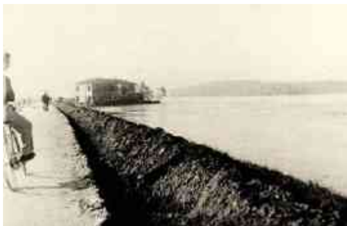
PIENA DEL PO 1951- ZONA CHIAVICONE MOGLIA DI SERMIDE