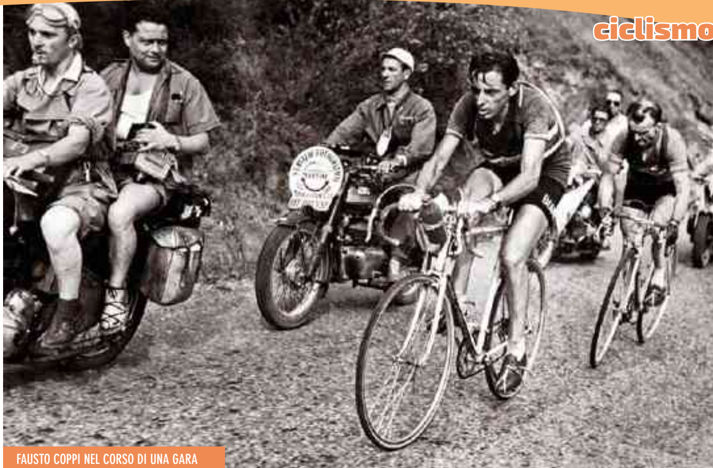
FAUSTO COPPI NEL CORSO DI UNA GARA