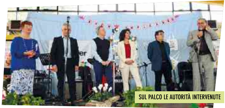
SUL PALCO LE AUTORITÀ INTERVENUTE

Imperdibili e sempre richiestissime le visite guidate con la partecipazione attiva di autorevoli guide.