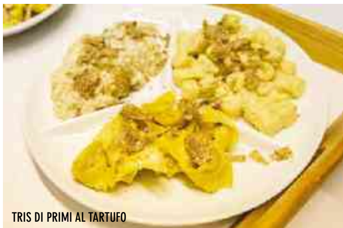
TRIS DI PRIMI AL TARTUFO

SI È CONCLUSA LA VENTICINQUESIMA EDIZIONE DI TUBERFOOD, LA FIERA NAZIONALE DEL TARTUFO BIANCO DI BORGOFRANCO SUL PO, CHE WEEK-END DOPO WEEK-END HA COLLEZIONATO SUCCESSI E SERATE ALL'INSEGNA DEL TUTTO ESAURITO