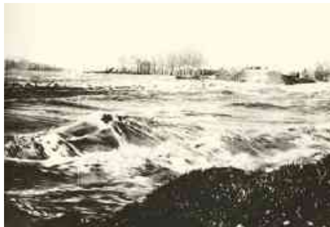
PIENA DEL PO 1951- ROTTA DEGLI ARGINI A MALCANTONE DI OCCHIOBELLO

◆ Il cielo si è rovesciato sulle criniere dei monti sui grovigli dell'erbe sconvolte, sui dirupi e sulle valli e manda messaggi di minaccia nei liquidi rivi scatenati verso il piano. Ora il fiume mansueto si gonfia imbestialito, travolge nel gorgo di fango con infrenabili volumi le cime dei pioppi invasi ciuffi allineati, peneri dispersi. Tremano gli argini a difesa; un uomo guarda la distesa