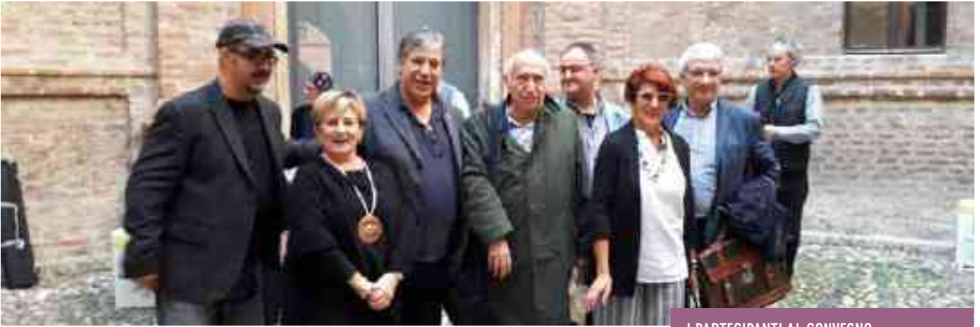
I PARTECIPANTI AL CONVEGNO I SAPORI DELLA NEBBIA

C ontinua l'attività della "Confraternita Turtèl Sguasaròt" di promozione del territorio attraverso la divulgazione e la conoscenza di questo piatto della nostra tradizione. Sabato 26 ottobre si è tenuto a Mantova alla Casa del Mantegna il convegno enogastronomico "I sapori della nebbia" promotori l'Accademia dei Nebbiofili in collaborazione con l'Associazione Mantova Creativa; a rappresentare i piatti che vengono preparati con materie tipiche del periodo autunno-inverno della tradizione mantovana e non solo, sono stati chiamati i Turtèl sguasaròt insieme alla Torta di Sant'Antonio di Quistello, al Tortèl dols di Colorno (Pr), al Sugul dell'Associazione Bondeno di Gonzaga, al Lambrusco 80 vendemmie e il vin cotto de.co della Cantina sociale di Quistello, ai Turtèl scapà di Roncoferraro. Insieme sono stati proposti altri prodotti dell'innovazione come i gelati della nebbia della gelateria Chantilly di Moglia (Mn). La Confraternita come rappresentante