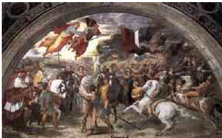
INCONTRO TRA PAPA LEONE MAGNO ED ATTLA A GOVERNOLO (AFFRESCO DEL 1514 IN VATICANO)

in legno, come aveva imparato dai Romani, per il passaggio dell'esercito fino a raggiungere nella parte destra il Ciavgòn una località ad la Moja. Gli abitanti della parte destra del Po conoscevano solo per fama le imprese degli Unni dato che in questa parte dell'Italia non furono toccati dalle loro razzie, distruzioni e crudeltà. Vedendo un esercito così malmesso ed indebolito dalle epidemie, soprattutto la malaria, con i soldati che morivano come mosche, mossi da pietà cercarono di aiutare Attila, in cambio ovviamente di parte del bottino raziato a Nord del