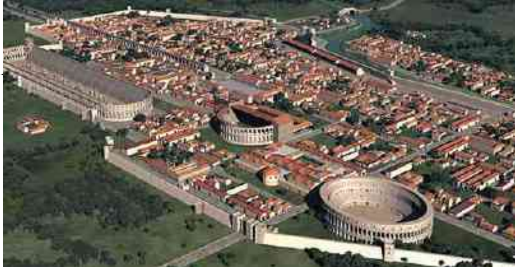
LA CITTÀ DI AQUILEIA PRIMA DELLA DISTRUZIONE AD OPERA DI ATTLA

Nel 452 d.C., reclamando ancora i suoi diritti su Onoria e Valentiniano III, Attila invase l'Italia ed espugnò, dopo lungo assedio, Aquileia distruggendola completamente. Dilagò poi in Veneto saccheggiando Padova ed altre cittadine venete per poi raggiungere senza problemi Milano. A causa di difficoltà di accedere a grandi quantità di viveri e foraggio per il suo numeroso esercito e per la presenza di epidemie varie si spostò da Milano verso il Po. Il papato, pensando che avesse l'intenzione di raggiungere Roma per saccheggiarla, mandò il papa Leone I ad incontrarlo verso Governolo un piccolo villaggio non lontano da Mantova.