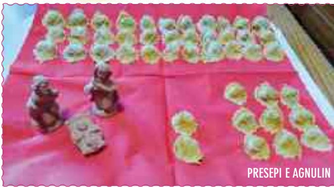
PRESEPI E AGNULIN

◆Presepi e agnulin la Madona cul Bambin 'pena la leva 'l böi la buta dentar in dal pgnatin . San Giusepe al tasta quand iè còtt ic piàs al dent ma guài s' iè scòtt . Quarantaquatar agnulin in fila par tri cun al rest ad du misiat a cuntàri 'chè g'an resta più