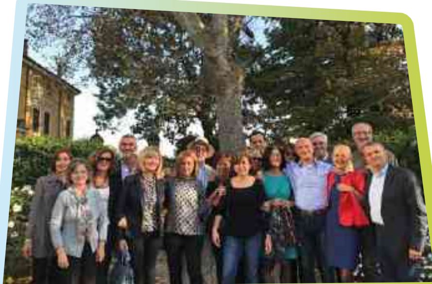
Pranzo di classe 1956 del Liceo Scientifico a Sermide, Villa Schiavi, domenica 27 ottobre 2019