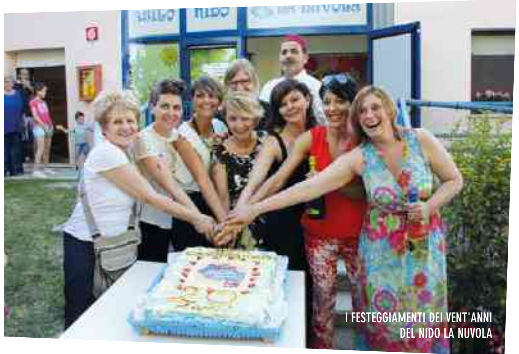
I FESTEGGIAMENTI DEI VENT'ANNI DEL NIDO LA NUVOLO

T anto è trascorso da quel 1997 quando, in territorio poco preparato ad una proposta educativa come il Nido, l'amministrazione comunale di allora affidò alla C.S.A. il difficile compito di promuovere una diversa cultura in materia di educazione infantile, valorizzando il ruolo dell'asilo Nido nella formazione dell'individuo. A questo scopo la Cooperativa decise di investire su un gruppo di ragazze per affrontare questa avventura. Il primo obiettivo di noi educatrici è stato quello di lavorare al meglio per farci conoscere, creare un ambiente accogliente e positivo, gettare le basi per conquistare la fiducia dei genitori e costruire con loro un'alleanza e un progetto condiviso. La cooperativa C.S.A. ci ha prese per mano e attraverso una continua formazione, il costante sostegno e le giuste gratificazioni, abbiamo fatto crescere quella che oggi è diventata una bellissima realtà del nostro territorio. Un lungo cammino di 23 anni durante il quale abbiamo incontrato diverse difficoltà ma anche tante, tante soddisfazioni, un