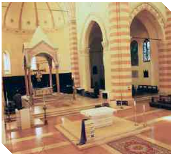
CORO E PRESBITERIO DELLA PARROCCHIALE DI SERMIDE

alla basilica di S. Ambrogio che i colori interni ben richiamano. A conferma di questo stile della Parrocchiale, riportiamo alcuni elementi dimostrativi: le volte a crociera della navata centrale su base sostanzialmente quadrata; le piccole finestre nelle pareti della navata stessa che richiamano il romanico in quanto nel gotico la parete si apre per mezzo del "clair étage"; la presenza di tre finestre nell'abside e la balaustra che, nel progetto originario, chiudeva completamente il presbiterio.