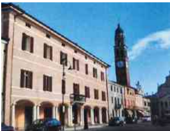
PALAZZO BENTIVOGLIO SI AFFACCIA SU PIAZZA LIBERTÀ A CASTELMASSA