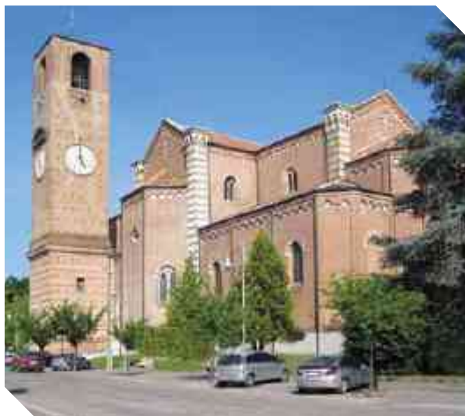
LA MAESTOSITÀ DELLA STRUTTURA COMPLESSIVA DELLA CHIESA SERMIDESE

Lo possiamo affermare senza incertezze e un percorso di visita nei luoghi di culto dei nostri comuni non può che provarlo. Sono quasi tutte restaurate o in fase conclusiva di ristrutturazione, anche a seguito dei recenti eventi sismici, sia per quanto riguarda la parte architettonica sia per le opere di pregio artistico. Invitiamo quindi i lettori a visitarle con rinnovato interesse per riscoprire questo tesoro e fruirne con maggiore consapevolezza: in un cammino di fede, per un personale arricchimento o anche per una civica rivalutazione del nostro patrimonio culturale. In questo e nei prossimi numeri del mensile daremo uno sguardo alle singole chiese parrocchiali evidenziandone gli aspetti più salienti e rimandando, per un maggior approfondimento e più completo materiale di ricerca, alla voce "luoghi di culto" delle singole Parrocchie nel sito www.larivieradelpo.it