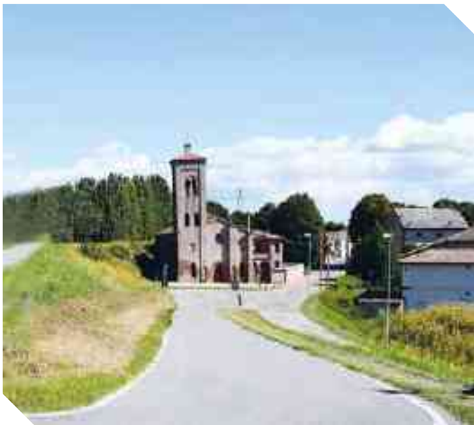
LA CHIESA DI S. MARIA ASSUNTA VISTA DALL'ARGINE MAESTRO DEL PO

Se la percezione della chiesa nella sua spiritualità necessita di una forza meditativa per procedere nel cammino verso Dio e la salvezza divina, nella chiesa sermidese il fedele, entrando dal portale principale, nel percorso verso l'altare è guidato dalla via segnata dalle volte a crociera che danno il ritmo al procedere fino ad arrivare al presbiterio; ed è attratto dal punto luce dato dalle tre finestre absidali che hanno la funzione di illuminare l'altare (naturalmente si considera qui la luce naturale).