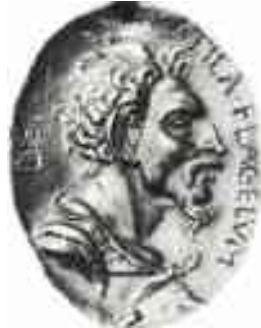
ATTILA IN UN MEDAGLIONE RINASCIMENTALE

♦ Nei primi secoli dell'era cristiana vi fu una siccità eccezionale nell'estremo oriente europeo che spinse i nomadi delle steppe, Unni compresi, a spostarsi verso ovest in cerca di foraggio. Pare che gli Unni europei fossero il ramo occidentale di tribù nomadi antenate dei Mongoli e dei Turchi, originarie dell'Asia centrale. Gli Unni riuscirono ad ottenere la supremazia militare sulle popolazioni rivali, anche se più civilizzate, grazie alla loro abilità nel combattimento, alla capacità di spostarsi facilmente e di usare armi innovative rispetto a quelle usate in Europa e Medio Oriente, come l'arco unno.