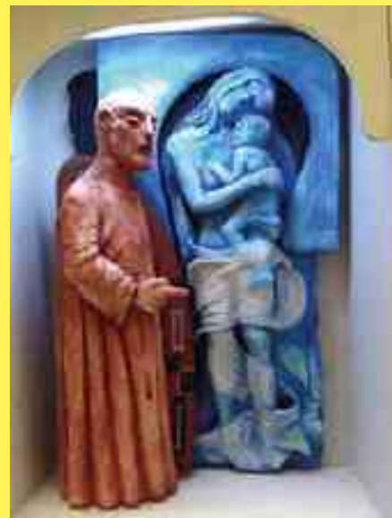
Scultura di Denis Raccanelli