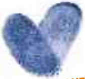
IMMAGINE AZIENDALE | PROGETTI EDITORIALI MARKETING CREATIVO | PUBBLICITÀ