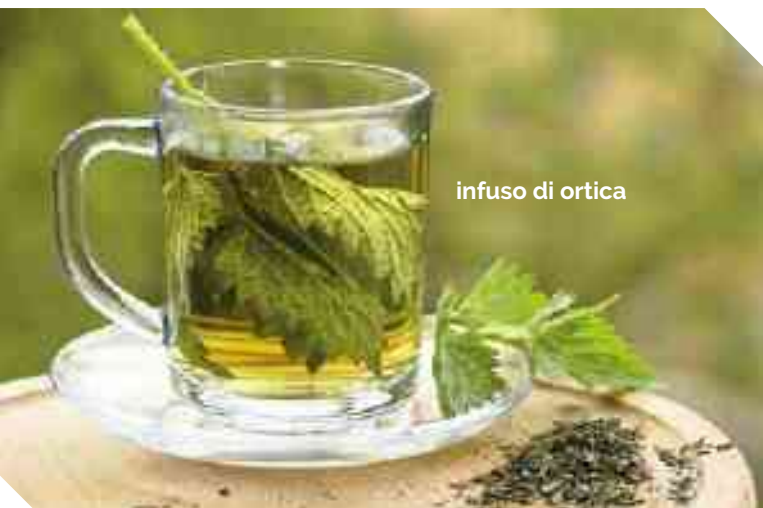
infuso di ortica

Le foglie di Ortica sono ricche di Vitamina C, Vitamine del gruppo B e K, e di minerali come Calcio, Ferro, Magnesio, Fosforo e Potassio, anche se la quantità delle varie componenti si modifica a seconda del momento della raccolta. Notevole è il contenuto in Clorofilla. Le foglie di Ortica sono inoltre ricche di aminoacidi essenziali tra cui Treonina, Valina, Isoleucina, Leucina, Fenilalanina e Lisina. Ma sono anche ricche di metaboliti secondari di interesse nutraceutico, in particolare i composti Fenolici ed i Carotenoidi. Molte sono le specialità all'Ortica, e tra i primi piatti le più note e diffuse sono: Le Tagliatelle all'Ortica, I Tortellini Verdi all'Ortica, il Risotto all'Ortica, le Lasagne all'Ortica e i Gnocchi all'Ortica.