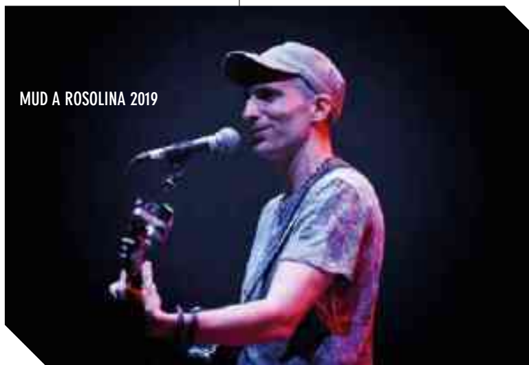
MUD A ROSOLINA 2019

che tanti abbiano voglia di essere parte di questo progetto insieme a me! Per chi volesse farlo può andare su www.ep-pela.com e cercare il progetto “La musica non ha ragione” ( eppela.com/la-musica-non-ha-ragione ). Oppure può andare sul sito www.mudworld.it o cercare attraverso le mie pagine social: www.facebook.com/michelemudofficial oppure www.instagram.com/michele_mud_official/