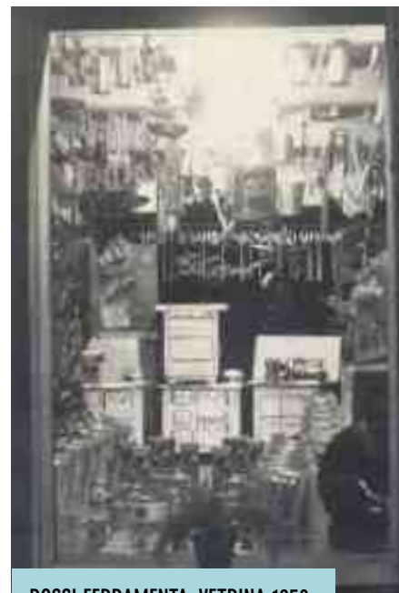
ROSSI FERRAMENTA, VETRINA 1950

Un episodio curioso può essere il seguente: un cliente chiede dei tubi di colore marrone di diametro 12, per uno scaldabagno. Ritorna e dice che servono molto più piccoli, così vengono cambiati con quelli di diametro 8, ma di nuovo ritorna cercandoli più grandi, cioè di diametro