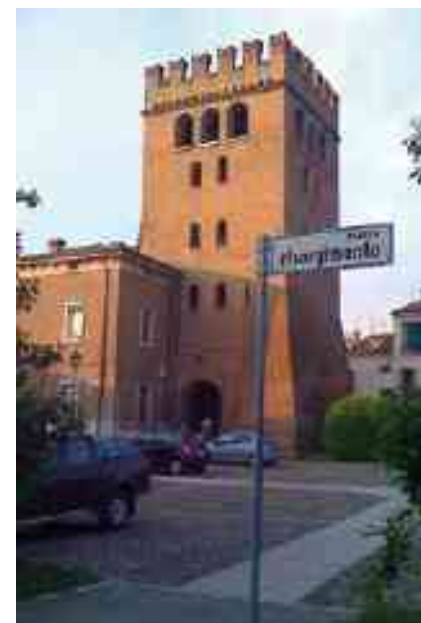
PIAZZA RISORGIMENTO OGGI

così l'area dedicata ai divertimenti, compreso il circo e il luna park, e ancora oggi è la sede principale di concerti, rappresentazioni teatrali e musicali nel periodo fieristico.