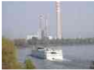
Centrale Elettrica Edipower

Nella serata del 23 Novembre 2010 all'assemblea annuale di Aria Pulita, al centro ambientale della ex teleferica, in un acceso dibattito si era discusso sull'utilizzo o meno del caminone da un punto di vista turistico, infatti dalla sua sommità si po-