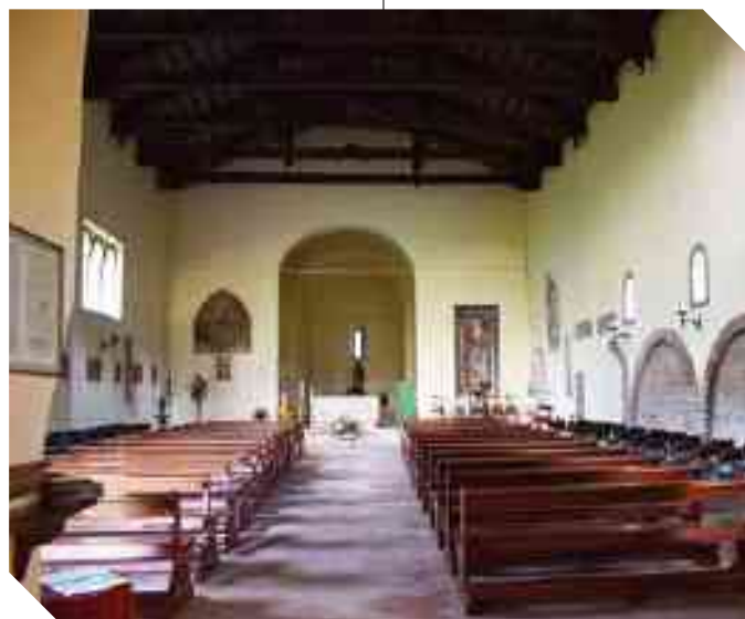
L'INTERNO DELLA CHIESA PARROCCHIALE DI FELONICA

dal confronto delle fotografie esistenti, da portale romanico con arco a tutto sesto diventa neogotico con arco a sesto acuto pur ben inserito nel contesto architettonico e di buon impatto visivo. All'interno sono presenti alcuni segni essenziali dello stile romanico: l'arco a tutto sesto che precede la profonda abside a conclusione della navata unica, la copertura a capriate, le tre piccole finestre strombate della parete destra. Una struttura che sicuramente arricchisce l'interno è data dal bel loggiato-cantoria della parete di fondo, con sei archi aperti verso l'aula ecclesiale, poggianti su colonnine di cotto abbinata.