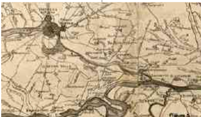
MAPPA DELLA ZONA MANTOVANA DOVE È SITUATO IL PAESE DI GOVERNOLO LUNGO IL MINCIO, AFFLUENTE DI SINISTRA DEL PO

ennesimo matrimonio. Pare che sia morto per una emorragia digestiva interna, ma per alcuni storici forse morì trafitto dalla spada della sua nuova moglie. I numerosi figli, fra cui il successore designato Ellak, non furono alla sua altezza. Si combatterono fra di loro e uno alla volta furono sconfitti dai nemici interni. Nonostante il suo impero si sia disgregato alla sua morte, tuttavia Attila è diventato una figura leggendaria nella storia europea: guerriero feroce, avido e crudele nell'area al tempo sotto Roma; condottiero impavido e coraggioso nei paesi che facevano parte del suo impero. A Budapest Attila non solo non è accompagnato da alcuna nomea negativa, ma anzi è considerato una sorta di eroe nazionale. Attila è ancora un nome proprio molto comune e la storia della cultura magiara è ricca di opere che forniscono del sovrano del V secolo un'immagine eroica e cavalleresca.