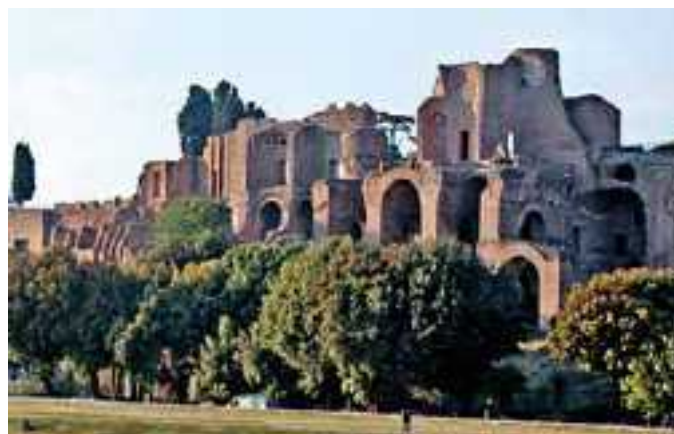
Domus Flavia Domiziana, il Palazzo Imperiale sul Palatino

suo corpo fu posto in una bara plebea e le ceneri vennero portate in gran segreto nel tempio dei Flavi. La sua morte fu accolta con indifferenza dal popolo ma con indignazione dai soldati che lo vendicarono poco dopo facendo condannare gli assassini. Il Senato invece manifestò la più grande gioia e ne decretò la "Damnatio Memoriae".