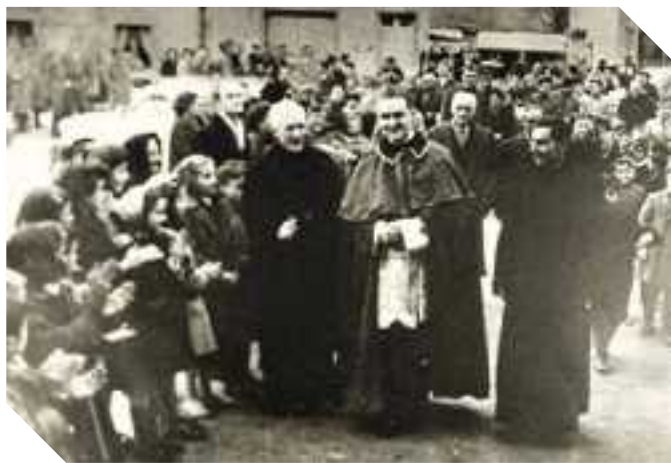
1959 Moglia di Sermide Il Vescovo Monsignor Antonio Poma tra una grande folla di fedeli in occasione della cresima

grande festa in paese. La mattina si organizzava il corteo delle macchine (quelle poche che c'erano) che a Capo Araldi (zona centrale elettrica) aspettava l'auto del Vescovo per accompagnarlo in corteo fino in paese. La piazza era piena di gente, pronta all'applauso all'arrivo del vescovo e, dopo i saluti, in processione si entrava in chiesa per la cerimonia. Un particolare della funzione religiosa, che poi è sparito, era che prima di consegnare il vino al Vescovo celebrante, il suo segretario beveva un sorso di vino davanti all'assemblea per