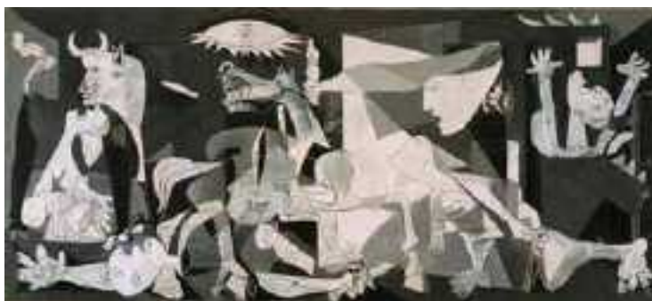
Pablo Picasso, Guernica, maggio – giugno 1937, olio su tela, cm 351 x 782.

Dalla lettera di san Paolo ai Colossesi (3,12-15): «12 Scelti da Dio, santi e amati, rivestitevi dunque di sentimenti di tenerezza, di bontà, di umiltà, di mansuetudine, di magnanimità, 13 sopportandovi a vicenda e perdonandovi gli uni gli altri, se qualcuno avesse di che lamentarsi nei riguardi di un altro. Come il Signore vi ha perdonato, così fate anche voi. 14 Ma sopra tutte queste cose rivestitevi della carità, che le unisce in modo perfetto. 15 E la pace di Cristo regni nei vostri cuori, perché ad essa siete stati chiamati in un solo corpo. E rendete grazie!»