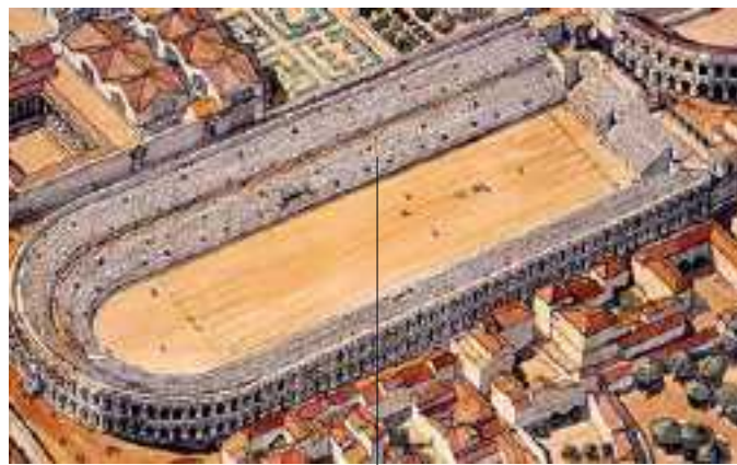
Stadio Domiziano su cui sarà costruita Piazza Navona odierna.