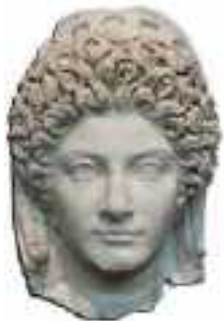
Flavia Domitilla, la nipote, eliminata insieme a tutta la sua famiglia

senatorio, progressivamente relegato alla misera ratifica delle sue decisioni, lo portò a compiere gesti di inaudita crudeltà. Molti senatori furono uccisi, altri costretti al suicidio, altri ancora furono mandati prima in esilio e poi raggiunti da sicari e uccisi per ordine dell'Imperatore. Molti vennero accusati e uccisi con la scusa di aver ordito congiure inesistenti o reati assurdi. Divenuto oggetto di terrore e di odio per tutti, era preoccupato di divenire vittima di una cospirazione. Nel 90 fu infatti ordita una seria congiura ai suoi danni da parte delle legioni del Governatore della Germania Superiore, Lucio Antonio Saturnino, alleatosi per l'occasione con i feroci Catti. Domiziano alla guida dei pretoriani partì immediatamente per il fronte. Sconfitti gli insorti, si fece inviare le teste dei congiurati che furono esposte nel Foro Romano come monito. Dopo questa grave sollevazione militare il Sovrano soppresse chiunque credeva o gli veniva indicato come avverso al potere imperiale. Perirono per futili motivi tanti eminenti cittadini. Fece uccidere anche suoi congiunti come lo zio Tito Flavio Sabino, fratello di Vespasiano e la nipote Flavia Domitilla, figlia