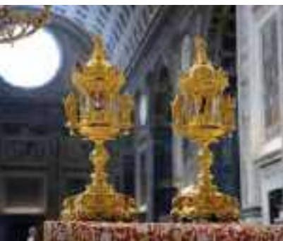
I SACRI VASI IN SANT'ANDREA