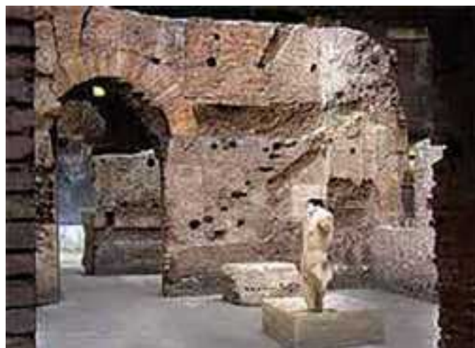
Resti dello stadio di Domiziano sotto l'odierna piazza Navona