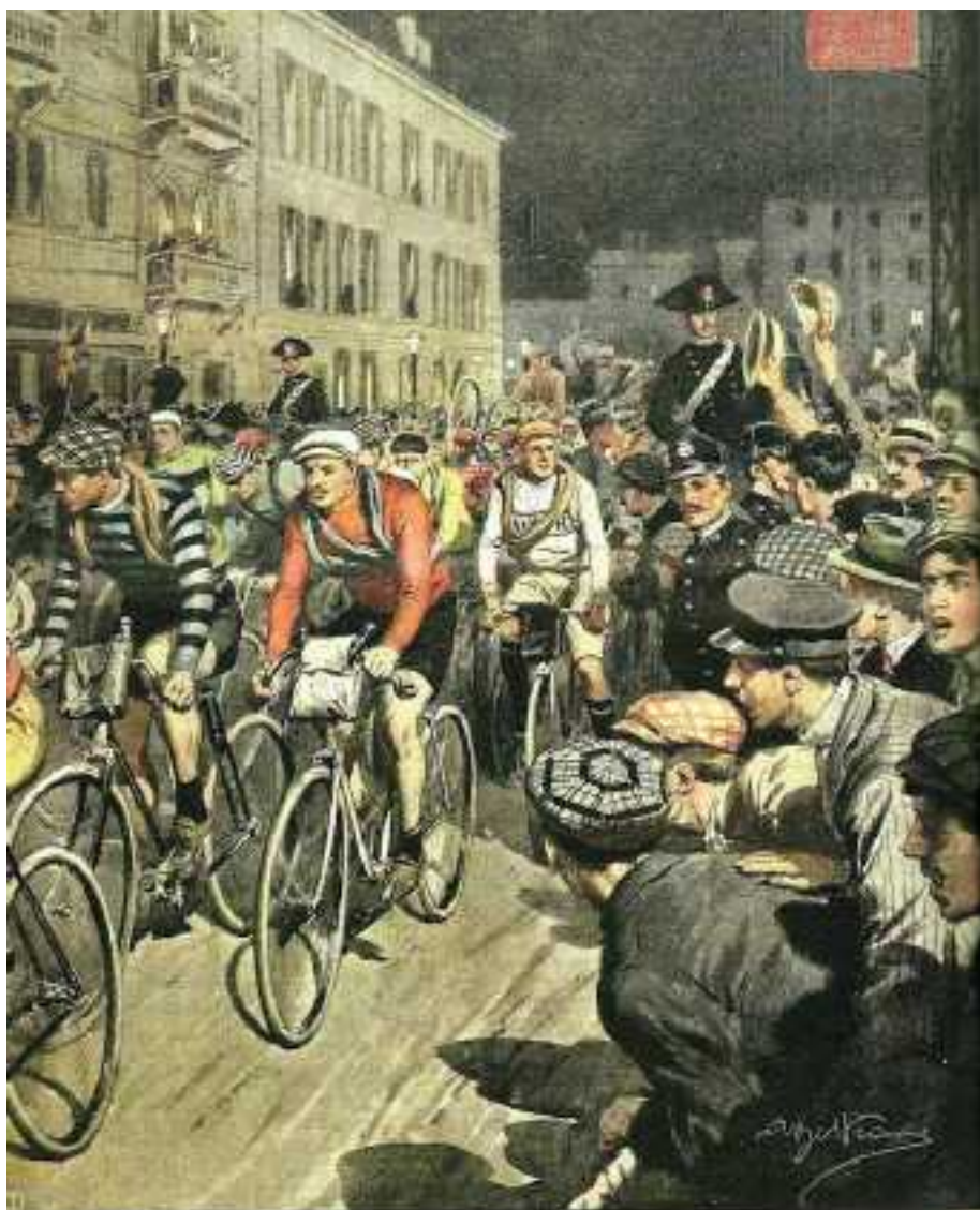
La partenza di Milano nella ore serali del 19 settembre 1909, del corridoio scritto al giro ciclistico d'Italia. (Disegno G.A. Tolson)