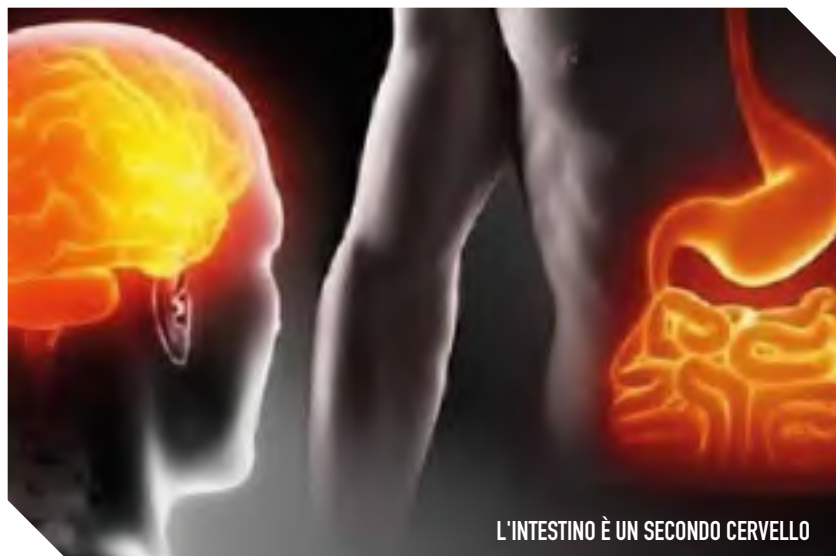
L'INTESTINO È UN SECONDO CERVELLO

Dopo due anni di Pandemia, si cerca una normalità che forse non è mai esistita, tra inquinamento, distruzione di biodiversità e disuguaglianze senza precedenti