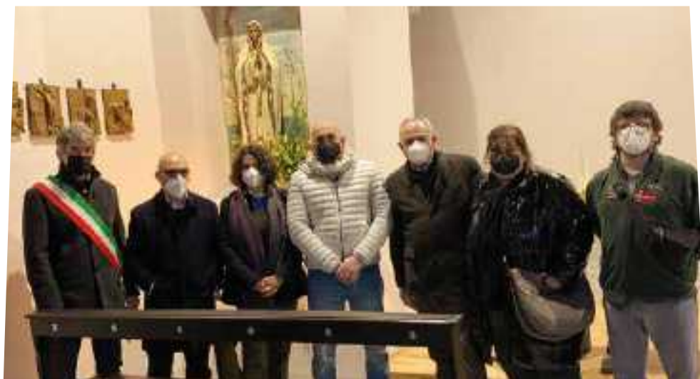
INAUGURAZIONE DELLA CAPPELLINA DI PORCARA

Ora la piccola Cappella di Porcara è riaperta, perché chiunque possa sostarvi, anche soltanto per un momento. La Vergine di Lourdes, collocata nella nicchia accanto all'altare, resterà sempre lì, ad attendere, per una carezza sul cuore, anche te, anonimo lettore di queste righe e viandante di cielo.