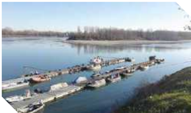
IMMAGINI DEL PO, NEL TRATTO SERMIDE-FELONICA A FEBBRAIO, CHE EVIDENZIANO IL BASSO LIVELLO DELLE ACQUE E L'EMERGERE DI ISOLE DI SABBIA CONSEGUENTE ALL'ANOMALA SICCATÀ.