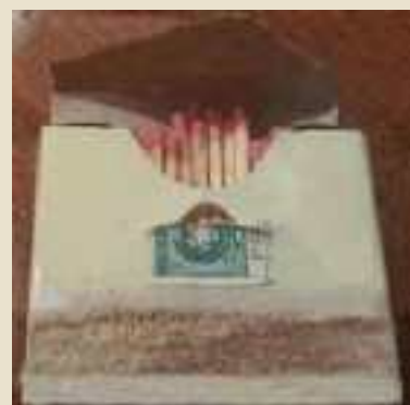
"Sulfanei", fiammiferi in legno tipo svedesi metà anni '50

tipo svedesi, con capocchia di zolfo, che si accendeva sfregandola su una superficie ruvida tipo carta vetrata, incollata o ricavata sulla scatola. Erano usati per accendere il fuoco sia nella stufa che nel camino, le candele e le lucerne.