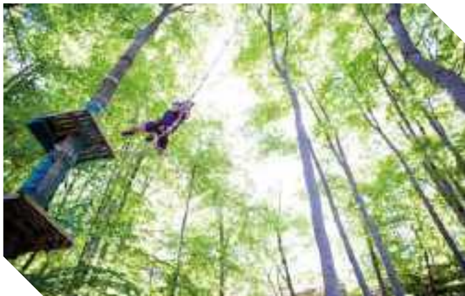
UN FANTASTICO VOLO FRA GLI ALBERI... EFFETTO TARZANING

In diversi casi i parchi avventura si trovano all'interno di un centro di educazione ambientale. È il caso del Fagus Park-Valle delle Aquile, il primo parco acrobatico del centro sud, che si trova all'interno del CEA di Fontenova, a 1500 m. di quota, a 10 Km. dal paese medioevale di Leonessa (RI), nel Parco Nazionale dei Monti Sibillini. Nel centro si svolgono varie attività nel laboratorio sperimentale interno e all'aperto nel bird-garden o nei secolari boschi di faggio che circondano l'area. In collaborazione con il Fagus Park, che ospita 11 percorsi diversi tra scale verticali e ponti nepalesi, organizza escursioni e punti di osservazione dei numerosi esemplari di uccelli, tra i quali l'aquila reale che nidifica nelle cime più elevate del comprensorio dei Monti Reatini.