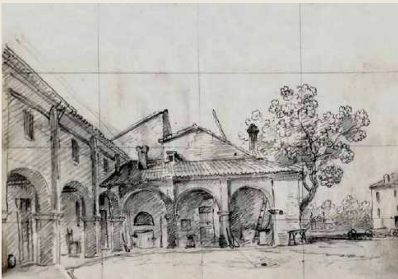
Disegno 4 > Titolo: Veduta di una parte del cortile del Palazzo Magnaguti di Sermeide... / Tancredi Liverani