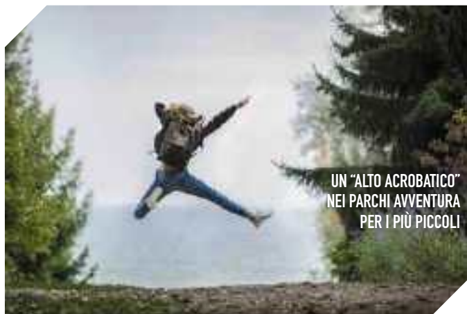
UN "ALTO ACROBatico" NEI PARCHI AVVENTURA PER I PIÙ PICCOLI

Questo parco avventura per bambini in Piemonte propone un percorso baby e super baby da 3 a 6 anni, oltre a uno spazio arrampicata e minigolf per un tempo massimo di 3 ore. Per i bambini dai 6 anni c'è il percorso verde e diversi altri a seconda dell'altezza raggiunta dal