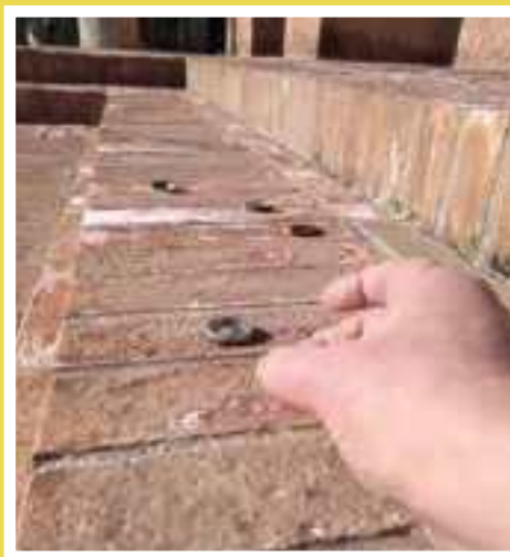
Cun un crick na 'uláda