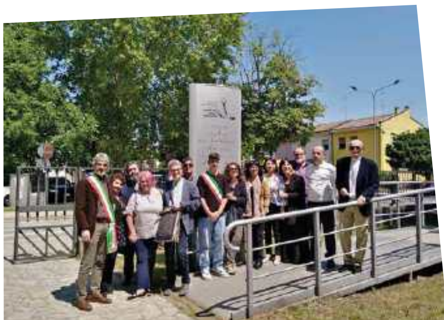
I PROTAGONISTI DELL'INAUGURAZIONE DELLA STELE DONATA DAGLI AMICI

Cinque i premi previsti, assegnati alle classi: tre per la Scuola Primaria, uno per ciascuna sede, e due allo stesso modo per la Secondaria di 1° grado. Ecco i vincitori della Scuola Primaria, che hanno portato presso la loro sede una stampante laser e una dotazione di libri pubblicati da Sermidiana