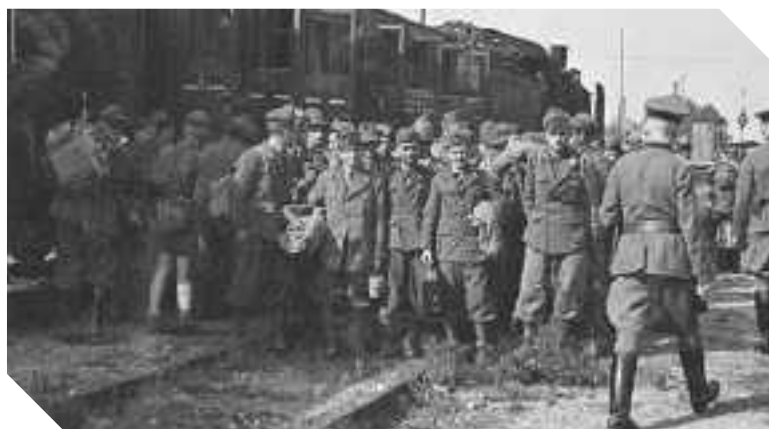
L'ARRIVO DI SOLDATI ITALIANI IN UN CAMPO DI PRIGIONIA TEDESCO

Alla fine di maggio ci è giunto l'ordine di partire per la Grecia per dare il cambio a dei nostri contingenti che non venivano avvicendati da molti mesi. Con la tradotta siamo partiti dalla stazione di Vicenza passando poi per Trieste; attraversando la Jugoslavia ho notato che moltissime stazioni erano cinte da parapetti e palizzate trincerate, per difenderle dagli attacchi delle milizie slave, che compivano ogni genere di sabotaggio. Il nostro viaggio è durato una decina di giorni ed ai primi di giugno siamo giunti ad Atene. Dopo alcuni giorni la mia unità, circa 800 effettivi, è stata trasferita sull'isola di Zante, con l'incarico di sorvegliare un tratto di costa. Per procurarci gli alloggiamenti abbiamo requisito ai contadini