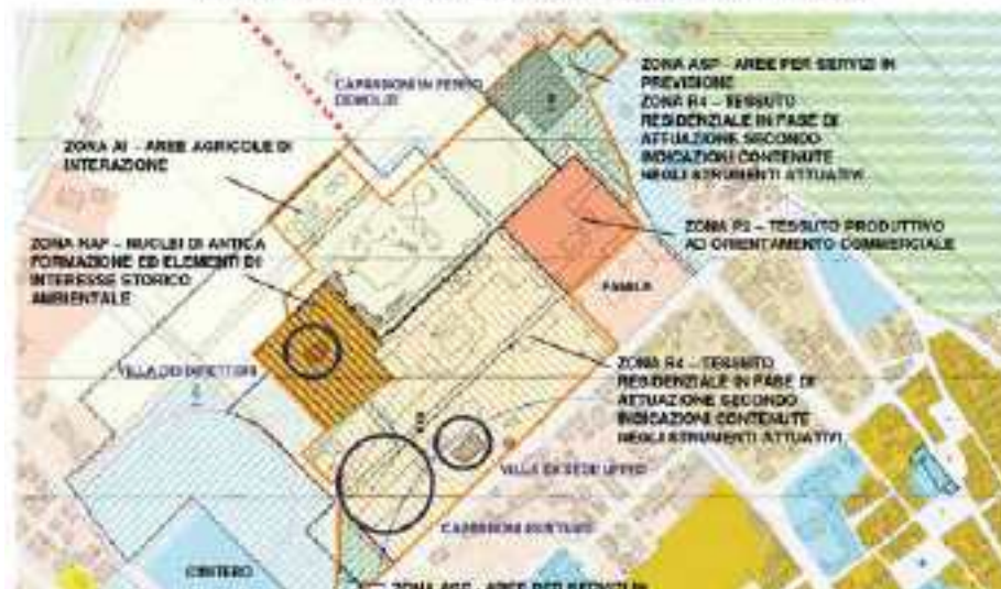
ATTUALE PGT ZONA EX ZUCCHERIFICIO

Amministrazione di contattare la proprietà anche perché non ci risulta che i vari proprietari nel corso degli anni abbiano mai versato alle casse comunali la dovuta imposta IMU! Qualsiasi proprietario di immobili e terreni sa che in base alla destinazione d'uso indicata dal Piano regolatore il Comune attribuisce alle aree un valore. Tale valore moltiplicato per la superficie e per il coefficiente stabilito dal Comune stesso corrisponde all'IMU da versare ogni anno