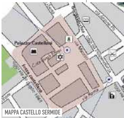
MAPPA CASTELLO SERMIDE

Sermide è il diploma di Ottone III dell'anno 997, che investe il Vescovo di Mantova quale proprietario di diversi fortificati militari fra cui il nostro. In questo periodo l'edificio non deve essere inteso come un vero e proprio castello, ma con molta probabilità, ergendosi sopra un luogo rialzato, semplicemente uno spazio fortificato, cinto da mura e dotato di una torre affiancata da un fabbricato. Con il Mille si intensifica il consolidamento dei baluardi difensivi e Sermide è geograficamente coinvolta in un'ampia opera di rafforzamento strategico: viene costruito il quartiere fortificato. È l'era dei castelli: Bariano (1000), Ficarolo (1077), Revere (1125) ed Ostiglia nel 1151, anno in cui la rotta del Po a Ficarolo sconvol-