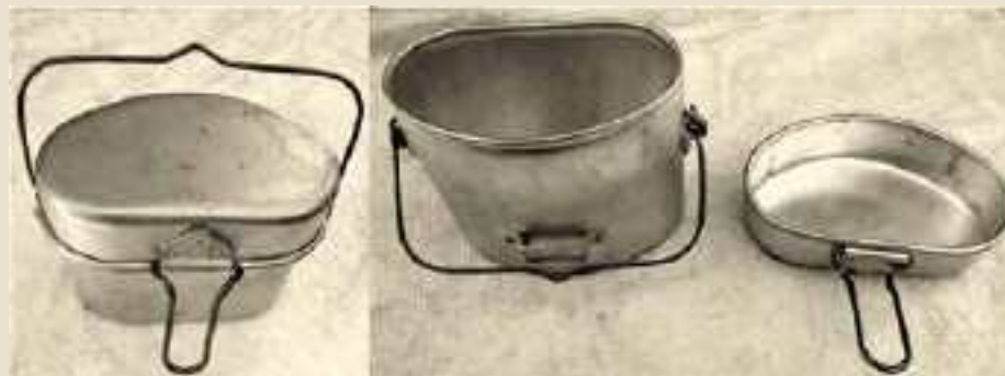
Gavetta - primi anni '50

Questo oggetto, come "residuo civile" della seconda guerra, lo si poteva vedere praticamente in tutte le case. Era di alluminio e veniva utilizzato dai militari come contenitore del loro rancio (pasta). Era composto in due parti: il contenitore vero e proprio completo di manico in ferro e il coperchio, pure questo completo di un manico/impugnatura in ferro che, girato nella giusta posizione lo trasformava in una specie di piatto. Il nome "gavetta" ha assunto anche altri significati sia in ambiente militare: si diceva di un ufficiale che proveniva dai gradi più bassi nell'esercito "veniva dalla gavetta"; mentre di uno che si era fatto una posizione in ambiente lavorativo, con sacrifici continui e lodevoli, si diceva "ha fatto una bella gavetta". Ancora oggi questo oggetto lo si vede in qualche soffitta, tenuto come ricordo per l'importanza che ha avuto.