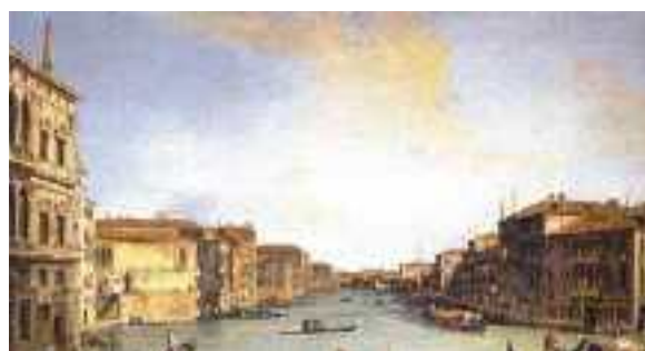
Canaletto, Veduta del Canal Grande, Venezia, 45 x 73cm, opera 1730 circa

Il Signore Dio prese l'uomo e lo pose nel giardino di Eden, perché lo coltivasse e lo custodisse. Il Signore Dio diede questo comando all'uomo: «Tu potrai mangiare di tutti gli alberi del giardino, ma dell'albero della conoscenza del bene e del male non devi mangiare, perché, nel giorno in cui tu ne mangerai, certamente dovrai morire».