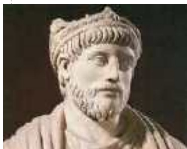
Flavio Claudio Giuliano "l'Apòstata"

Nota: La commistione di avvenimenti reali e totalmente inventati è puramente voluta.