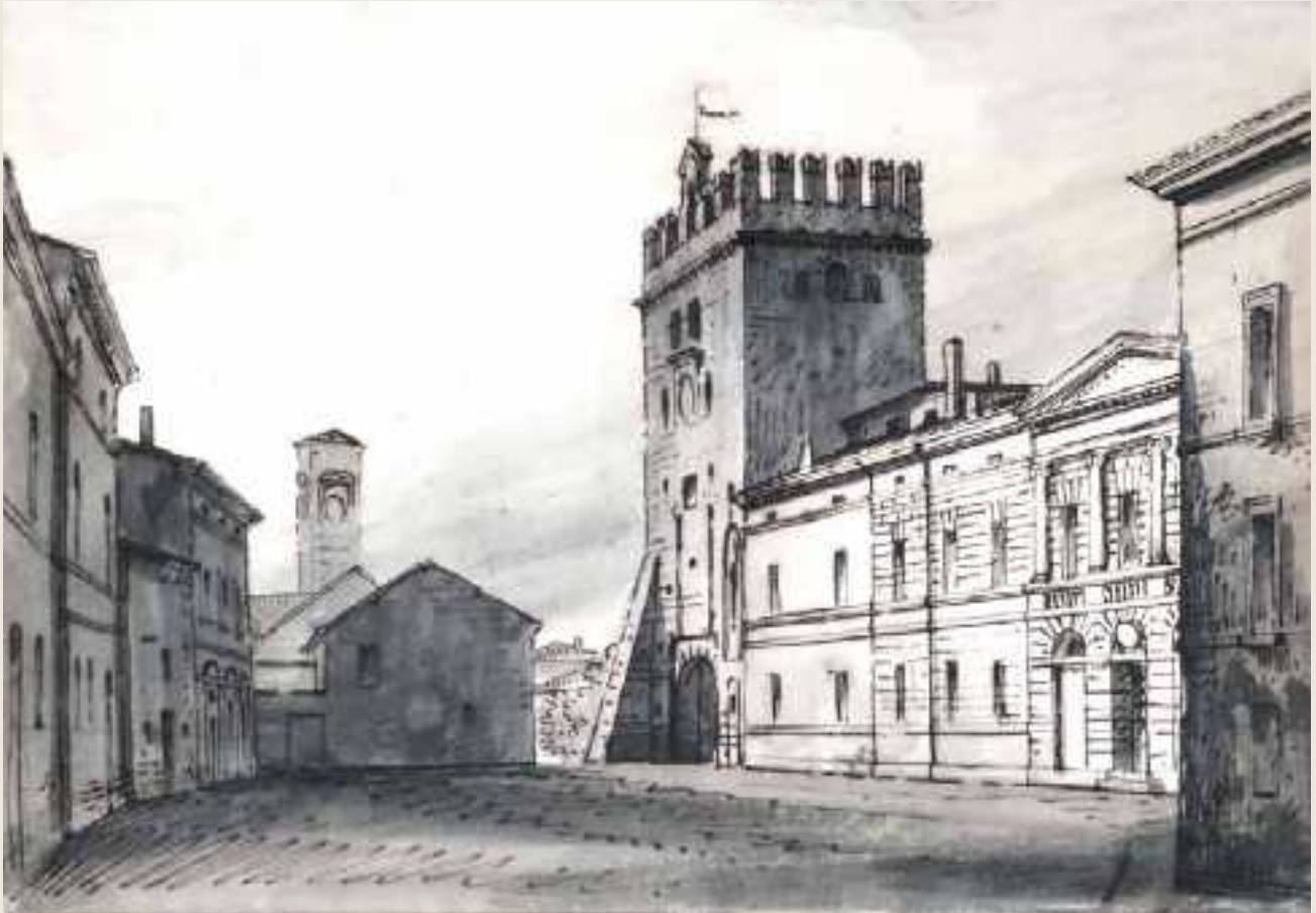
Disegno 1 > Titolo: Veduta della piazza di Sermide, del Palazzo Comunale... / Tancredi Liverani