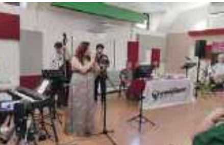
ALCUNI MOMENTI DEL CONVEGNO AL LAB 105