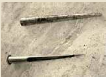
Strumento prova umidità per cereali-primi anni '50

Questo strumento lo si poteva trovare in quasi tutte le case rurali. Generalmente lo usava, per competenza, il rasdor (capofamiglia) quando vendeva alcuni prodotti agricoli come il frumento o altri cereali. Serviva per provare l'umidità dei prodotti da vendere collocati nei sacchi di iuta. Si infilava la punta nel sacco per prelevare un campione di cereale tramite l'apposita scanalatura. Collocando poi i chicchi prelevati in un apparecchio apposito, si poteva rilevare il grado di umidità. Questa operazione era importante per determinare il giusto prezzo di vendita, sempre subordinato al grado di umidità rilevata.