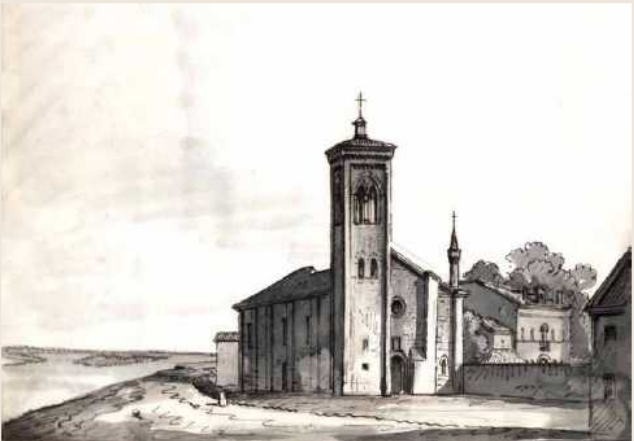
Disegno 2 > Titolo: Veduta della Chiesa di Felonica 3 Miglia Doppo [sic] Sermide... / Tancredi Liverani