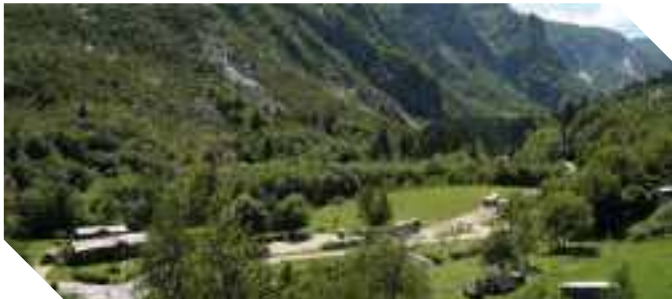
IL PARCO FLUVIALE DEL TORRENTE CENTA CHE OSPITA L'ACROPARK RIO CENTA A 4 KM DA CALDONAZZO IN VALSUGANA

La voglia di trascorrere giornate all'aria aperta a contatto con la natura, dove potersi mettere alla prova con attività fisiche originali e divertenti si sta espandendo e trova un'occasione nei parchi-avventura che attraggono sempre più persone. Ma cos'è un parco avventura? È un'area verde alberata formata da percorsi prevalentemente aerei, differenziati per difficoltà e impegno, attrezzati con passerelle, reti, carrucole, ponti, travi, funi. Questi parchi stanno diventando anche un valido strumento di educazione ambientale e un modo innovativo per riqualificare aree boschive. Eccone alcuni nelle varie regioni.