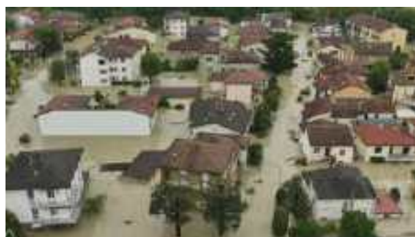
Faenza, 15 maggio 2023

Q uesto brano appartiene ai particolarissimi racconti dei primi undici capitoli della Genesi, il libro che è stato collocato all'inizio della Bibbia. In queste righe del secondo racconto della creazione l'autore ci conduce a riflettere su alcune prospettive molto avvincenti. La prima: per plasmare l'uomo Dio prende della terra e per renderlo vivente gli soffia il suo alito di vita nelle narici. La seconda: la terra che Dio crea per avere un luogo dove collocare l'uomo è un dono. La terza: Dio pianta un giardino e vi pone l'uomo con un preciso compito: perché lo coltivi e lo custodisca; ma anche un