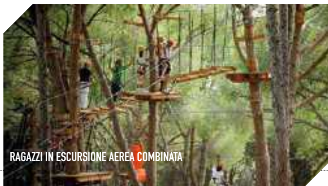
RAGAZZI IN ESCURSIONE AEREA COMBINATA

In una zona di grande pregio naturalistico alle porte di Roma, nel cuore del Parco Regionale Valle del Treja, nasce il Treja Adventure, il parco avventura più grande del Lazio. I 10 percorsi, distinti per difficoltà e tipologia, sono adatti a tutti: presenta percorsi baby, accessibili a partire da 1 metro di altezza e percorsi più impegnativi. Per i percorsi sospesi bisogna essere alti più