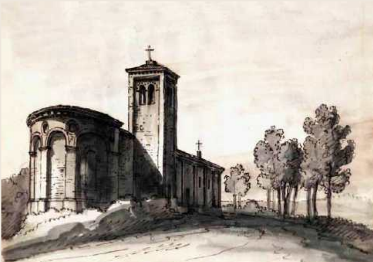
Disegno 3 > Titolo: Veduta di S. Croce di Lagurano in Val di Sermeide... / Tancredi Liverani