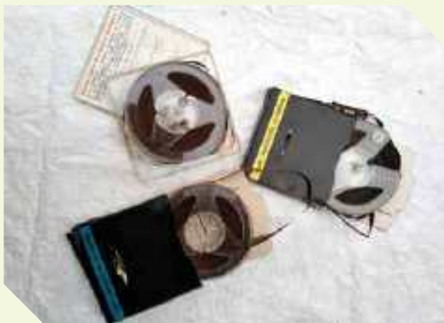
Nastri magnetici tipo bobina aperta per registratore - primi anni '70

Sono supporti di memorizzazione a memoria magnetica che consiste in una sottile striscia di materiale plastico, solitamente di colore marrone chiaro, rivestita con un materiale trattato con polarizzazione magnetica. Si tratta di bobine aperte, un formato di nastro magnetico che a differenza delle "musicassette o delle videocassette" hanno un'estremità del nastro libero..." (questa definizione viene ripresa da Internet)". La foto, che rappresenta i nastri magnetici usati con il registratore, è piuttosto emblematica: oggi il contenuto completo di tutti e tre i nastri, potrebbe benissimo essere riversato, in forma digitale, in una qualsiasi piccola scheda di memoria di capacità inferiore ad 1 GB. Sono i "Progressi della tecnologia"