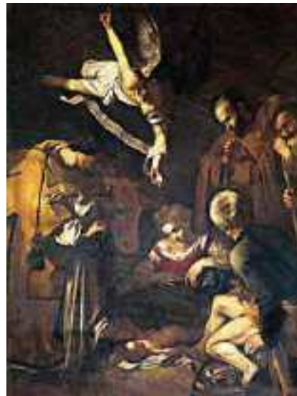
Natività con i santi Lorenzo e Francesco d'Assisi

Dalla lettera di san Paolo ai Filippesi (4,4-9): «Siate sempre lieti nel Signore, ve lo ripeto: siate lieti. La vostra amabilità sia nota a tutti. Il Signore è vicino! Non angustiatevi per nulla, ma in ogni circostanza fate presenti a Dio le vostre richieste con preghiere, suppliche e ringraziamenti. E la pace di Dio, che supera ogni intelligenza, custodirà i vostri cuori e le vostre menti in Cristo Gesù. In conclusione, fratelli, quello che è vero, quello che è nobile, quello che è giusto, quello che è puro, quello che è amabile, quello che è onorato, ciò che è virtù e ciò che merita lode, questo sia oggetto dei vostri pensieri. Le cose che avete imparato, ricevuto, ascoltato e veduto in me, mettetelo in pratica. E il Dio della pace sarà con voi!».