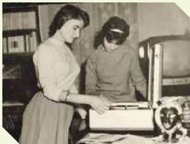
Ragazze ad una festina cambiano il disco sul giradischi fine anni '50