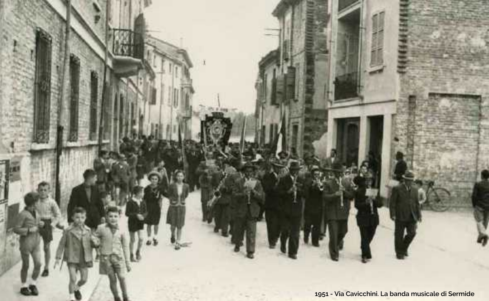
1951 - Via Cavicchini. La banda musicale di Sermide