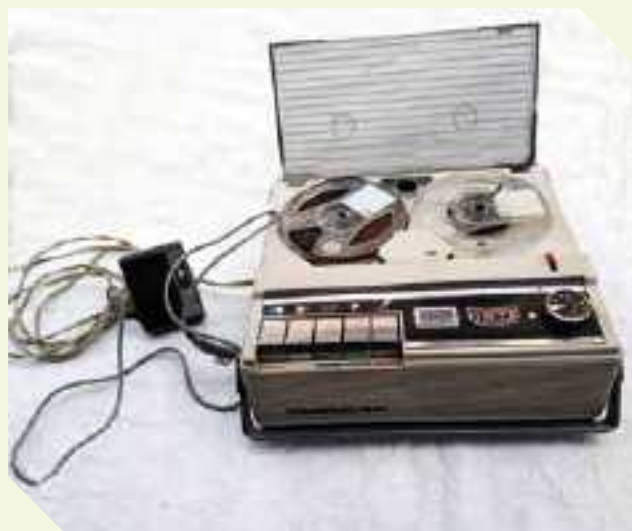
Registratore a nastro magnetico fine anni '60

Apparecchio impiegato per la registrazione e riproduzione sonora su nastro magnetico. Era composto dal corpo centrale e da un microfono per registrare suoni, utilizzando supporti a "bobina aperta", contenente un nastro magnetico.