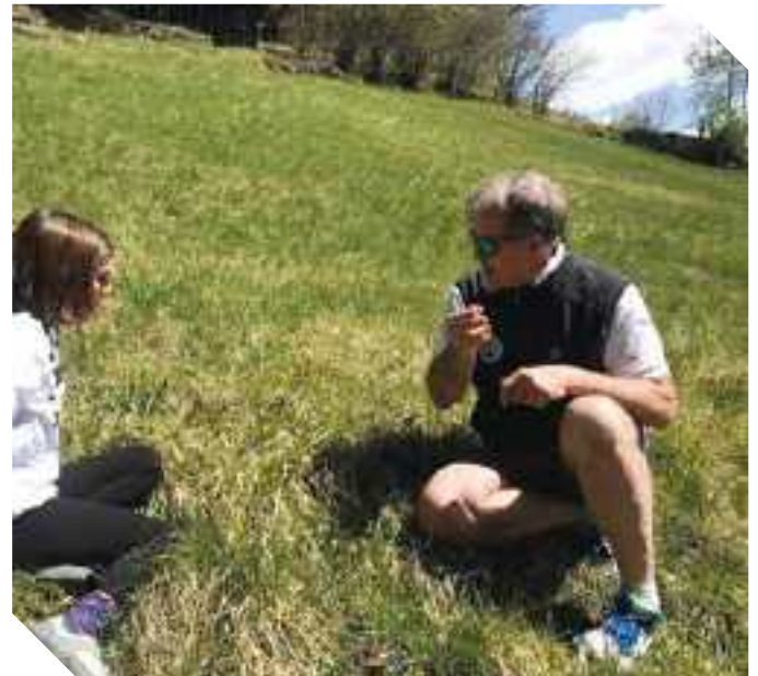
ESPERIENZE SUL CAMPO