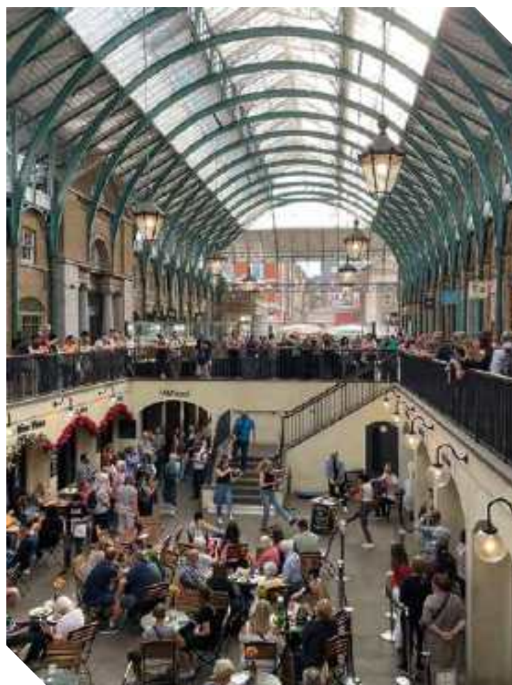
SOPRA: UN'IMMAGINE DI COVENT GARDEN CHE NON TUTTI SANNO ESSERE L'ANTICO CHIOSTRO DEL CONVENTO DELL'ABBZIA DI WESTMINSTER

BLOOMSBURY è il quartiere intellettuale di Londra, in cui ha sede il British Museum. Attrattivo per lo stile elegante tra edifici vittoriani giardini e viali, Bloomsbury ospita la piazza alberata più grande di Londra, Russel Square.