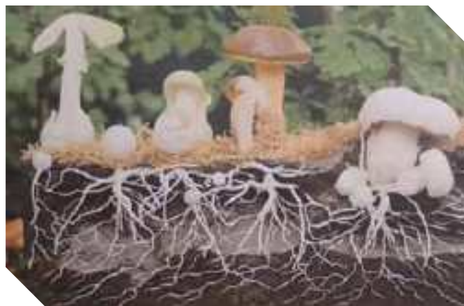
COMUNITÀ MICOLOGICS IL MICELIO CHE PERMEA IL SOTTOSUOLO ED I SUOI FRUTTI

Da oltre 10mila anni chiediamo loro aiuto per la fermentazione alcolica di birra e vino o per la lievitazione del pane e, in cambio, li coltiviamo con la pasta madre. Sono i principali nemici dei batteri e noi sfruttiamo molte delle molecole che loro producono, che chiamiamo antibiotici, per combatterli come la nota Penicillina. Sempre casualmente abbiamo scoperto che sono in grado di produrre sostanze immunosoppressori, come la Ciclosporina, che usiamo per contrastare il rigetto nei trapianti. Alcuni funghi sono in grado di combattere un fe-