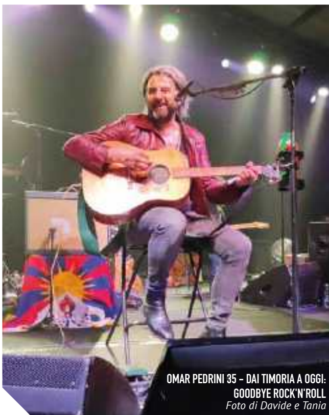
OMAR PEDRINI 35 - DAI TIMORIA A OGGI: GOODBYE ROCK'N'ROLL