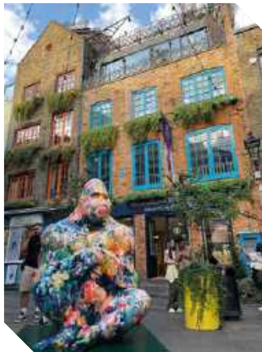
UN'ECCENTRICA SCULTURA NEL COLORATO QUARTIERE DI NEAL'S YARD