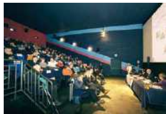
sopra: il nutrito pubblico al Capitol Multisala