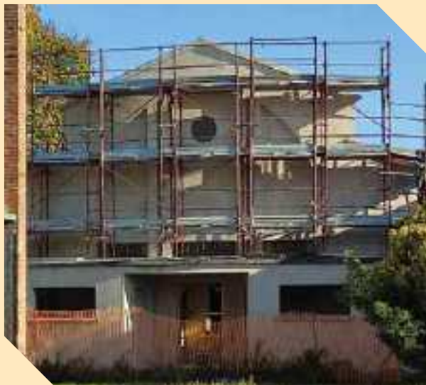
FACCIATA RISTRUTTURATA DEL TEATRO DI MOGLIA