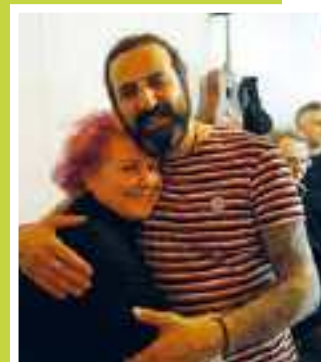
ENRICA E OMAR

Omar è stato ospite al Capitol Multisala di Sermide nel 2018 in occasione della presentazione della sua biografia scritta dalle mani di Federico Scarioni, l'incontro si è scaldato al suono delle magiche chitarre di Omar Pedrini e Enrico Zapparoli, grandi amici nella vita e ottimi musicisti nell'arte. Nell'occasione l'artista ha ricevuto simbolicamente le "chiavi della Città di Sermide" dal sindaco Mirco Bortesi.