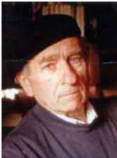
Ermes Simili 2003

S i inserisce nell'ambito delle iniziative per la celebrazione del centenario della nascita di Ermes Simili (1923-2023) la mostra dedicata alle "Sculture" del grande castelmassese, che ha saputo conquistarsi fama nazionale con la sua attività artistico ed ha formato intere generazioni di giovani creativi nell'arco di quarant'anni di docenza (dal 1944 al 1984) allo storico Istituto d'Arte di Castelmassa, dove egli stesso aveva compiuto i