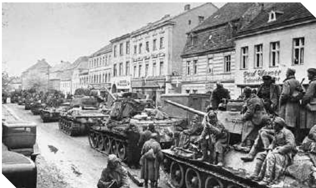
UNA COLONNA CORAZZATA DELL'ARMATA ROSSA DURANTE UNA SOSTA IN UNA CITTADINA DELLA GERMANIA ORIENTALE, PRIMA DI RIPRENDERE L'AVANZATA VERSO BERLINO

♦ Risultato rivedibile alla visita militare di leva della mia classe, l'anno dopo, nel maggio del 1942 sono invece stato dichiarato abile ed inquadrato nel 232° reggimento fanteria di stanza a Bolzano, rimanendovi a svolgere i compiti di presidio fino al 8 settembre 1943. In libera uscita con alcuni commilitoni, nel tardo