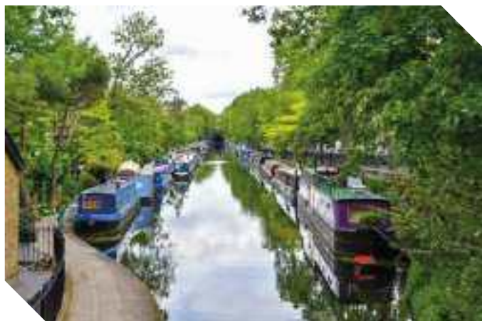
BARCHE-CASE GALLEGGIANTI LUNGO UN CANALE DELLA LITTLE VENICE LONDINESE. IN ALCUNI CASI TRASFORMATE IN VERI E PROPRI LOCALI

→ visse in questa abitazione nel '700, e a Jimi Hendrix che visse per un periodo nell'appartamento accanto 250 anni dopo. Myfair è noto inoltre per il mercato che ha luogo nella chiesa sconsacrata di St.Mark: si sviluppa su quattro piani con vari angoli e specialità anche italiane; nella cripta è stata ricavata una cantina. Alle spalle del mercato inoltre si trova il Brown Hart Gardens, un giardino terrazzato rialzato, a sud di Oxford Street, in uno spazio che prima era una centrale elettrica.