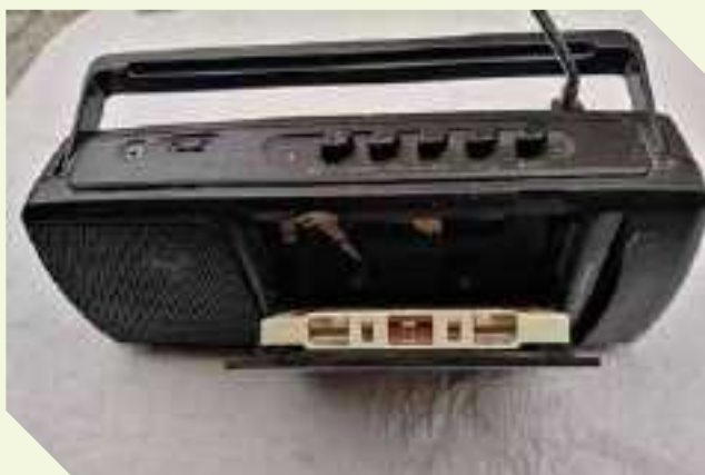
Radio Registratore - primi anni '80

Negli anni '70 e '80 erano diversi gli apparecchi impiegati per ascoltare musica e notizie come radiogiornali ecc. Erano molti anche quelli che, con una particolare combinazione, oltre ad avere la funzione di semplice radio potevano essere usati per riprodurre musicassette e, all'occasione, registrare direttamente su nastro magnetico canzoni o altre notizie trasmesse per radio. Potevano essere più o meno sofisticati e costosi, oppure, come quello rappresentato nella foto, semplici apparecchi, a basso prezzo, che funzionavano bene con alimentazione sia a corrente elettrica che a pile. Si potevano usare in casa oppure all'esterno, sia come radio che come riproduttori di audiocassette.