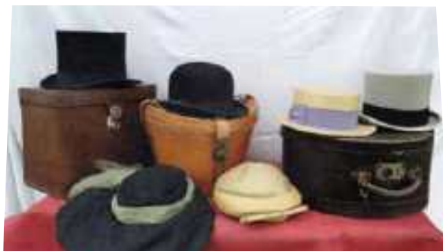
Cilindri, bombette e cappellini

Oggi racconta il suo mondo a Sermidiana identificandosi con il Gruppo Italiano Attacchi, un'Associazione Sportiva Dilettantistica, che opera a livello nazionale per "diffondere la cultura e la tradizione degli Attacchi, per mantener desta la passione per il cavallo carrozziere, per aumentare il numero dei praticanti dello sport delle redini lunghe, e per contribuire a far conoscere e salvaguardare il patrimonio di carrozze d'epoca esistente in Italia".