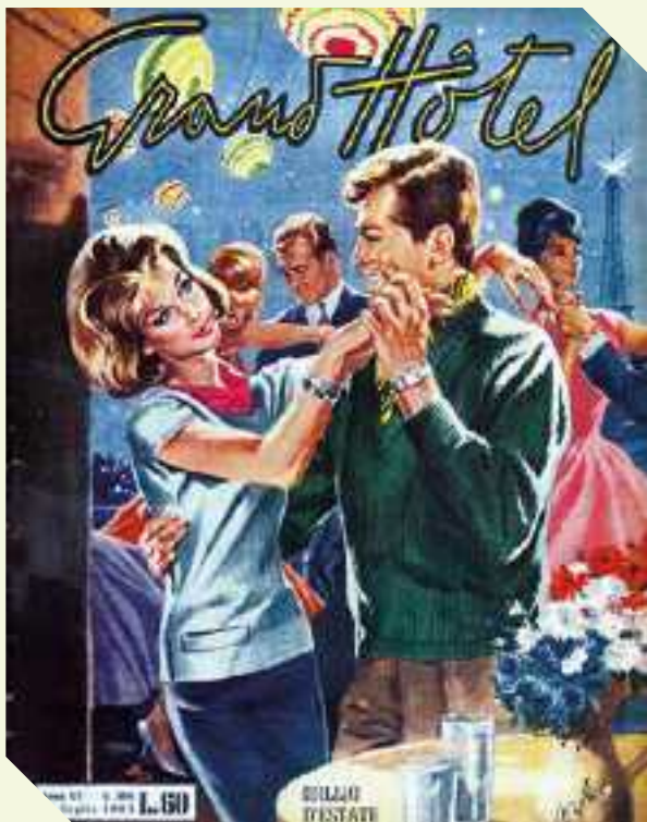
Una balera anni '50- Festa da ballo GRAND HOTEL 24 LUGLIO 1965

stratore, (era di gran moda il "geloso"). Si preparavano le scalette delle canzoni con brani prevalentemente "lenti". Ogni tanto si creava un momento di intervallo, per fumare qualche sigaretta o bere qualche bibita gassata. Le ragazze del paese in genere chiedevano il permesso ai genitori per andare alla "festina", e arrivavano in bicicletta. Quelle che abitavano distanti le si andava a prendere con la macchina. qualche ragazzo diciottenne si faceva prestare dal proprio babbo. A volte, complice il "ballo del mattone", nascevano coppie che con gli anni sono diventate belle famiglie. Ovviamente si fa il confronto tra come ci si divertiva allora e come si divertono i ragazzi di oggi: due modi molto differenti, anche se tanti giovani di oggi, pur non organizzando le "festine", riescono comunque a trovare un loro modo per divertirsi in compagnia.