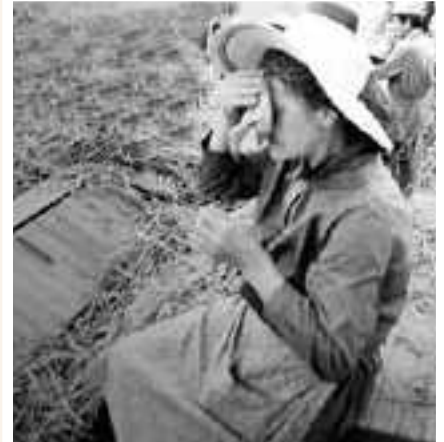
Donna con cappello di paglia a larghe falde- capela ad paja. primi anni '50

In piena estate le lavoratrici dei campi si riparavano dal sole indossando la "capela 'd paja", un copricapo a larga tesa assai leggero, indossato magari sopra il fazzoletto annodato sotto la gola. Anche la "capèla" era tenuta ferma con un elastico sotto la gola. Quando si guardano vecchie foto di donne al lavoro nei campi o nelle risaie si notano subito le grandi "capeli" che coprono la testa durante lavori pesanti svolti sotto il solleone magari a schiena curva in acqua. Quando tornavano dal lavoro nei campi ed erano in bicicletta, "la capela" che portavano in testa era tenuta ferma avvolta dal fazzoletto nero annodato sotto la gola, per evitare che, con una folata di vento, potesse volare sulla strada o nel fosso.