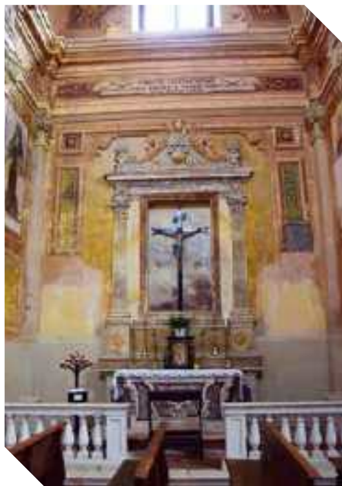
L'ALTARE DEL CROCFISSO