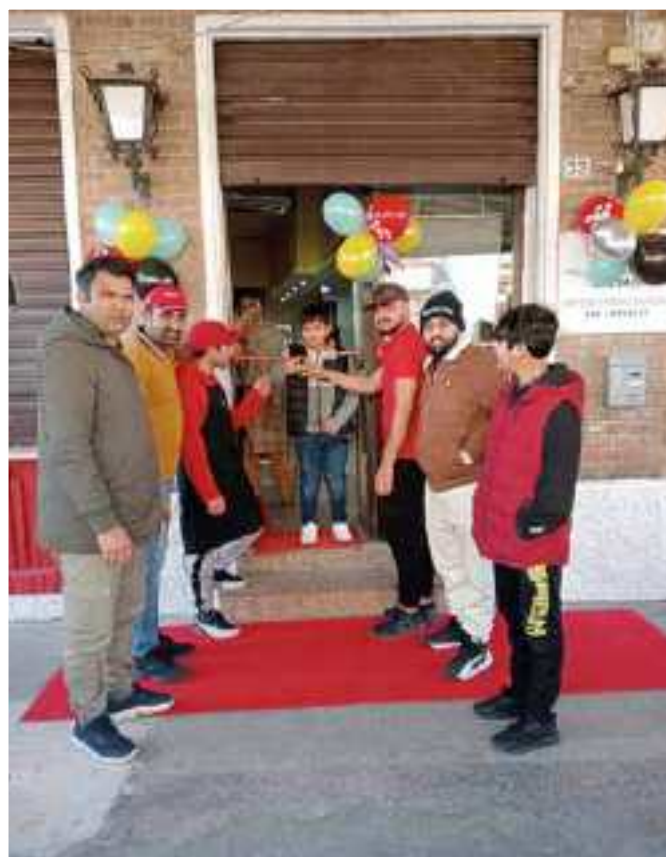
TAGLIO DEL NASTRO DELLA PIZZERIA KEBAB IN VIA 29 LUGLIO '48, LA FOSSA, A SERMIDE

Ha riaperto il bar con l'insegna Drink and food, ex storico bar-tabaccheria della