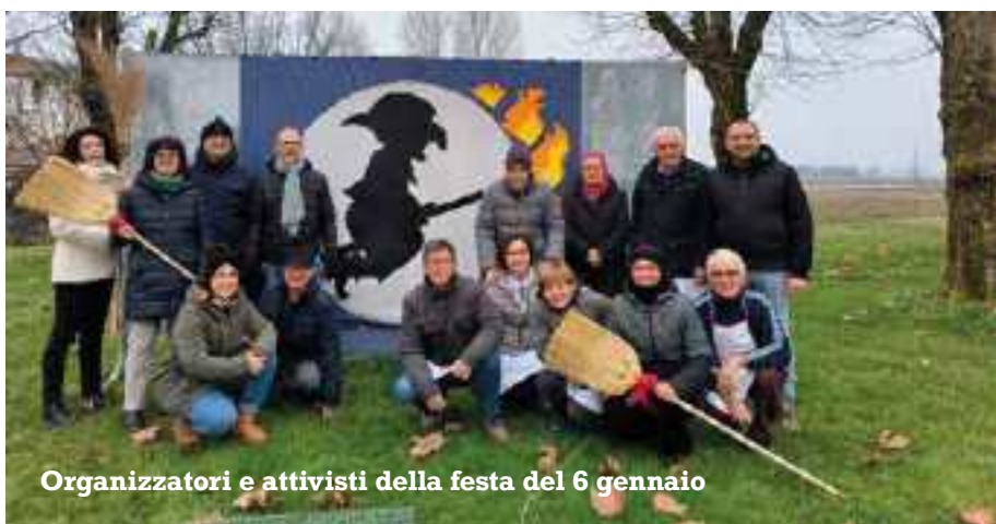
Organizzatori e attivisti della festa del 6 gennaio