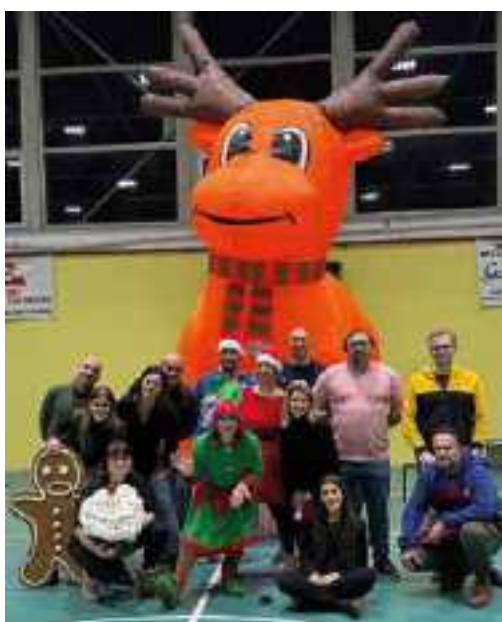
pro loco sermide

soddisfazione per queste graditissime iniziative: "Tutto il ricavato va subito a sostenere le decine di progetti a favore di persone in difficoltà di ogni età, a partire dai bambini. Scuole, dopo scuola, sport sul territorio e tante altre iniziative che riusciamo a mettere in campo soltanto grazie alla partecipazione delle persone del territorio, che con grande generosità sostengono le iniziative che mettiamo in pratica da oltre 27 anni. A loro va la nostra gratitudine e il nostro applauso"