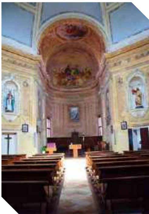
L'INTERNO DELLA CHIESA

particolare preziosità ma conferiscono un decoro importante per il mondo rurale in cui è inserita la chiesa. I quadri di maggior valore sono dati dalla Natività con Sant'Anna e Maria Bambina (di metà '800), situato a guisa di pala d'altare nell'abside, e due quadri ricollocati a lato del portale, recentemente recuperati dalla restauratrice locale E. Malagò. Gli arredi sono di arte povera ma originari di questo luogo di culto.