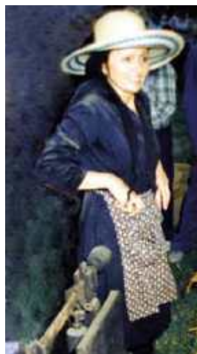
Donna con il classico "Grunbial"- anni '50

pollaio. I colori e le tinte della stoffa per questo abito erano generalmente scuri, sia in inverno che d'estate. Cambiava soltanto il tipo di stoffa: pesante quello invernale, leggero e colorate per quello estivo. Come si diceva, il "grunbialòn" veniva indossato al mattino presto e riposto alla sera prima di coricarsi. Non era un abito elegante, ma era comodo con due capienti tasche sui fianchi utili per tante necessità o evenienze, specialmente quando la rasdora doveva portare in casa qualcosa da usare in cucina o altro. Veniva confezionato con maniche lunghe, piccolo bavero al collo, bottoni ed asole sul davanti, lungo fino al polpaccio.