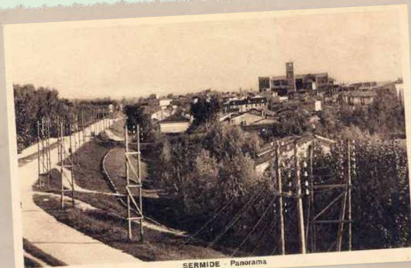
SERMIDE - Panorama

Le classi di scuola elementare erano ventisette. Funzionava la Biblioteca Popolare comunale, la Biblioteca popolare Circolante, la scuola di musica, la scuola femminile di lavoro.