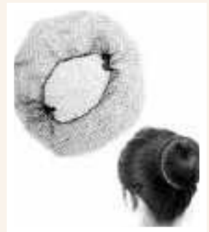
Retina in nylon per capelli - fine anni '50

Anche queste erano utili per avvolgere i capelli quando le donne lavoravano sia in casa che fuori. La retina veniva indossata generalmente dalle donne anziane quando arrotolavano i capelli dietro la nuca con la forma che preferivano. Erano molto molto leggere, di colore nero, quasi invisibili per le donne more. Per capelli bianchi vi erano retine di colore grigio chiaro. Erano fatte a forma di cuffie, con un piccolo elastico perimetrale che le teneva ferme mantenendo i capelli sempre ben aggiustati per l'intera giornata.