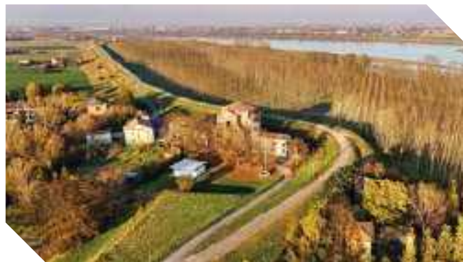
LA POSIZIONE LIMITROFA DI QUATRELLE

Le campane erano ferme da più di trent'anni, sostituite dall'impianto automatizzato negli anni '80. Ma qualcosa stava cambiando! Terminata la ristrutturazione della chiesa, nel 2022, dopo il terremoto del 2012, la Soprintendenza diede il via libera per il suono delle campane a corda, ancora esistenti nel piccolo campanile. Con un grande sforzo economico furono restaurate. Ma chi poteva suonarle? A questo