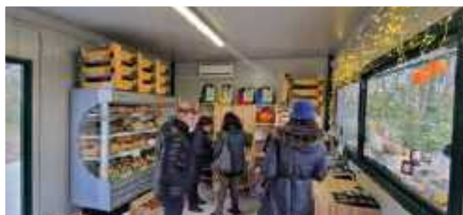
Momenti della festosa inaugurazione della CASSETTA ortofrutta di qualità a KM 0

Il nuovo punto vendita commercializzerà, oltre ai prodotti dell'azienda Nadalini e dell'area mantovana, anche quelli dei soci di OP Sermide Ortofruit attivi in altre province aprendo così la vendita a frutti