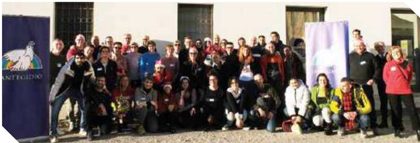
COMUNITÀ DI SANT'EGIDIO DI ROVIGO

“Ho imparato l'accoglienza, il rispetto, l'ascolto”