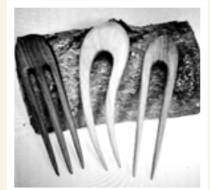
Forcine per capelli - guceti - metà anni '50

Forcine per capelli- Erano accessori di legno noce o di ferro con forma classica a due o tre punte, lucidate con finissima carta vetrata. Di fattura molto elegante e semplici da usare, servivano per tenere uniti i capelli una volta arrotolati o a forma di "cucugnél o cunsér"-Erano piuttosto resistenti per un uso quotidiano.