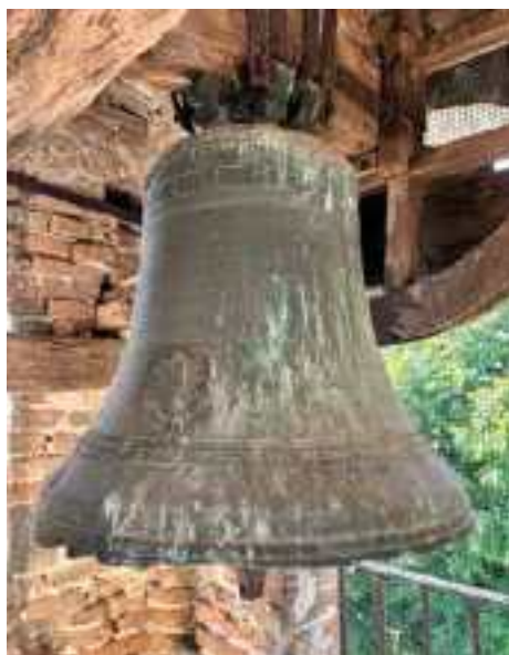
Cella campanaria di Quatrelle