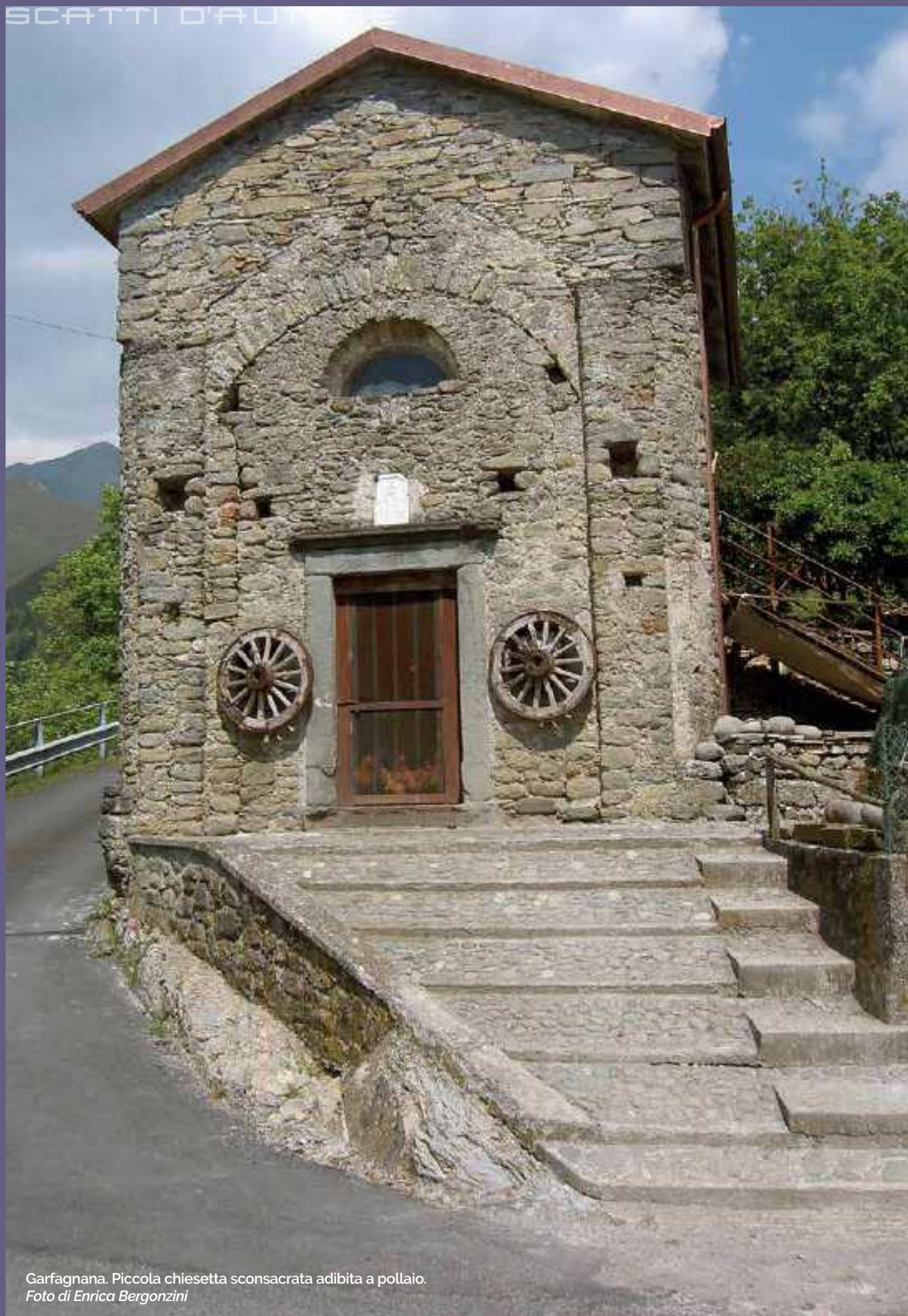
Garfagnana. Piccola chiesetta sconsacrata adibita a pollaio.