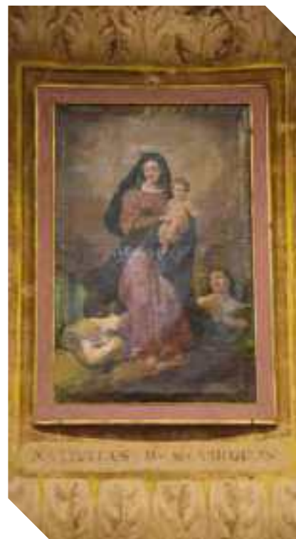
IL QUADRO DELLA NATIVITÀ CON SANT'ANNA E MARIA BAMBINA