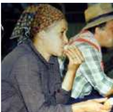
Donna con fazzoletto copricapo - fine anni '50

Le giovani donne sposate che avevano capelli lunghi e vaporosi li coprivano con fazzoletti chiari o colorati durante i lavori di casa o fuori, per tenerli uniti e riparati dalla polvere e dal sole. In chiesa secondo una antica consuetudine, per rispetto del luogo, le donne si coprivano il capo con la veletta di pizzo scuro abbastanza lunga, fatta in casa o acquistata in negozio. Nel tempo, anche il fazzoletto da testa, "fasulé d'in cò", diventava un accessorio elegante di seta o di finta seta, anche per sostituire il velo in chiesa. Era quasi un ornamento. Le donne più anziane, quando svolgevano mansioni o lavori diversi, in casa o in campagna, indossavano invece i classici fazzoletti annodati sotto la gola o dietro la nuca.