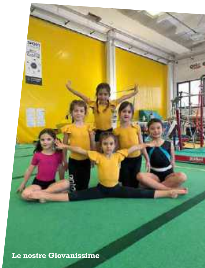
Le nostre Giovanissime

Una grande occasione di confronto e crescita per le nostre ginnaste, che a breve intraprenderanno le loro prime esperienze di competizione. Ora non bisogna far altro che continuare a mettersi in gioco, come già stanno facendo le atlete con maggiore esperienza in vista della nuova stagione di gare che le aspetta. Un grande in bocca al lupo a tutti i nostri ginnasti per questo nuovo anno!