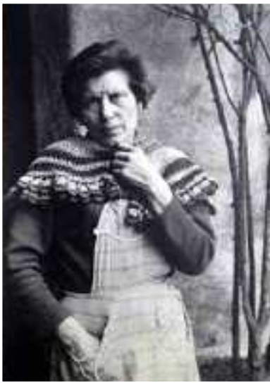
Donna con mantellina fine anni '50

realizzato in casa con lana lavorata ai ferri o all'uncinetto dalla signora anziana. Il colore variava a seconda dei gusti, con tinte spesso ricercate nella carta colori "vegetali o casalinghe". In qualche caso la mantellina fungeva da scialle -coprispalle. Poi verso la metà degli anni '60 venne sostituita dalle maglie di lana "da' t'sora", variamente abbottonate, scure, più idonee per nascondere eventuali macchie di sporco.