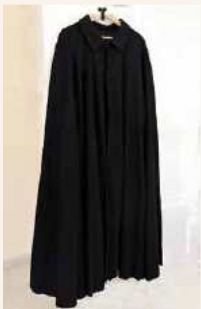
Tabarro primi anni '50

Parliamo di un mantello a ruota da uomo con origini antiche. Era realizzato in panno grosso e pesante, solitamente di colore nero, aveva un solo punto di allacciatura sotto il mento e veniva tenuto chiuso buttando un'estremità sopra la spalla opposta, in modo da avvolgerlo intorno al corpo. Vi erano due modelli: quello classico lungo fino al polpaccio, e quello, un po' più corto, usato per andare a cavallo o in bicicletta.