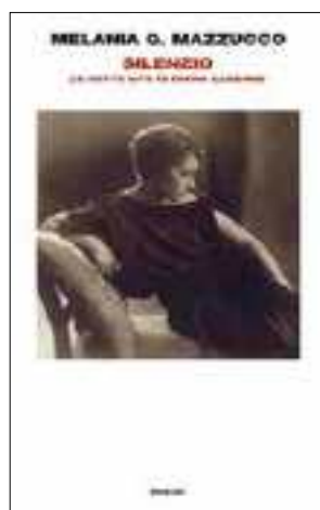
SILENZIO: le sette vite di Diana Karenne Melania G. Mazzucco ed. Einaudi

orrori, all'unica sopravvissuta di una famiglia ebrea deportata e sterminata dai nazisti, alle vicende di un celebre pianista e a quelle di un assassino senza scrupoli, alle subdole manovre di un insospettabile pedofilo e al tifo sfegatato per la locale squadra di calcio, il FC Gueugnon.