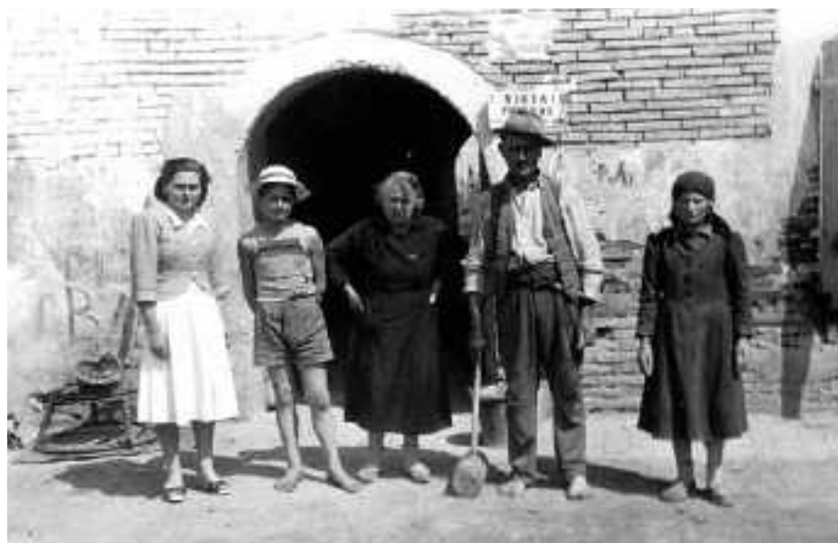
LA FAMIGLIA BOTTURA

→ L'Associazione Amici di Sermidiana A.p.s., proseguendo nel viaggio attraverso il tempo per riscoprire e valorizzare le storie che ci legano alle persone che ci hanno preceduto, ha in progetto di allestire, durante la fiera di giugno 2025, una mostra fotografica riguardante gruppi famigliari del novecento sermidese.