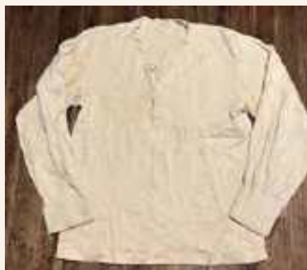
Camicia con "fastin" al collo fine anni '40

Era l'indumento di tessuto leggero, tela o flanella, che usavano gli uomini nel periodo primavera estate. Poteva essere confezionato dalle donne di casa con la tela ricavata dal telaio usando il filo ottenuto dalla canapa, magari coltivata nel podere. Era un indumento semplice che poteva avere il colletto per portare la cravatta, oppure un piccolo "fastin", fascia attorno al collo.