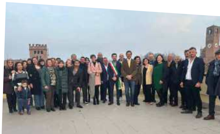
Dopo i lavori di riqualificazione, un momento conviviale per ringraziare tutti coloro che hanno collaborato