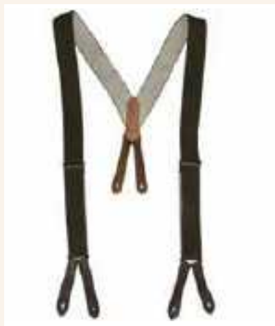
Bretelle - "tirachi" fine anni '40

Per sostenere i pantaloni del vestito bello, si usavano le bretelle, "tirachi", strisce di stoffa o di tessuto, regolabili nella lunghezza con apposite fibbie sbloccabili, agganciate alla fascia in cintura con bottoni.