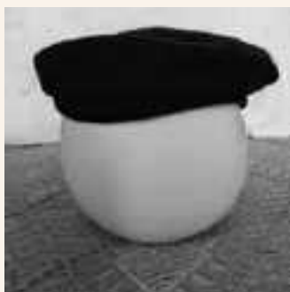
Basco "chiribiri" anni '50

Si tratta di due copricapo di forma e uso differenti. Il primo era il copricapo che veniva indossato dagli uomini nei giorni festivi, quando si recavano in piazza, al mercato o in "caffè", o in qualche altra occasione dove il cappello fungeva da "complemento" all'abito buono. Il cappello poteva essere di feltro, di paglia, di seta, di velluto, di pelle. Le forme erano diverse, ma vorrei riferirmi a quello più popolare, ovvero il cappello di panno a falda o tesa larga, di colore scuro. Il basco o "chiribiri", berretto senza tesa a forma di cupolino schiacciato formato da un panno di feltro, con la particolarità di possedere sulla sua sommità una sorta di piccolo picciolo, chiamato "pirillo. Mi riferisco a quello che generalmente veniva indossato come copricapo specialmente nel periodo autunno - inverno dagli uomini che accudivano il bestiame nella stalla.