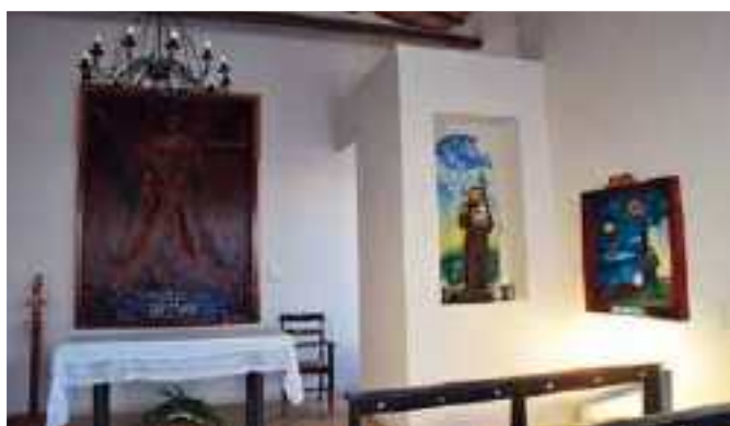
LA CAPPELLA DI PORCARA CON LE OPERE DI ENRICO BRESCIANI: "ASCENSIONE" E "ANNUNCIAZIONE"

sul masso attaccato all'albero è riportato il principio di indeterminazione di Heisenberg \Delta X \Delta P \geq \hbar/2 ; nella parte alta, tra le foglie dell'albero, un "buco nero"; infine, la mappa delle anisotropie, in alto a sinistra, visualizza le radiazioni fossili della nascita dell'universo. La mappa è contornata da una cornice nera in cui si può scorgere il volto di Dio. L'immagine tradizionale dell'Angelo si trova fuori dal quadro." (ndr)