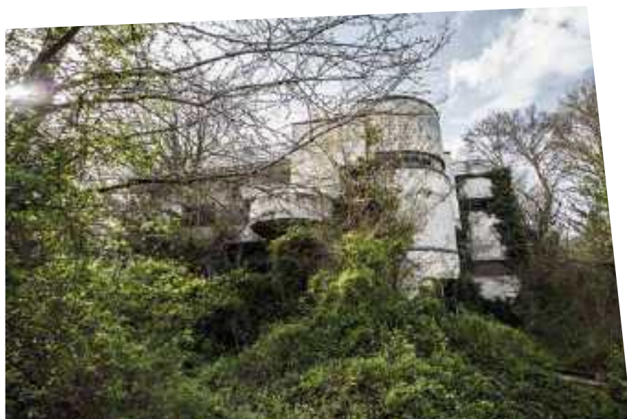
Villa duplex oggi

Pietro Lingeri). L'edificio viene citato da Edoardo Persico sul numero 7 del luglio 1933 di Casabella in quanto importante testimonianza di come "(...) il gusto moderno vada diffondendosi in Italia a tal punto da essere seguito nelle opere di più comune utilità (...), abbiamo forse bisogno più di queste fabbriche svelte e modernissime che di complicate soluzioni estetiche: è un modo di accostarsi ai bisogni di tutti e di creare realmente una esigenza del nuovo stile architettonico".