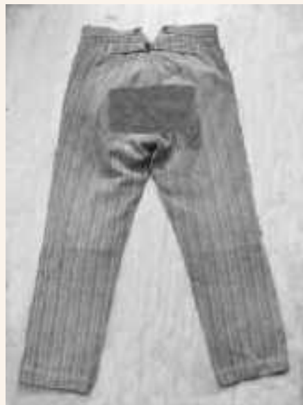
Pantaloni da lavoro fine anni '40

Questi indumenti, per i quali l'eleganza non contava, generalmente venivano confezionati in casa con la stoffa solitamente acquistata nel giorno di mercato oppure dal "marcantin", venditore ambulante di merceria che in un giorno preciso ogni settimana passava per le corti. Nelle famiglie con maggiori disponibilità economiche venivano acquistati in negozio. Qualche volta i calzoni del vestito bello, oramai lisi e usati da parecchi anni venivano indossati per lavoro. I pantaloni da lavoro erano sempre lunghi sia in estate che in inverno per meglio proteggere le gambe. All'occorrenza venivano riavvolti fin sopra il polpaccio quando si doveva svolgere un lavoro in posti umidi a ridosso di fossi e scoline. Una cordicella di canapa, annodata alla vita, spesso fungeva da cintura.