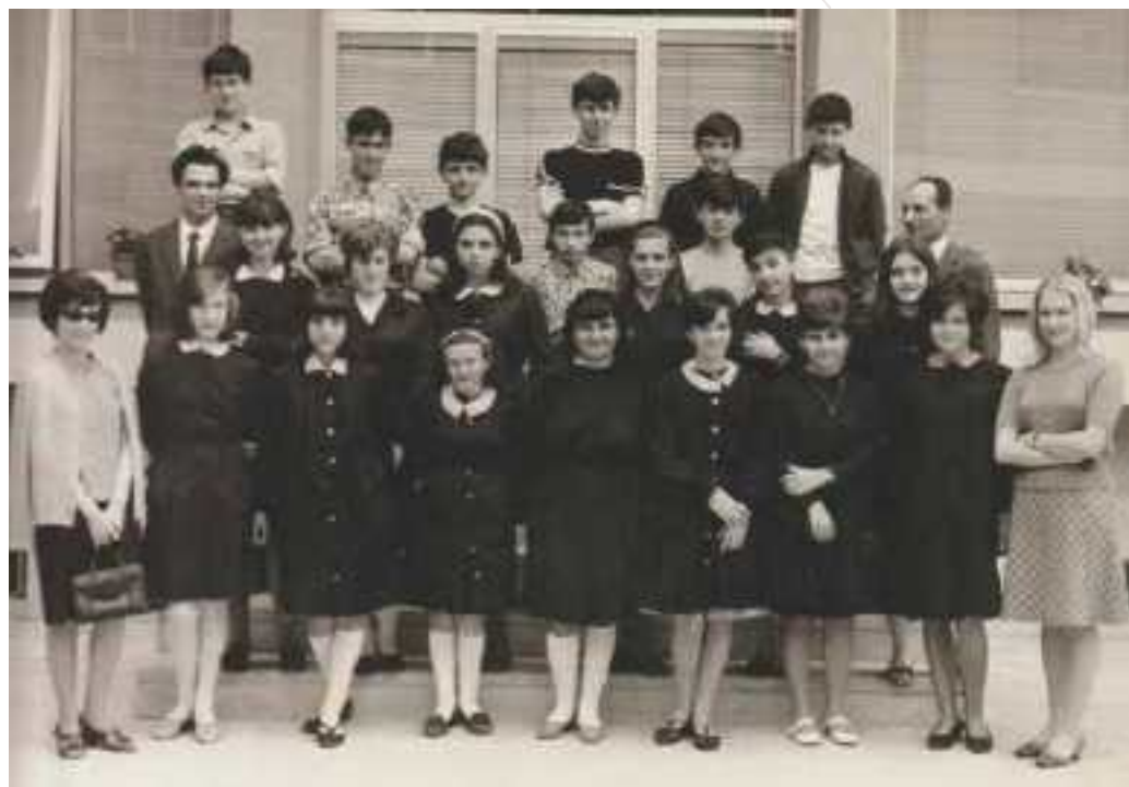
SERMIDE, TERZA MEDIA 1966-67