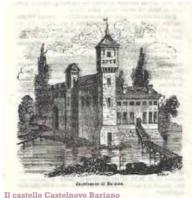
Il castello Castelnovo Bariano

A parere del compianto M° William Moretti (che abitava proprio in via Rosta) e del prof. Paolo Brenzan, noto cultore di storia locale, il termine ROSTA significa ARGINE in senso lato. L'attuale via Rosta nell'alto medioevo collegava il castello di Castelnovo Bariano (in zona ex fornace Meneghini) alla località Torricella (dove sorgeva una torre di guardia). Era un argine con funzioni di strada arginale tipo via Spinea, via Argine Valle, via Vegri, costruita per proteggere da alluvioni o acqua risorgiva in zone acquitrinose e soggette periodicamente alle piene (acqua risorgiva e fontanazzi) e alle rotte del Po. Detti argini erano l'unica via di comunicazione terrestre, quando si navigava sui canali d'epoca. Parallelo alla Rosta scorre da sempre un profondo fossato che nasceva/nasce al castello e finiva/finisce nel Perenno a Torricella. Le bonifiche e i nuovi canali irrigui dell'800 resero fertili queste terre ma le strade arginali, asfaltate, sono rimaste, svolgendo la stessa odierna funzione di strada locale, come nei secoli passati.