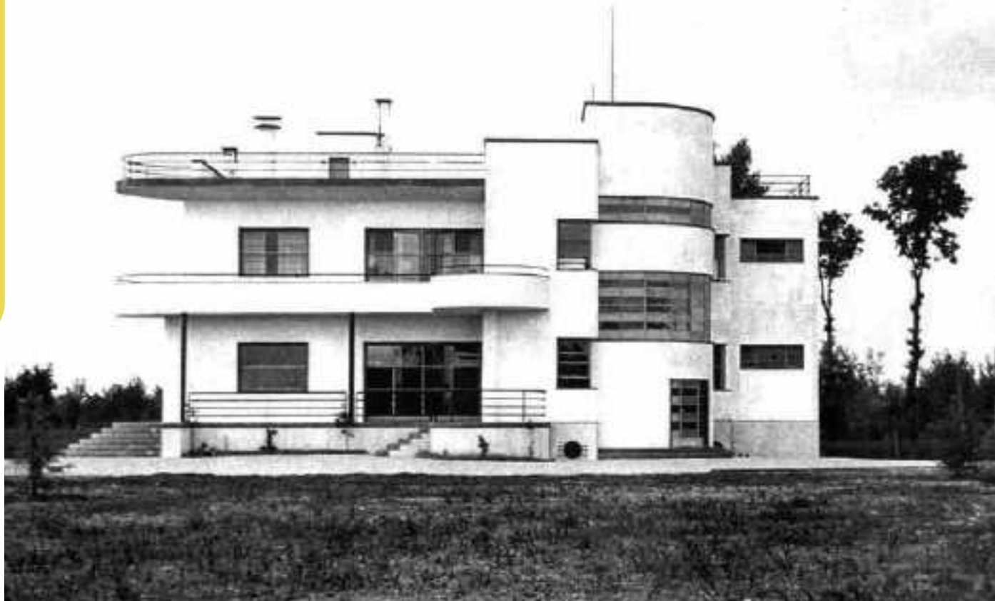
Villa duplex Sermide 1931-39 - L'angolo con l'ingresso dell'appartamento al piano rialzato (in primo piano la scala rivestita "a oblò" della cantina). In copertura, s'intravedono altri elementi nautici della costruzione (cabina e camini)

(pag.486 "Renzo Zavarella 1900-1988 architettura design tecnologia" prof. Davide Allegri)