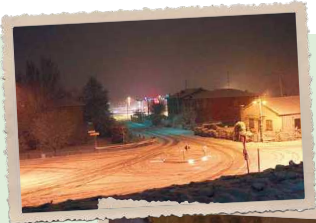
Rotonda Via Argine Po- Via 24 aprile