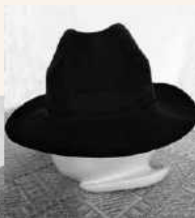
Cappello a tesa larga anni '50