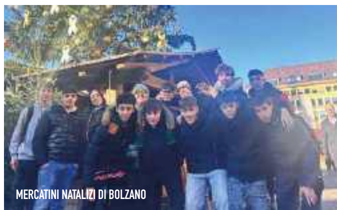
MERCATINI NATALIZI DI BOLZANO