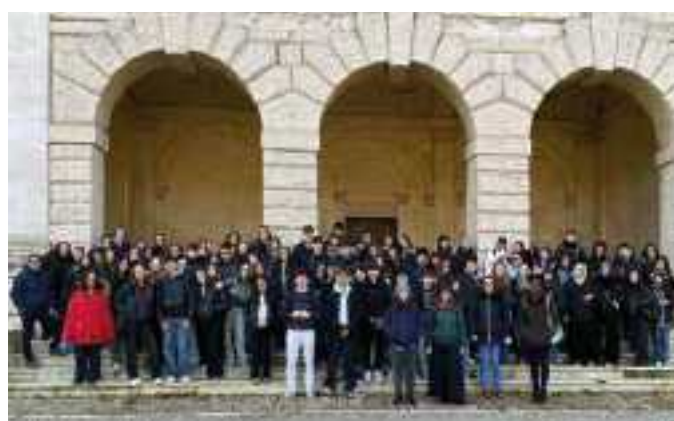
TEATRO ARISTON - SPETTACOLO IN LINGUA FRANCESE