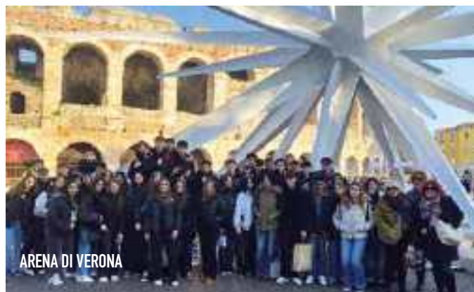
ARENA DI VERONA

Esperienze didattiche significative che hanno permesso a studenti e studentesse di trascorrere momenti altamente formativi e di importante socialità.