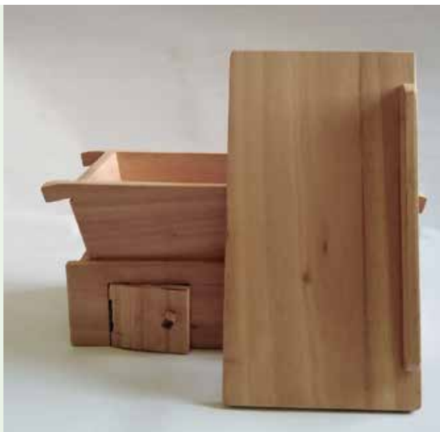
Madia e Tagliere - (Meša e tulér)

nell'azienda è apprezzato per le sue capacità di giovane artigiano che guarda al futuro tenendosi sempre informato e al passo con i tempi in continua evoluzione, installando nel laboratorio macchine sempre più moderne, con una particolare attenzione a svolgere l'attività in completa sicu-