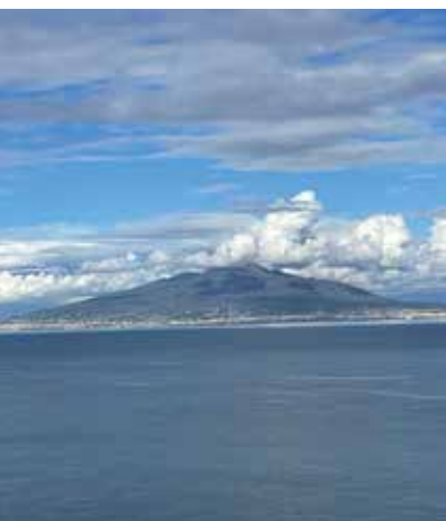
SULLO SFONDO SEMPRE LUI: IL VESUVIO "A MUNTAGNA"!

ciò che conferisce a tutto lo spettacolo una nota di grazia incomparabile è lo sfondo, in cui s'incornicia il Vesuvio coi suoi dintorni.» Nel Viaggio in Italia -1787. ■