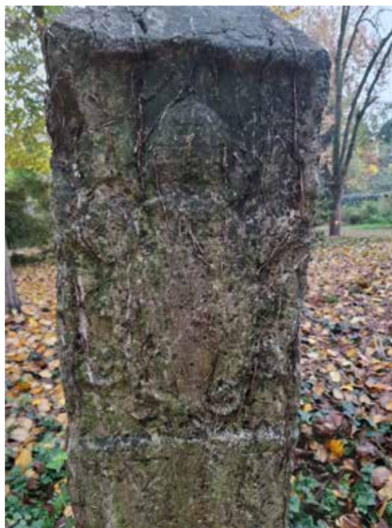
IL CIPPO CON LO STEMMA PONTIFICO

Il rilievo di campo ha permesso di documentare lo stato di altri manufatti consecutivi (nn. 48, 49, 50, 51 e 52), appartenenti alla "coda" del tracciato meridionale del confine; area coincidente con quello che nel Settecento era il "corridoio franco" tra i due Stati, l'antica via di collegamento a doppio toponimo Via Ferrarese-Via Imperiale, lungo la quale transitavano uomini, merci e notizie tra la Lombar-