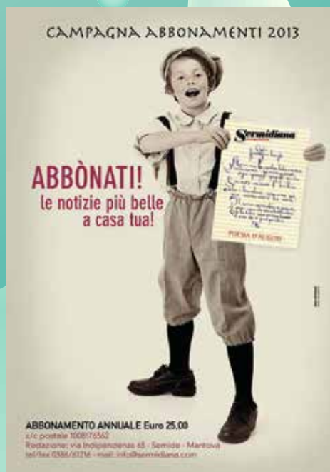
2013 GRAFICA DI ENRICA BERGONZINI