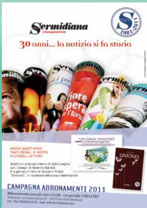
2011 GRAFICA DI ENRICA BERGONZINI