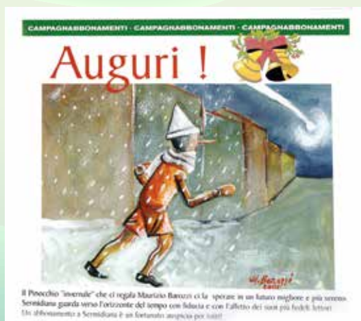
2002 ILLUSTRAZIONE DI MAURIZIO BAROZZI