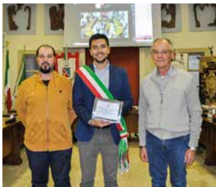
AGRICOLA RICAMBI SNC

Agricola Ricambi Snc - GAM Service - Trattoria Cavallucci