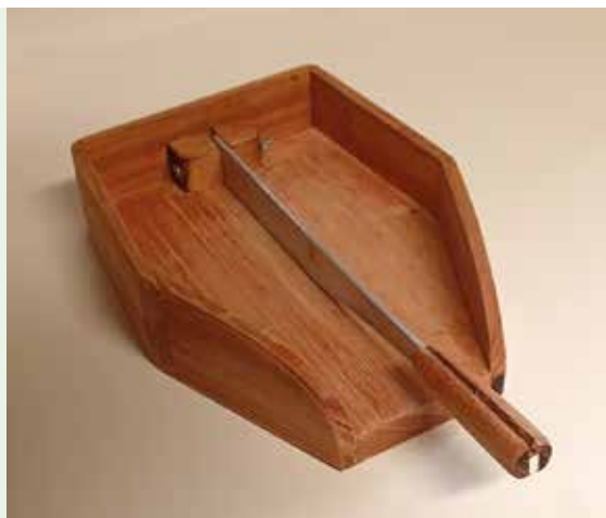
Tagliere per il pane - Tajer da pan