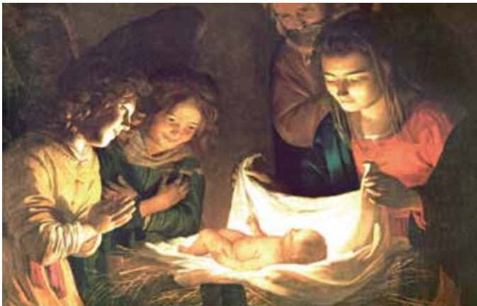
Adorazione del bambino, dipinto di Gerrit van Honthorst, c. 1620