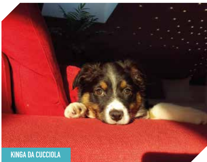
KINGA DA CUCCIOLA

Perché la calma non si comanda, si costruisce insieme. Come passare da uno stato di agitazione ad uno di tranquillità.