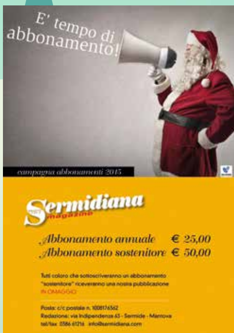
2015 GRAFICA DI ENRICA BERGONZINI