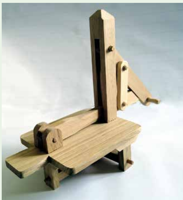
Gràmola per pane (Gràmula)