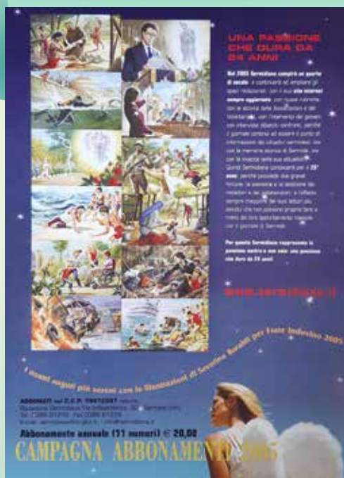
2005 ILLUSTRAZIONE DI SEVERINO BARALDI