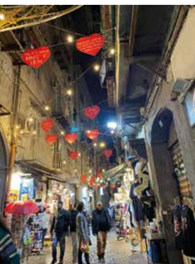
UNO SCORCIO DI VIA SAN GREGORIO ARMENO GIÀ IN VERSIONE PRE-NATALIZIA

Via San Gregorio Armeno è conosciuta in tutto il mondo come "la Via dei Presepi", per la presenza delle antiche botteghe in cui si scolpiscono i personaggi del presepe napoletano. Il periodo con maggiore ricchezza espositiva è quello natalizio ma la via può essere visitata tutto l'anno, dato che quasi tutte le botteghe sono sempre aperte ed esibiscono i loro prodotti. Nei mesi pre-natalizi la strada è meno gremita di gente, si possono quindi ammirare gli artigiani a lavoro e osservare le loro creazioni con maggior calma. I nostri viaggiatori ci sono andati a inizio novembre inviandoci alcune foto!