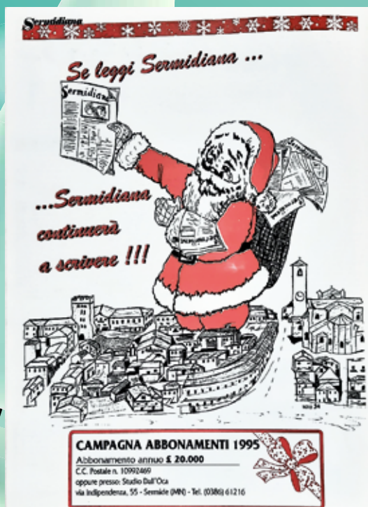
1995 ILLUSTRAZIONE DI MAURIZIO SANTINI

“FINO A QUANDO I SERMIDESI LEGGERANNO SERMIDIANA CONTINUERÀ A SCRIVERE” È SEMPRE ATTUALE