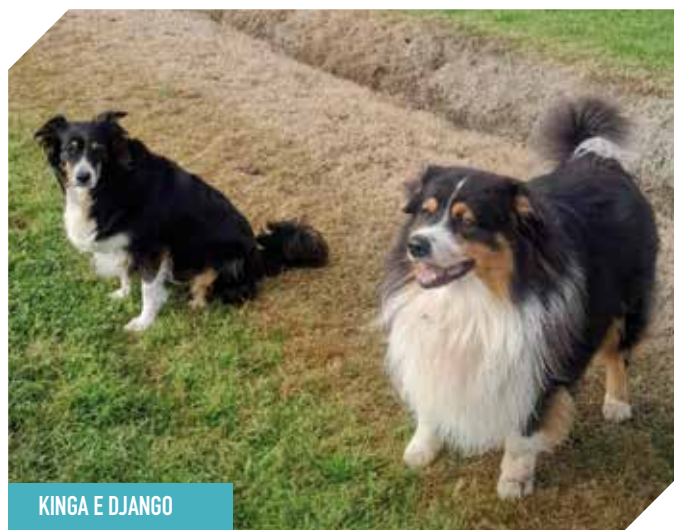
KINGA E DJANGO