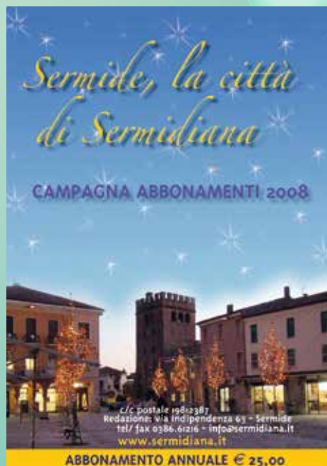
2008 GRAFICA DI ENRICA BERGONZINI