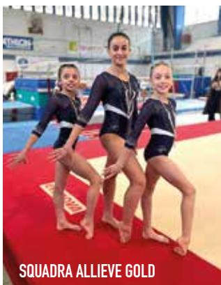
SQUADRA ALLIEVE GOLD