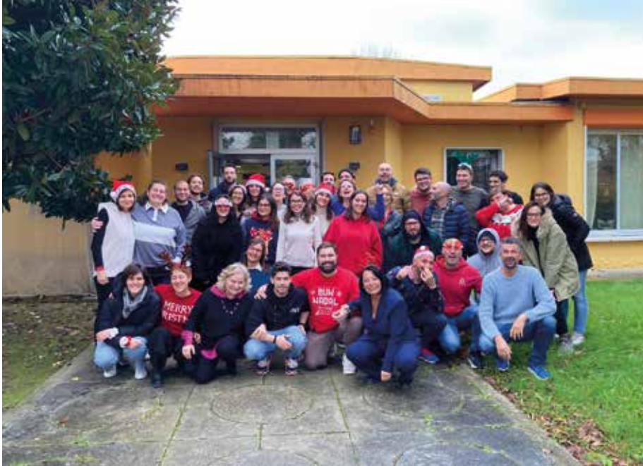
Un bel gruppo di operatori della Coop sociale Il Ponte

grande valore alla formazione ed alla supervisione continua degli operatori, in linea col senso di appartenenza ai valori della coop sociale.