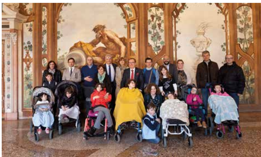
Foto di gruppo delle famiglie con le loro bambine a Palazzo Ducale