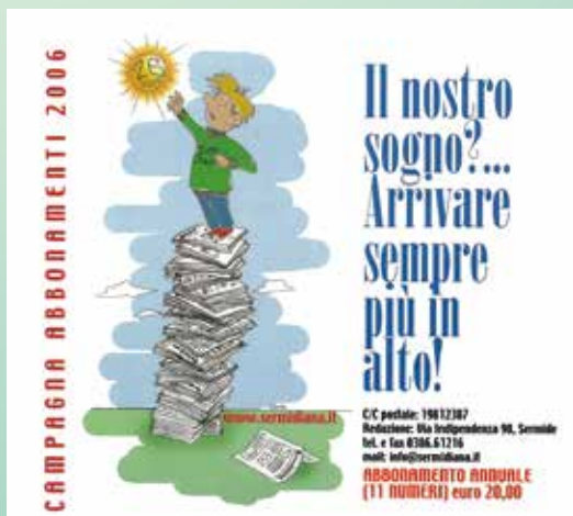
2006 ILLUSTRAZIONE DI CARLO COSTANZELLI