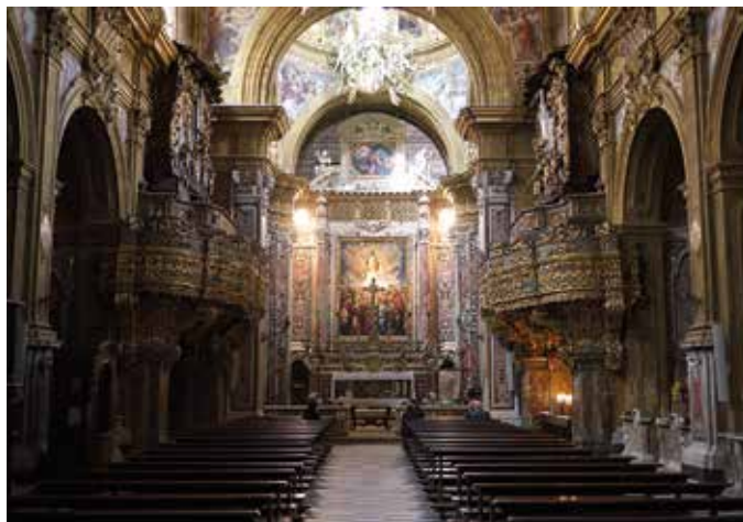
L'INTERNO DELLA CHIESA DI SAN GREGORIO ARMENO

❖ La via dei presepi non è fatta soltanto di negozietti e bancarelle ma è arricchita da una bellissima chiesa, quella di S. Gregorio Armeno nota anche come chiesa di Santa Patrizia. Una chiesa monumentale che, assieme all'adiacente complesso monastico, è uno degli edifici religiosi più antichi e importanti della città, un esempio di stile barocco napoletano con un'imponente