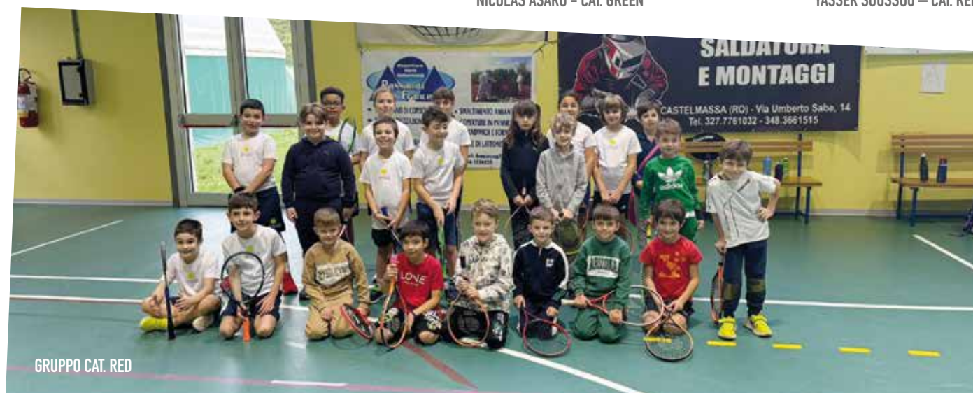
GRUPPO CAT. RED