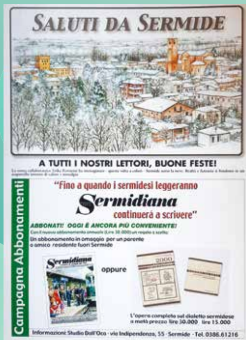
2001 ILLUSTRAZIONE DI ERIKA FERRARINI