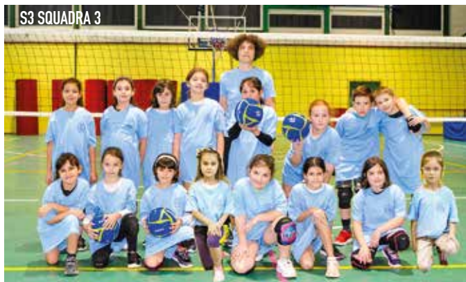
S3 SQUADRA 3