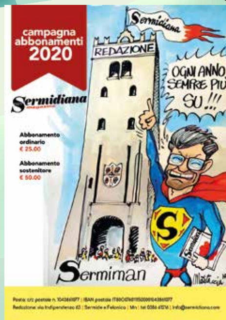
2020 ILLUSTRAZIONE DI GIORGIO SERRA "MATTACCIA"