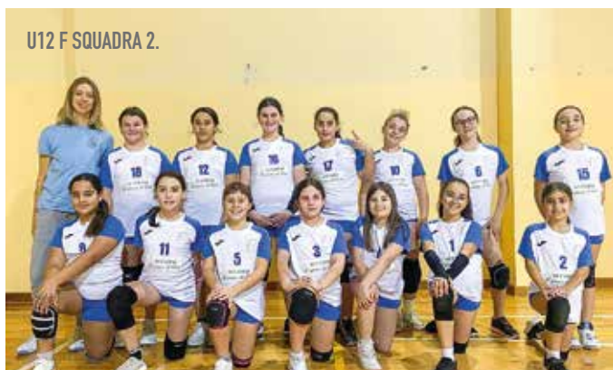
U12 F SQUADRA 2.

Avvio abbastanza laborioso dovuto al numero di gare da disputare tra sabato e domenica ed un unico impianto a disposizione, il palazzetto dello sport di Sermide, (la palestra di Carbonara è in manutenzione), però abbiamo iniziato. Vogliamo ringraziare pubblicamente tutte le ditte che hanno offerto il loro supporto finanziario per affrontare questa sfida, senza di loro sarebbe impossibile, tra l'altro, come incoraggiamento alla disciplina sportiva, la federazione FIPAV ha pensato bene di raddoppiare tutti i contributi da versare da parte delle