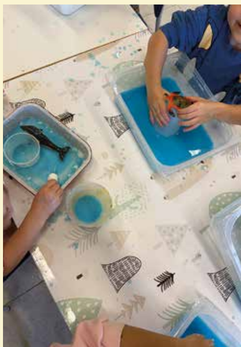
Attività di manipolazione in piccolo gruppo (sc. dell'Infanzia di Felonica)

all'Ufficio Scolastico Provinciale, che provvede all' assegnazione dei docenti di sostegno: non sempre essi sono assegnati in numero sufficiente a coprire i reali bisogni per cui la Scuola chiede aiuto ai Comuni che incaricano le Cooperative Sociali Onlus nel fornire Educatori professionali a completamento dei docenti mancanti nella gestione degli alunni con necessità di supporto intensivo. La realtà scolastica dell'IC è molto bisognosa, ma anche molto fortunata, perché i Comuni coinvolti sono molto recettivi e collaboranti. In particolare il nostro Comune ogni anno investe cospicue risorse in questo settore