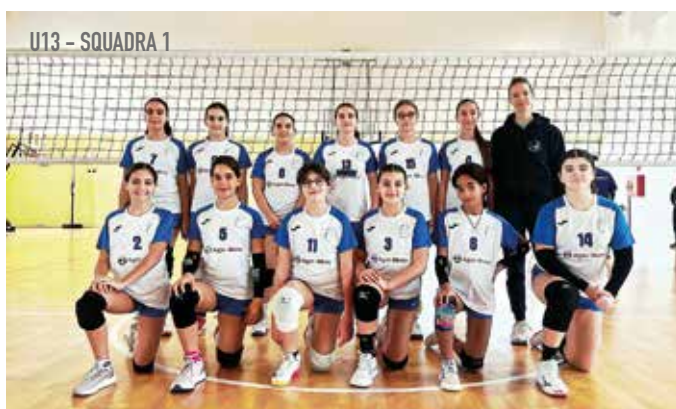
U13 - SQUADRA 1