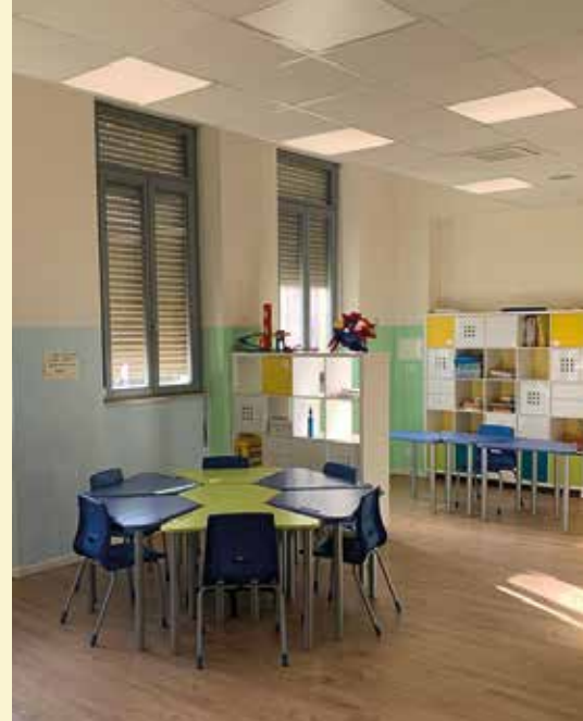
L'aula polifunzionale "Agnese" (sc. Primaria di Sermide)

A livello gestionale ed organizzativo l'area Sostegno/ Inclusione è di primaria importanza e richiede il continuo raccordo tra il DS, che dispone le direttive e le linee guida, la Segreteria scolastica e un'équipe formata da docenti dei 3 Ordini scolastici denominata Commissione BES: essa si riunisce periodicamente e si confronta ogni giorno su tutte le questioni relative a quest'area fornendo supporto a docenti di sostegno e curricolari nel gestire le situazioni problematiche, diffondere buone pratiche inclusive, formare gli insegnanti di sostegno, organizzare gli incontri dei GLO).