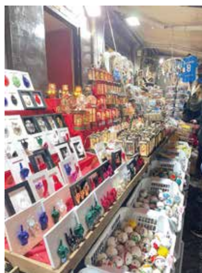
FOTO SINISTRA: UNA TIPICA BANCARELLA "MISTA" DI VIA SAN GREGORIO: DALLE STATUETTE CLASSICHE A QUELLE CHE RIPRODUCONO IRONICAMENTE PERSONAGGI ATTUALI

Il presepe napoletano si sviluppò a metà del Settecento e portò San Gregorio Armeno a diventare famosa come "via dei Presepi". Oggi è difficile rendere l'idea di quello che si incontra nella via: dalle statuette tradizionali dei pastori si arriva ai più moderni complementi "meccanici" azionati elettricamente, come mulini a vento o cascate. E accanto a vere e proprie opere d'arte, frutto del lavoro di famiglie che si tramandano il mestiere da generazioni, si trovano oggetti kitsch, come statuette di personaggi famosi dell'attualità che denotano comunque la fantasia e l'ironia dei napoletani.