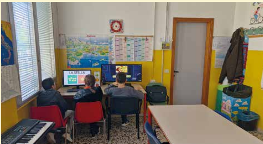
Attività nell'auletta potenziata per l'apprendimento (sc. Secondaria 1° grado Sermide)

all'Ufficio Scolastico Provinciale, che provvede all' assegnazione dei docenti di sostegno: non sempre essi sono assegnati in numero sufficiente a coprire i reali bisogni per cui la Scuola chiede aiuto ai Comuni che incaricano le Cooperative Sociali Onlus nel fornire Educatori professionali a completamento dei docenti mancanti nella gestione degli alunni con necessità di supporto intensivo. La realtà scolastica dell'IC è molto bisognosa, ma anche molto fortunata, perché i Comuni coinvolti sono molto recettivi e collaboranti. In particolare il nostro Comune ogni anno investe cospicue risorse in questo settore