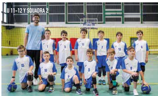
U 11-12 Y SQUADRA 2

società(!). Ma lasciamo le polemiche da parte e iniziamo a seguire il nostro percorso sportivo, ci troverete sempre al palazzetto il sabato pomeriggio o la domenica, i nostri eventi sono sempre pubblicati on line sui vari social network e quanto