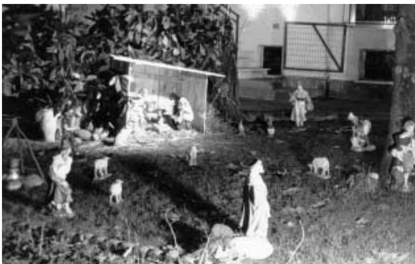
VIA F.LLI BANDIERA