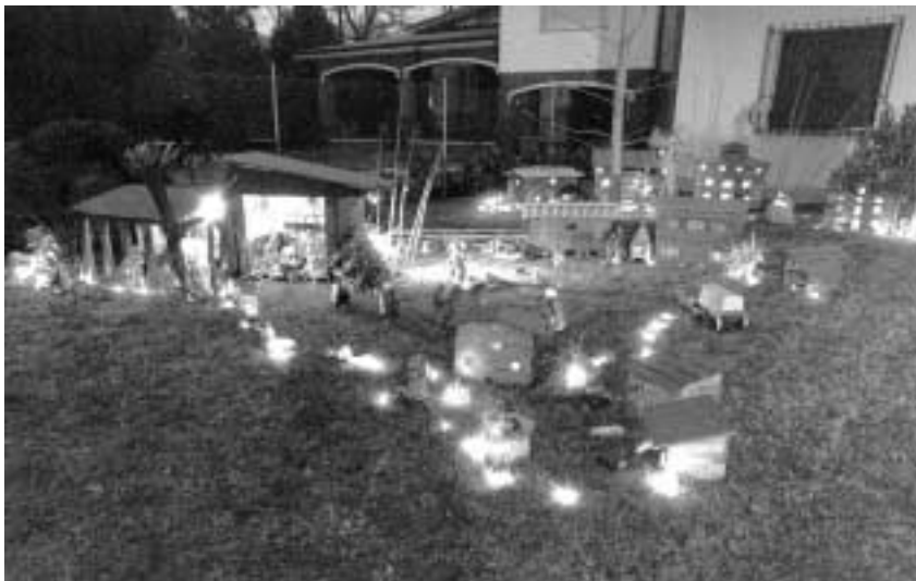
VIA S. GIOVANNI