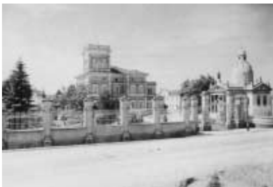
"Carbonara: Villa Bisighini. Tratta dal libro di Andreoli Marchetti Anna Maria"

La raccolta non segue un ordine cronologico, ma piuttosto per dislocazione geografica: continenti, regioni, località.