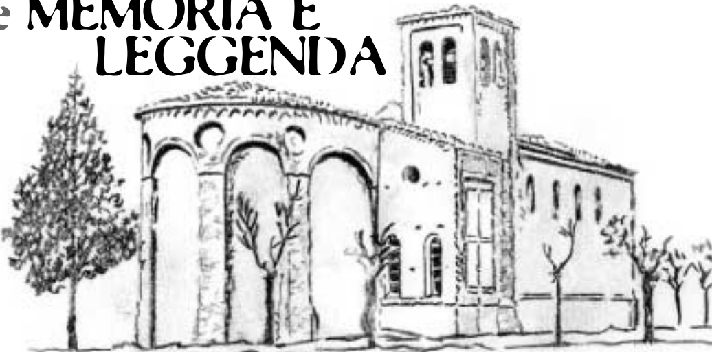
disegno di Maurizio Santini

Con il restauro degli affreschi e la fioritura di testi e saggi scientifici sull'origine della chiesa di S. Croce è come svaporata in me quell'aura mitica che l'avvolgeva fino a qualche decennio fa. Era particolarmente intrigante viaggiare con la mente di bambino nel caleidoscopio di mezze verità ogni qual volta si varcava l'entrata del tempio misterioso. Ognuno sosteneva la sua versione, basata su testimonianze orali o vaghi ricordi infantili; la mancanza di un riscontro incontrovertibile permetteva a tutti di accampare leggende sempre nuove, ignote, spesso cupe e goticheggianti, di sicura seduzione. I recenti studi hanno parzialmente abbattuto le fantasie che hanno sempre accompagnato i nostri passi felpati di curiosità fra le mura di quello scrigno fiesco. Voglio qui ricordare le storie sentite, assurde o attendibili che siano, con la minuzia mai scordata di quei narratori e il gusto puerile di tornare a credere.