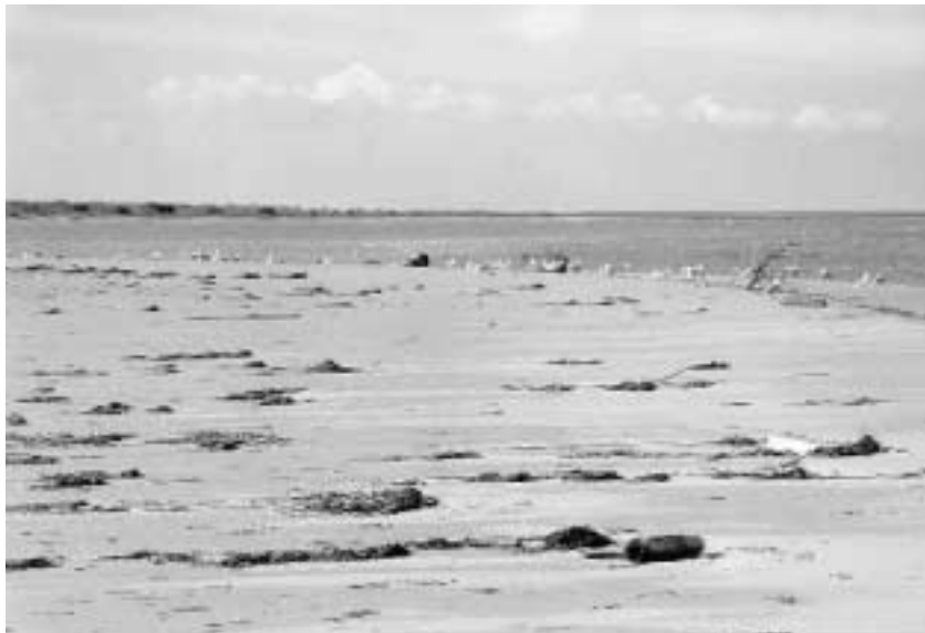
Nicola Quirico • Naturalistica