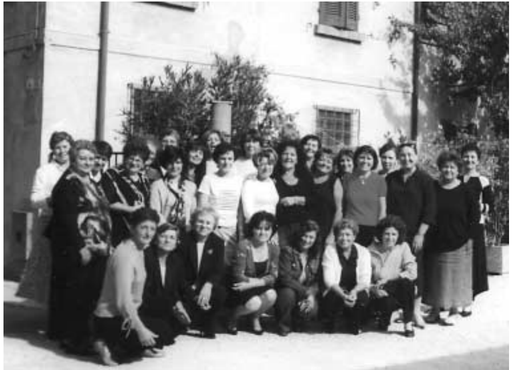
Dai banchi delle scuole elementari e medie al ristorante Cavallucci. Dopo 42 anni sono riaffiorati i ricordi di un tempo ed un augurio per il prossimo incontro.

Altra iniziativa che si vuole ricordare è il CONCERTO GOSPEL che si terrà nella Chiesa Parrocchiale la sera di sabato 20 dicembre alle ore 21.00 con il gruppo CHERYL PORTER IN THE SPIRIT, gruppo gospel rinomato che si auspica porti a Sermide il numeroso pubblico, anche da altri comuni, che ha caratterizzato le scorse edizioni del concerto.