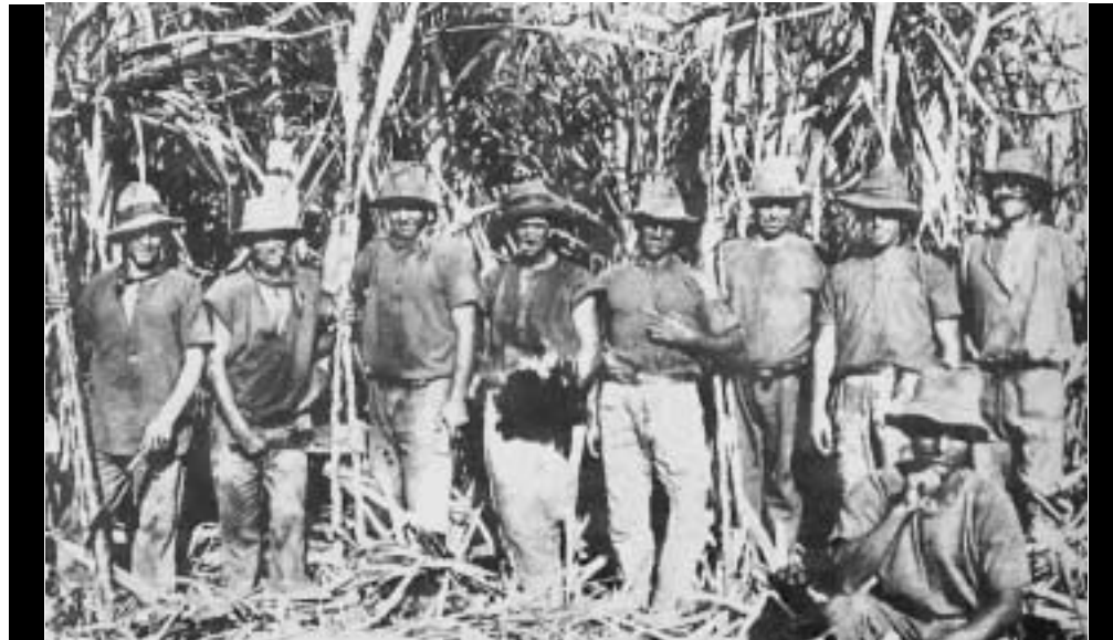
Raccoglitori della canna da zucchero

te ed altamente meritoria perché consente di recuperare e rafforzare, per noi residenti, la conoscenza di prima mano del fenomeno migratorio mantovano ed italiano in Australia del secolo scorso.