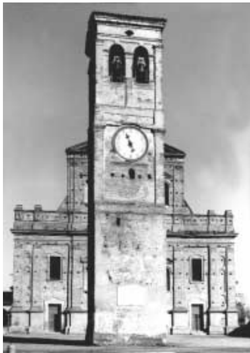
La torre tratte da una cartolina di Montrose Chiavegatti di Melara

Riguardo alla nostra torre, i documenti d'archivio ci ricordano che fu eretta a campanile solo nel Seicento, con una cupola piramidale. Per tutto il Settecento il vescovo di Ferrara chiese alla comunità di costruire un campanile nuovo, più dignitoso per l'erigenda monumentale chiesa, che però per motivi economici non si fece mai. Ancora che nel 1871 un commissario straor-