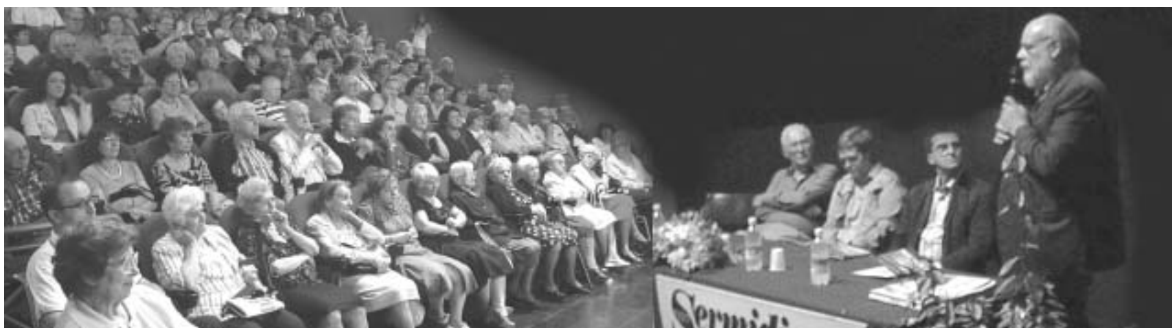
Il pubblico delle grandi occasioni alla manifestazione organizzata da Sermidiana dal titolo: "Quando il mare era il Po", per presentare il prezioso filmato dell'Istituto Luce e il libro "La colonia fluviale".