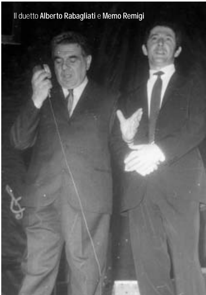
Il duetto Alberto Rabagliati e Memo Remigi