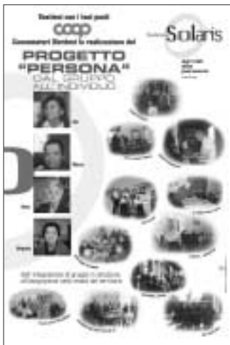
La locandina che promuove il progetto