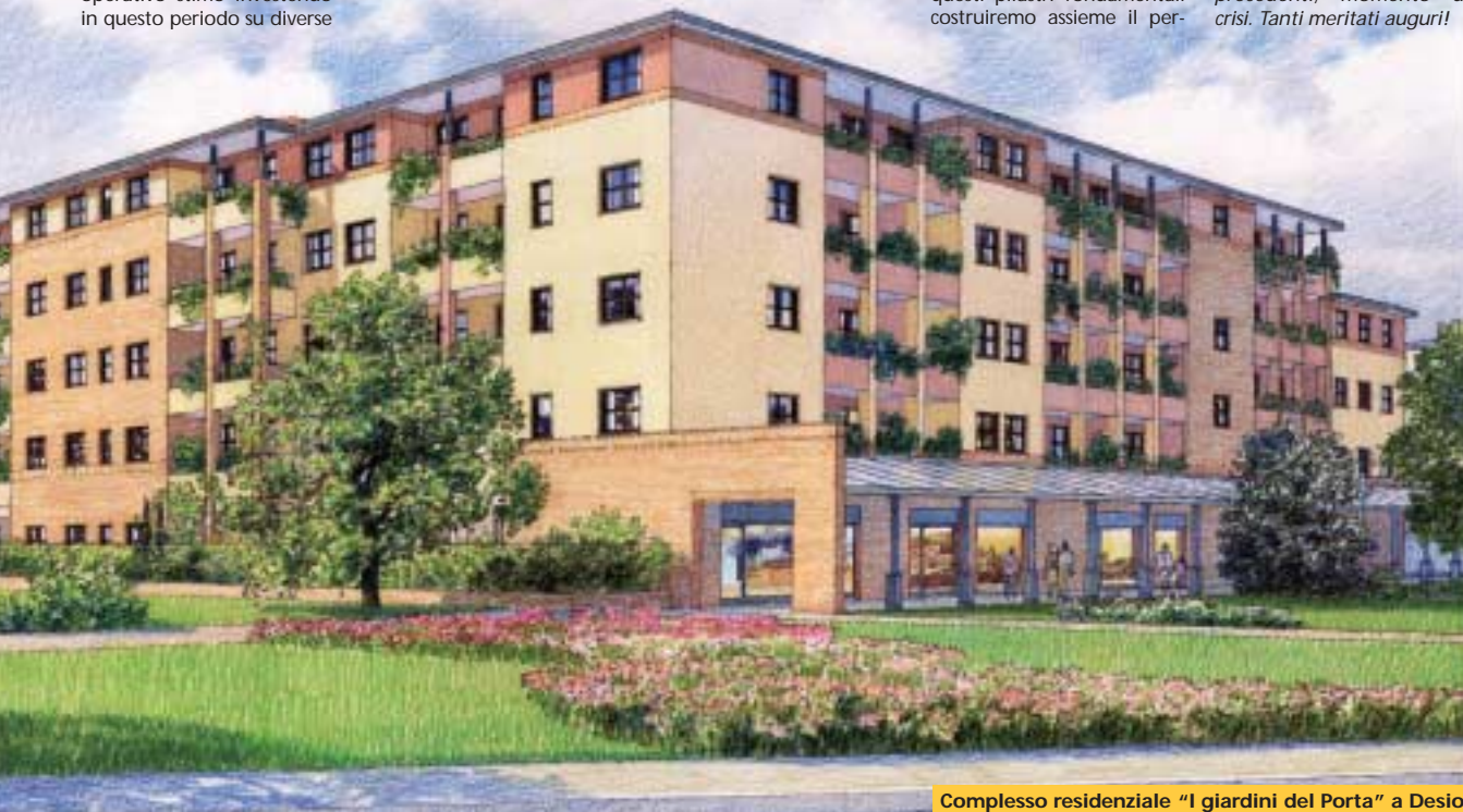
Complesso residenziale "I giardini del Porta" a Desio

Lascio il presidente al suo lavoro, sottolineando che pare che questa Cooperativa abbia trovato la chiave per traghettare "l'impresa" fuori da questo lungo e senza precedenti, momento di crisi. Tanti meriti auguri!