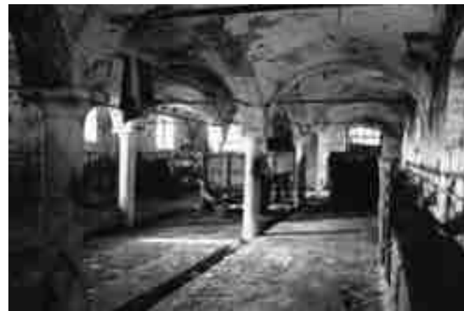
A seram a drè li bestii

"sala da bagno", in cui non comparivano sicuramente bottiglie di acqua di colonia francese, ma, seppure luogo maleodorante, era funzionale ad un buon bagno settimanale (lavarsi troppo sciupava la pelle...) in mastelli di legno pieni di acqua calda. Il cambio di biancheria, che appena preso dalle cassepanche dotati odorava di bucato, era subito impregna-