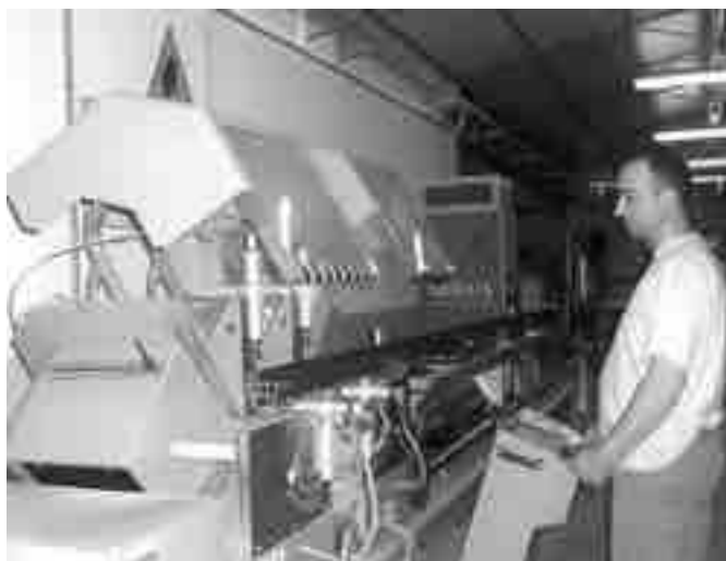
Simone controlla una macchina computerizzata

l'applicazione dei propri sistemi brevettati e degli accessori originali, non compatibili con prodotti di altre marche).